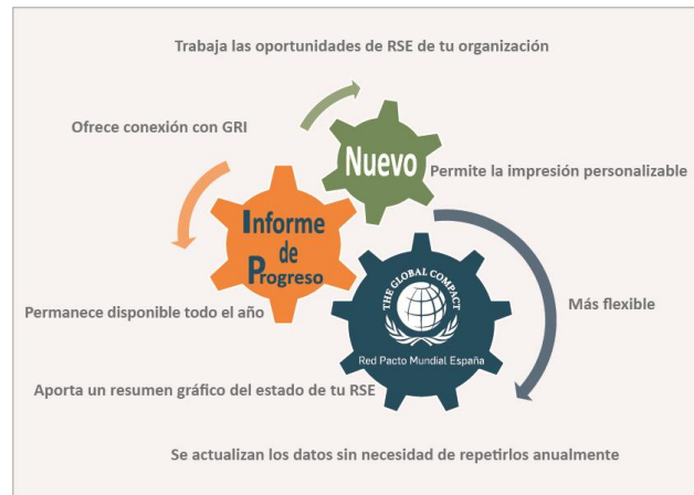
ILUSTRACIÓN 2: VENTAJAS DE LA REALIZACIÓN DE INFORME DE PROGRESOS