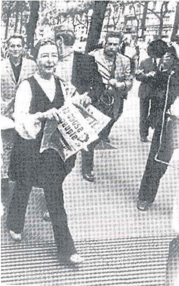
5. Irudia : Simone de Beauvoir prentsa askatasunaren alde manifestatzen (López Pardina, 1999, 153).