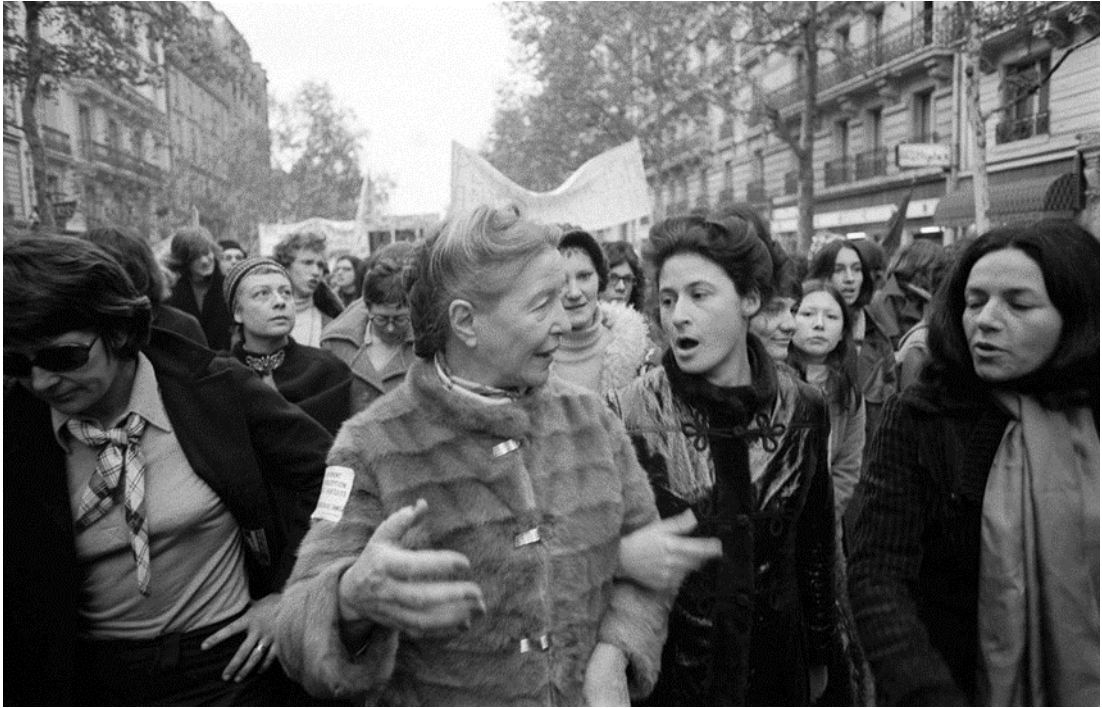
4. Irudia : Simone de Beauvoir abortuaren aldeko manifestaldi batean.