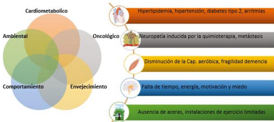
Figura 1: Dominios para el análisis de las características individuales de los pacientes y sus limitaciones (Stout, N. et al, 2020)

encontramos una serie de limitaciones y barreras que hay que tener en cuenta para la prescripción individual. (Stout, N. et al, 2020)