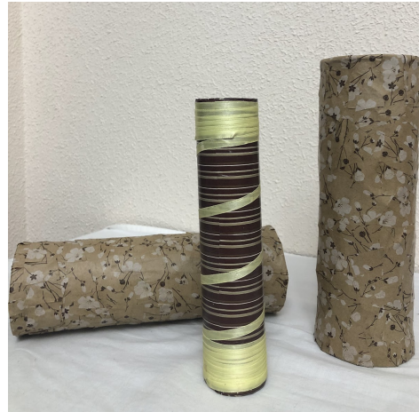
4 irudia. Euri makilak.

Puzzleak (ikus 5 irudia), musika tresna ezberdinen argazkiekin kartoia erabiliz, puzzleak erosteko aukera dago baina musika tresna zehatzak aurkitzea zaila izan daiteke. Segiden liburuxka (ikus 6 irudia), piktogramez egindako liburuxka da, segidak sortuko ditugu piktograma ezberdinekin eta liburuxka txiki bat egingo dugu, segidak gero eta konplexuagoak izango dira, hau da, errazenetatik zailenetara joango dira, liburuxkan dauden piktogramak txaloak, isiluneak eta eskuak hanketan izango dira.