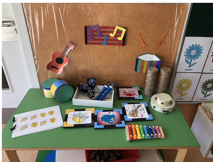
1 irudia. Musikaren espazioa.

Proiektua musika espazio bat sortzean datza, horretarako, gelako zati bat hartuko dugu eta txoko bat sortuko dugu. Mahai baten gainean sortzea musikaren txokoa erabaki dugu, instrumentuak jotzerako orduan erosoak izan dadin. Mahaia paretaren kontra dago kokatuta eta pareta apaintzeko musikarekin erlazionatutako marrazki batzuk jarriko ditugu (ikus 1 irudia). Oso garrantzitsua da sortzen dugun espazioa deigarria izatea, umeen arreta pizteko eta kontuan hartu behar dugu bi urteko umeentzat izango dela, hau da, praktikoa izan behar dela eta umeek beraiek bakarrik jaso behar dutela. Musika-tresnak batzeko eta txokoa txukuna egoteko, kutxa txikiak erabiltzea oso aukera ona izan daiteke.