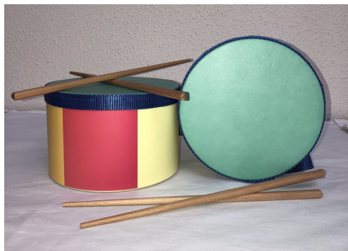
7 irudia. Danborrak. Iturria: egileak egina.

Erosiko ditugun materialei dagokienez, danborrak (ikusi 7 irudia), xilofonoak (ikusi 8 irudia), panderetak (ikusi 9 irudia), triangeluak, bongoak, kutxa txinatarrak, kanpaitxoak, klabeak eta kriskitinak izango dira. Baliabide horiek erostea gomendatzen da, batez ere sortzen duten soinua oso bereizgarria delako eta behar diren materialak garestiak direlako.