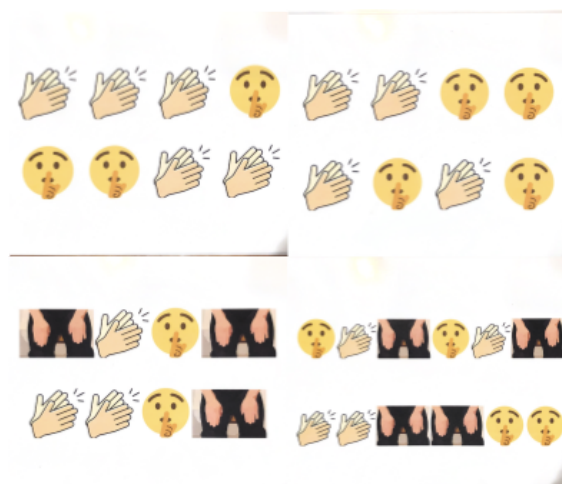
6 irudia. Segiden liburuxka.