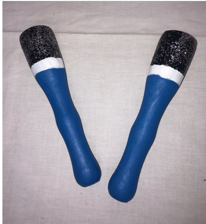
3 irudia. Mikrofonoak.

Mikrofonoak (ikus 3 irudia), egurrezko makilak tenperekin apainduz eta euri makilan (ikus 4 irudia), kartoizko tutuak barrutik zotzekin eta barruan makarroiak, dilistak eta txitxirioak sartuz.