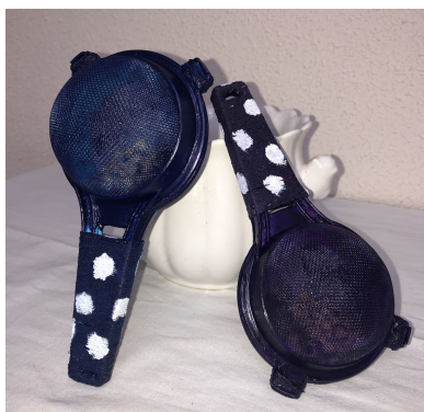
2 irudia. Marakak.

Musikaren txokoa erabiliko diren baliabideei erreparatu, batzuk sortuak egongo dira eta beste batzuk, berriz, erosiak. Sortuko ditugun baliabideen artean, honako hauek egongo dira: marakak (ikus 2 irudia), bi iragazkiekin eta barruan txitxirioak sartuz.