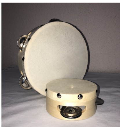
9 irudia. Panderetak.

Kontuan hartu behar da bai sortzen ditugun baliabideak, bai erosten ditugunak kalitatezkoak izan behar direla, hots, nahiz eta merkeagoa izan musika-tresnak sortzea, sortzen direnak kalitatezkoak izan behar dira eta egiten duten soinua benetako tresnen antzeko soinua izan behar dute. Musika-tresna guztiak haurrentzat izan behar dira, hau da, haurren adinetara egokitu behar dira, beraien segurtasuna lehentasuna izan behar delako. Horrez gain, haurrek esploratu behar dituzte baliabideak eta haiekin jolastu, beraz, musika-tresnak apurtu daitezke edozein momentutan.