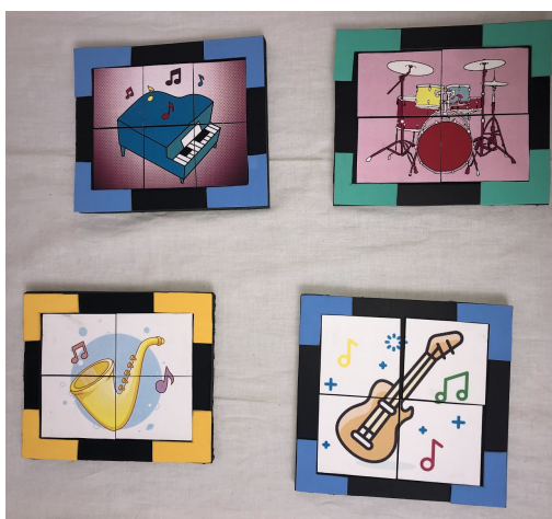
5 irudia. Puzzleak.

Puzzleak (ikus 5 irudia), musika tresna ezberdinen argazkiekin kartoia erabiliz, puzzleak erosteko aukera dago baina musika tresna zehatzak aurkitzea zaila izan daiteke. Segiden liburuxka (ikus 6 irudia), piktogramez egindako liburuxka da, segidak sortuko ditugu piktograma ezberdinekin eta liburuxka txiki bat egingo dugu, segidak gero eta konplexuagoak izango dira, hau da, errazenetatik zailenetara joango dira, liburuxkan dauden piktogramak txaloak, isiluneak eta eskuak hanketan izango dira.