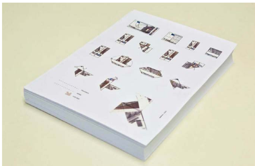
Figura 3 · Daniel Silvo, Sin título, 2010. Taco de panfletos con las instrucciones de plegado de la pajarita origami realizada con billete de 5 euros.