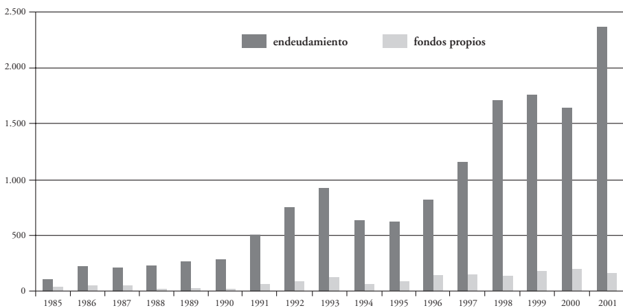
Gráfico 2. Capital percibido por las empresas en el mercado financiero americano (en miles de millones de $).