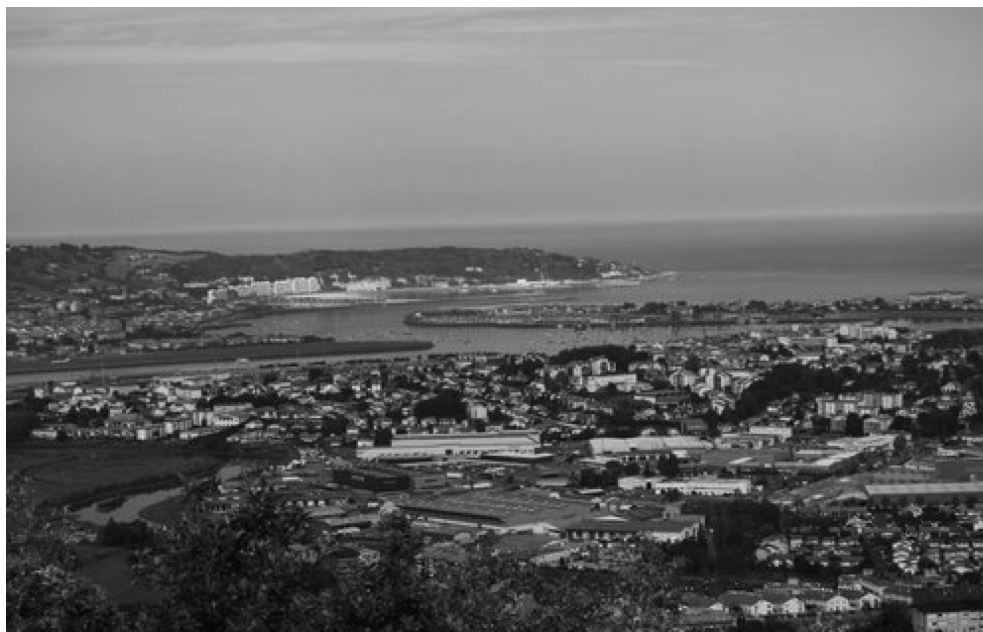
Figura 1. Bahía de Txingudi.