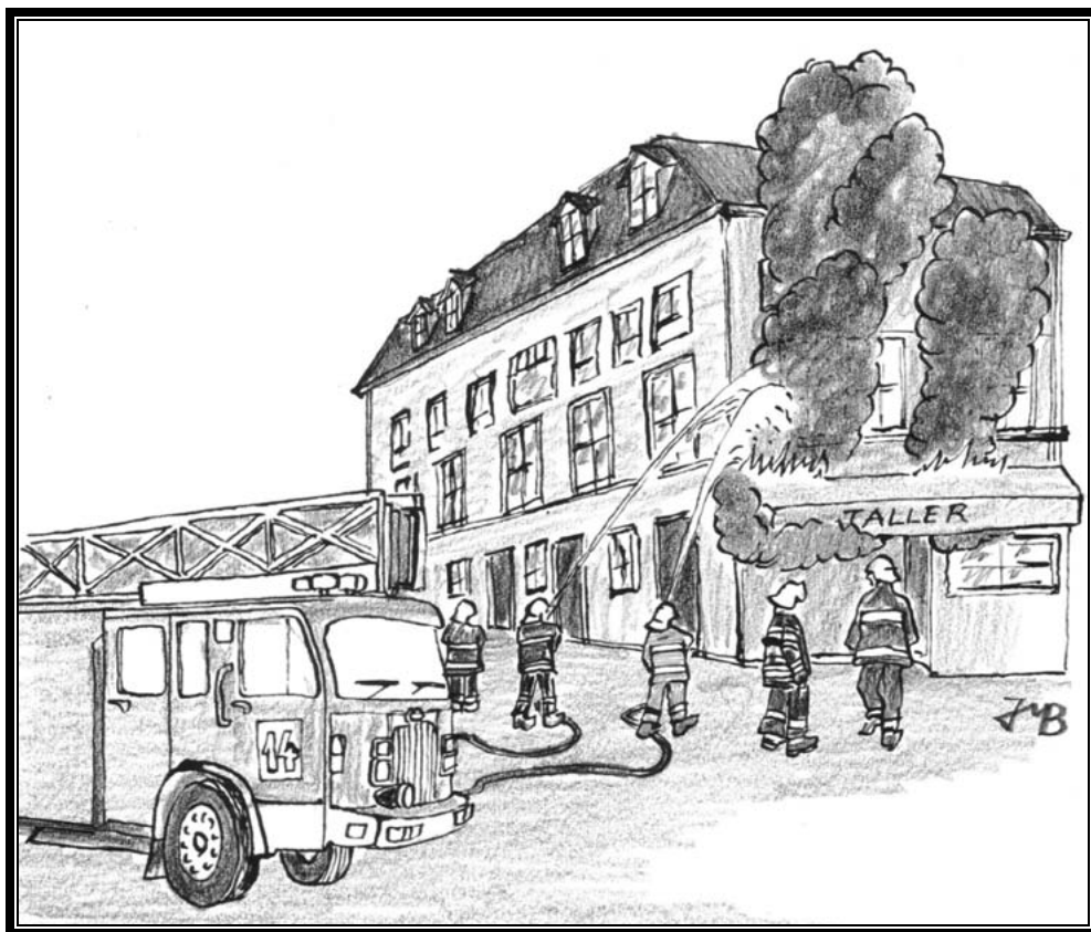
El incendio se produjo por un cortocircuito...