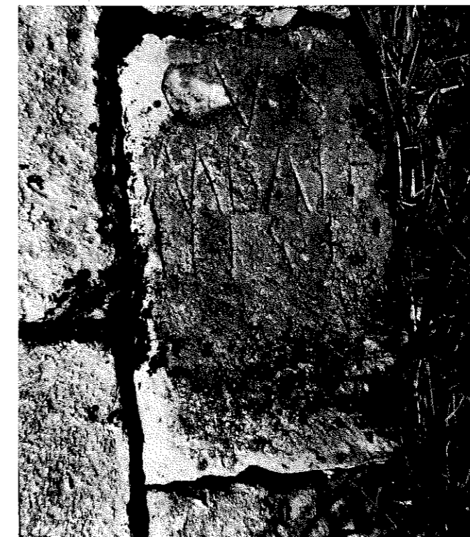
FIG. 7. San Román de San Millán.