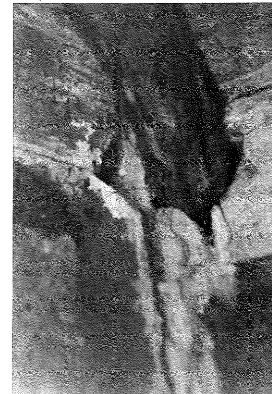
FIG. 10. San Román de San Millán .