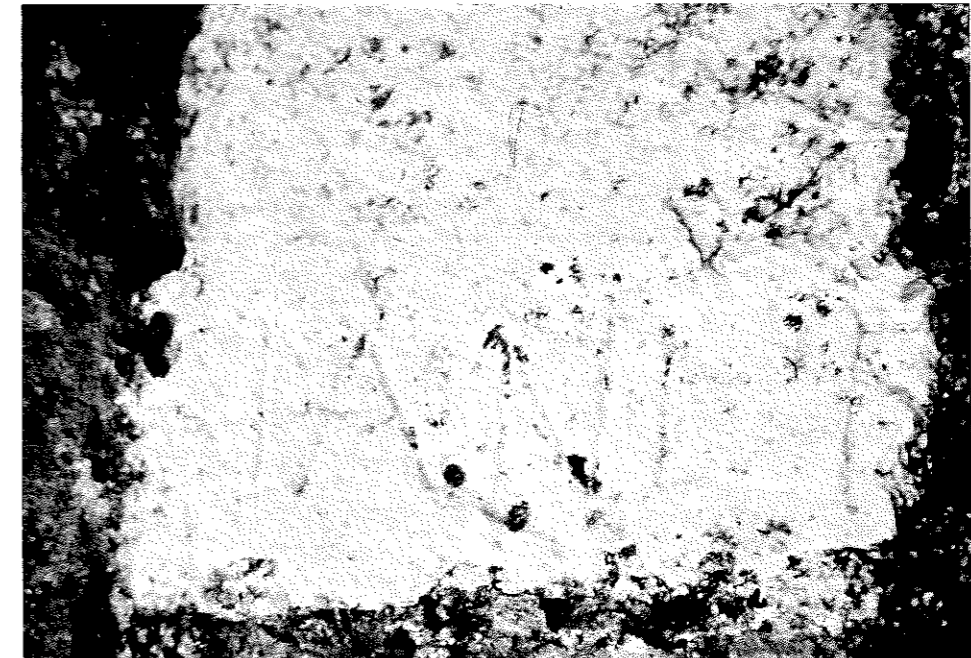
FIG. 6. San Román de San Millán.