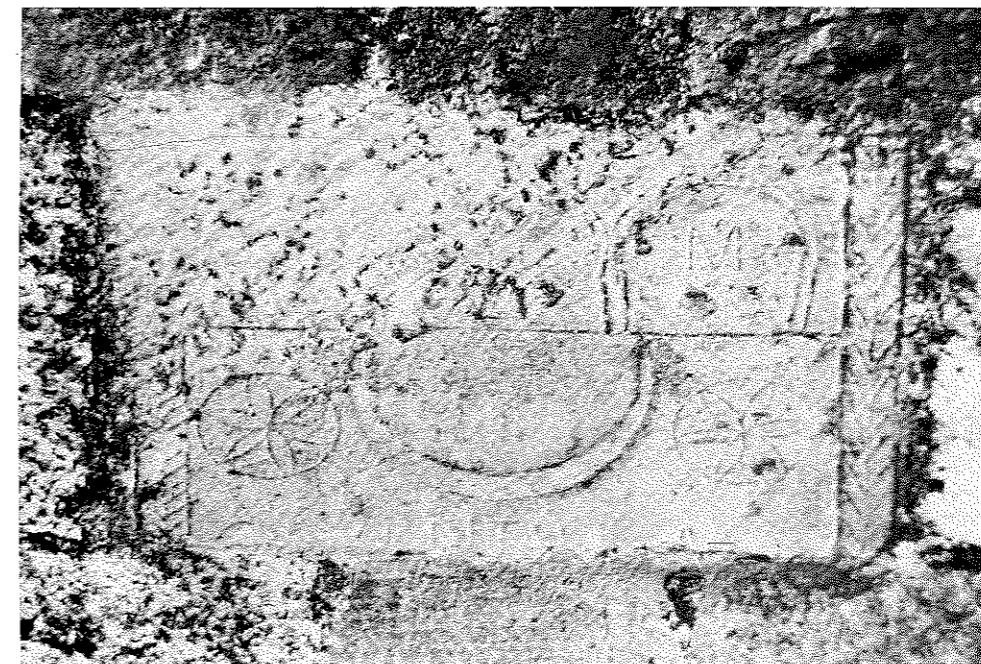
FIG. 5. San Román de San Millán.