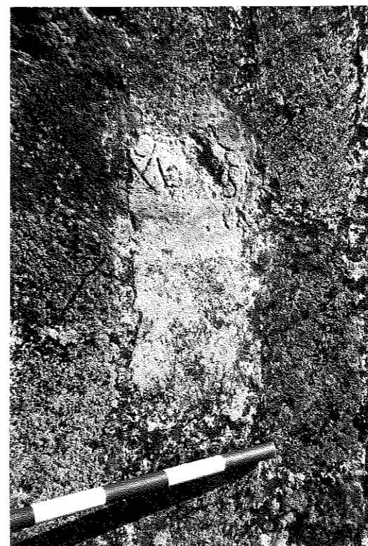
FIG. 9. San Román de San Millán .