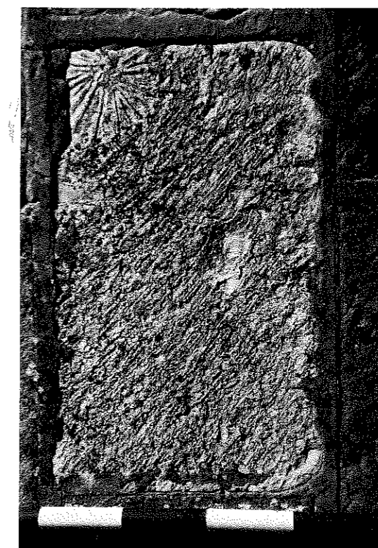
FIG. 2. San Román de San Millán.