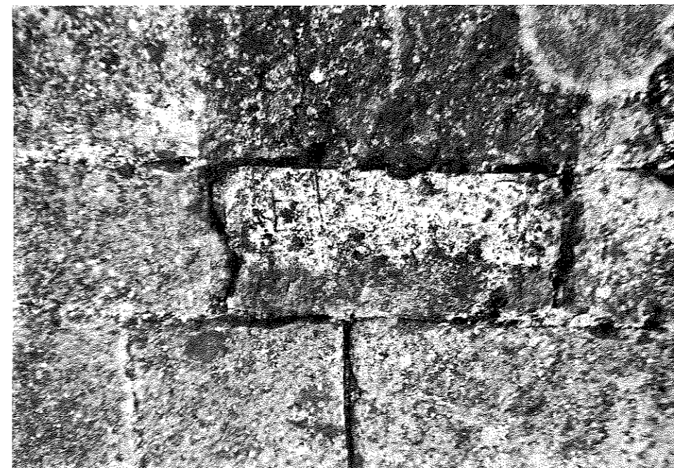
FIG. 8. San Román de San Millán .