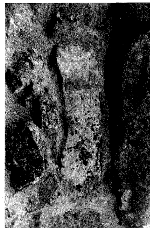
FIG. 1. San Román de San Millán.