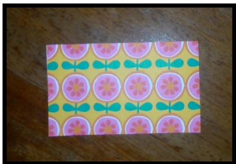
Fig.4. Preguntas sobre desarrollo sostenible