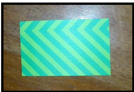
Fig.3. Preguntas sobre el estilo de vida