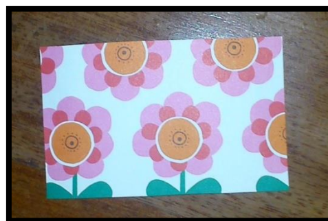
Fig.2. Preguntas sobre el impacto medioambiental