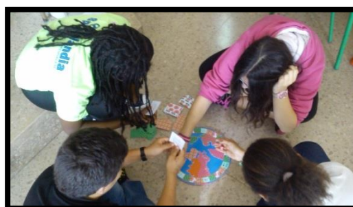
Fig.5. Alumnos y alumnas jugando

Un elemento clave a la hora de poder analizar tanto la intervención como los resultados obtenidos ha sido el grado de participación de los alumnos en el juego, que ha sido muy adecuado, a pesar de las pequeñas disputas entre ellos por motivo de los desacuerdos en torno a alguna respuesta.