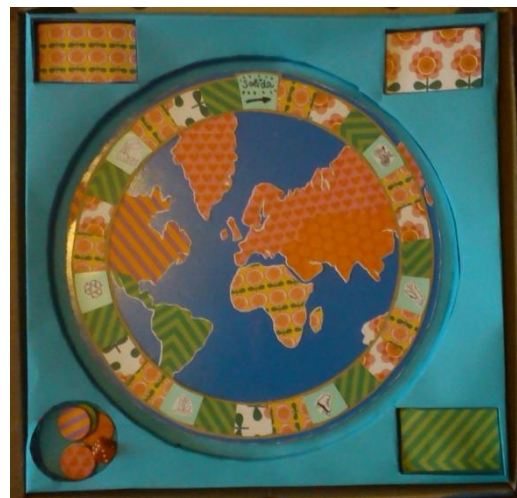
Fig. 2. Interior de la caja