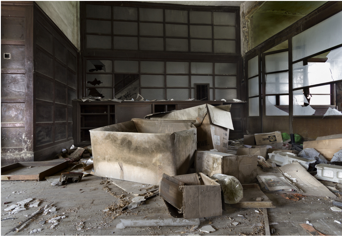
El edificio de las oficinas mantiene su estructura, así como una gran cantidad de documentación. Los restos de actividad son visibles todavía.