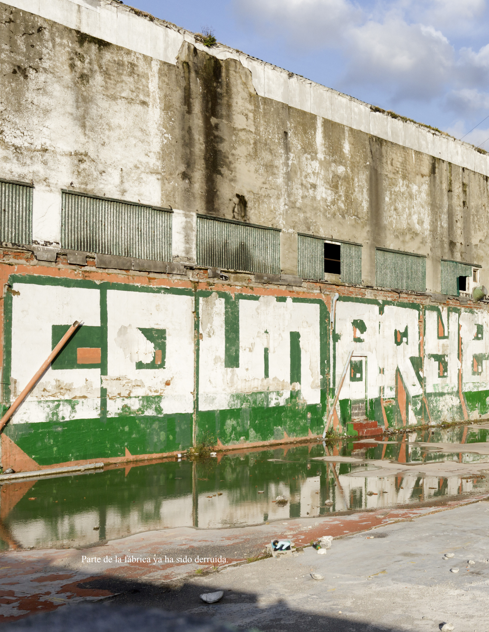
Parte de la fábrica ya ha sido derruida.