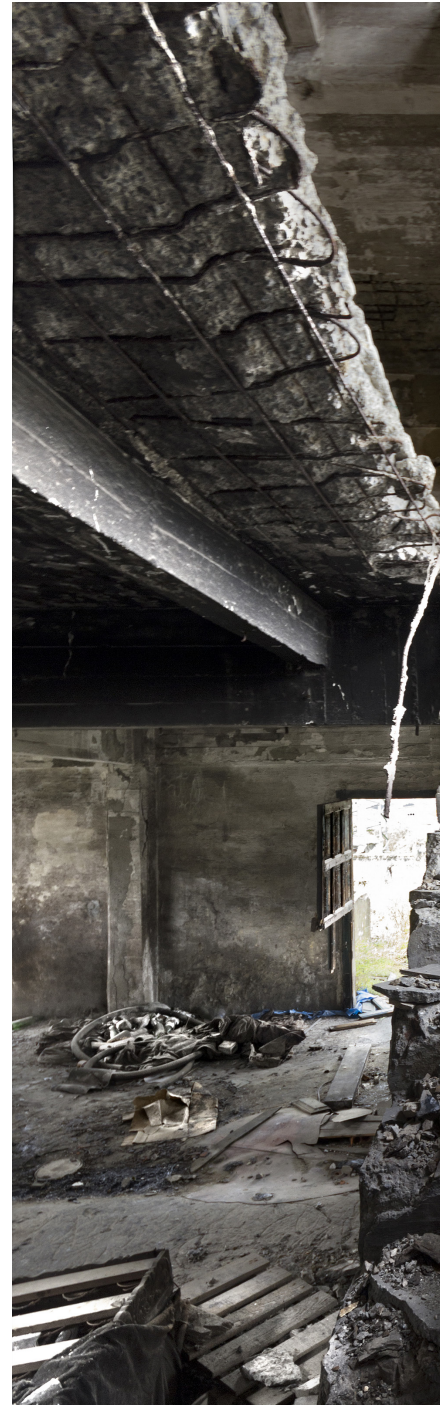
El enorme hueco dejado por el montacargas (pág. anterior) comparte la torre de procesamiento químico entre escaleras desvencijadas y restos de basura