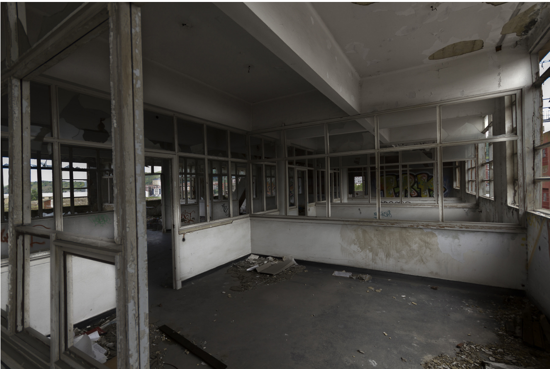
Las oficinas de Elorriaga se encuentran en un estado lamentable, en el que predomina la basura y los restos de su actividad.