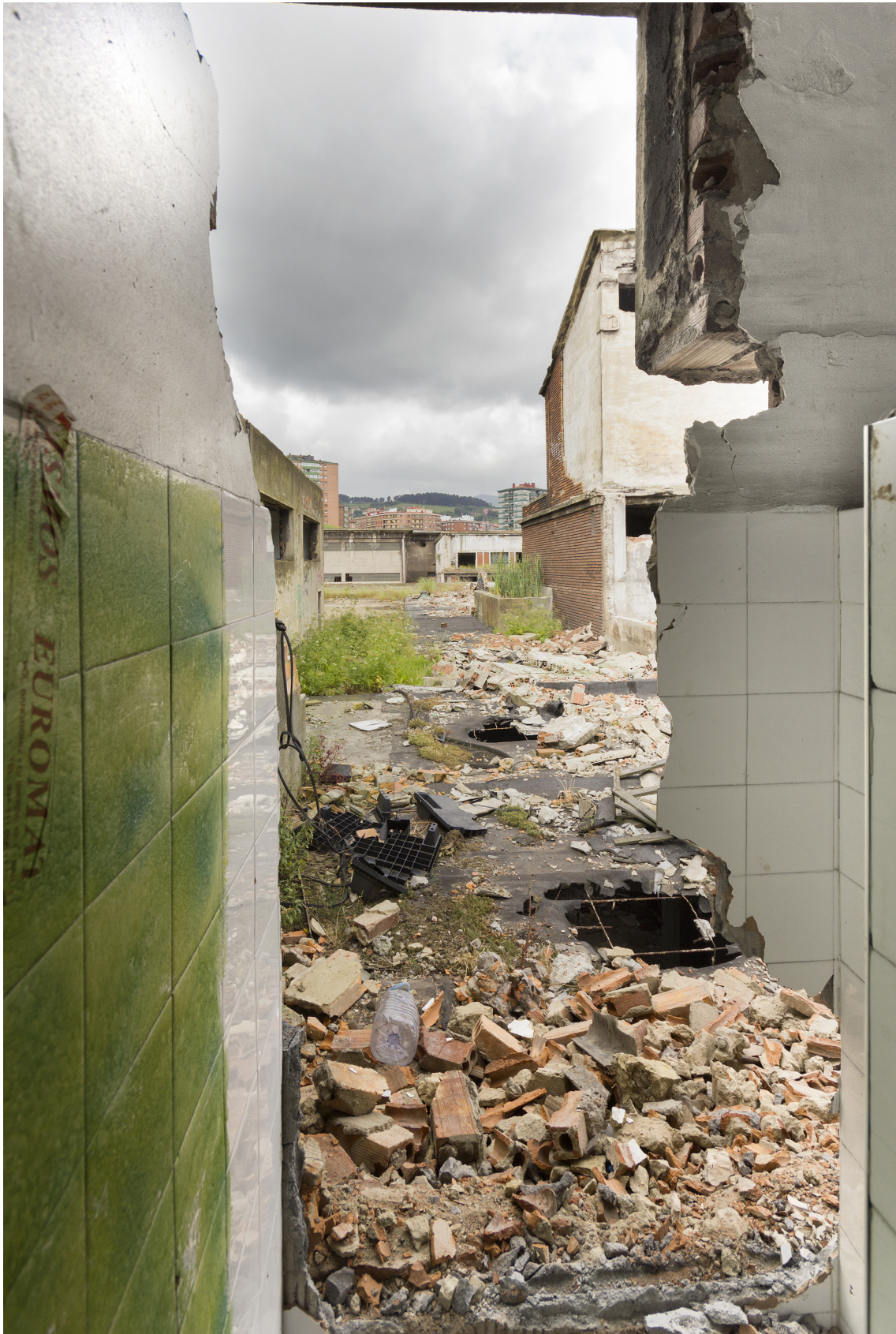
Los destrozos en la estructura son evidentes y solo quedan restos de lo que un día fue una fábrica en pleno rendimiento, tras el paso de los ladrones de chatarra.