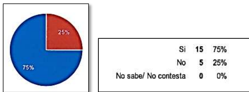
Gráfico 2: Correspondiente a la pregunta: ¿Le gustaría que su hijo o hija en la escuela acudieran a clase de religión? *(Ver Anexo 2)

El 90% valora que es importante conocer las diferentes religiones y costumbres de un país. Mientras que un 95% cree que conocerlas proporciona un conjunto de normas morales claras y convenientes para los hijos/as.