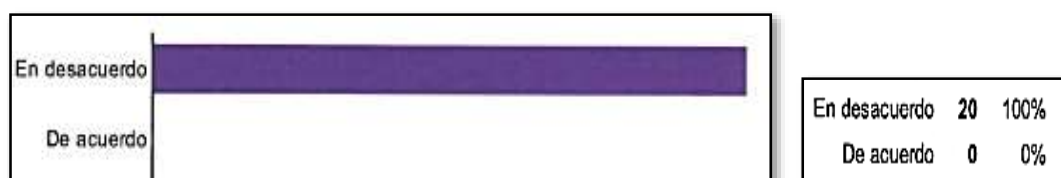
Gráfico 3: Correspondiente a la pregunta: ¿Se da a conocer diferentes culturas y costumbres en el aula de sus hijos? *En desacuerdo o de acuerdo a la afirmación. (Ver anexo 2)

Todos/as consideran que cada vez conviven más culturas y religiones diferentes en el aula. Sin embargo, opinan que la escuela no está preparada para la integración escolar del alumnado. A su vez, el 100% sostiene que no se dan a conocer las diferentes culturas y costumbres que conviven en el aula.