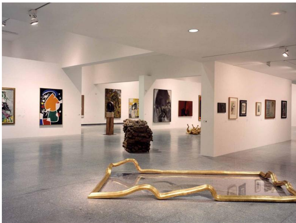
Fig. 3. La Colección I

del arte español, vasco y alavés a lo largo del siglo XX hasta la actualidad, poniendo especial interés en los años posteriores a 1950. Para ello se escogen obras y artistas especialmente representativos, mostrando así al público algunas de las piezas con más renombre 19 .