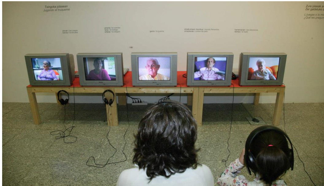
Fig. 7. Recuerdos compartidos.

esta forma quedan para la posteridad. La grabación, Jugando al truquemé , se sitúa en relación a una serie de obras que exploran temas como la melancolía, la niñez perdida, el paisaje y su irreversible cambio a lo largo del tiempo, el envejecimiento o la muerte (fig. 7).