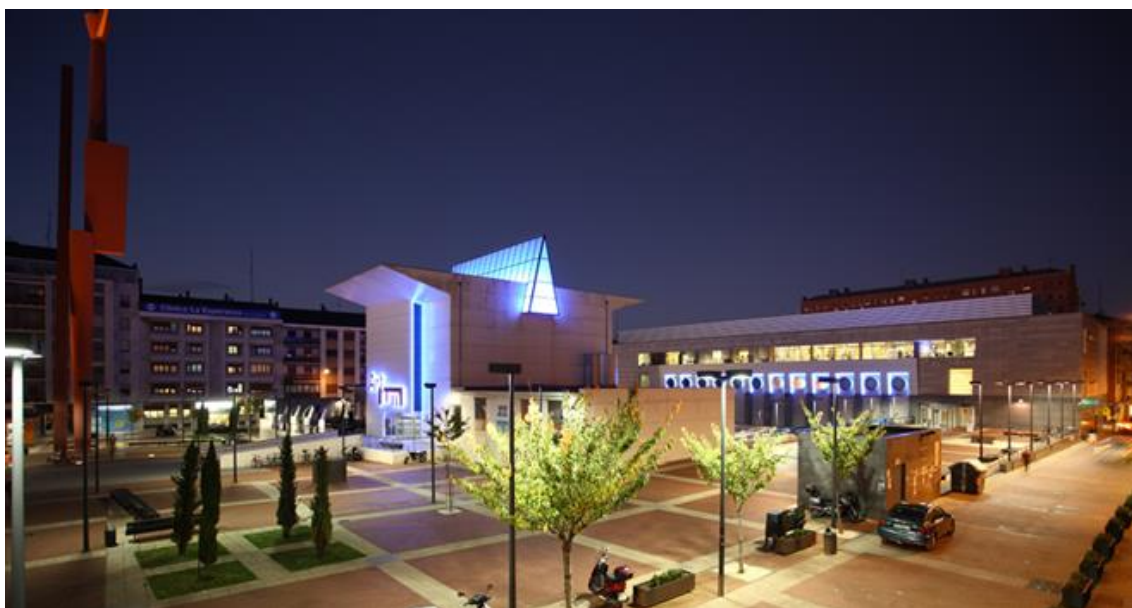
Fig. 2. Edificio Artium.