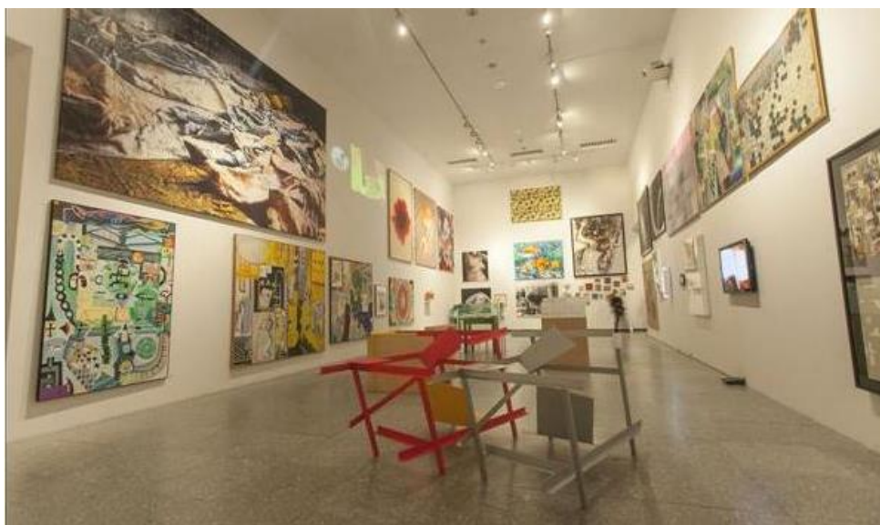
Fig. 5. Tesoro Público

algo habitual en la conformación de colecciones tanto públicas como privadas 36 . Estas cuestiones quieren manifestarse en la exposición, haciendo ver que, aunque incompleta, es capaz de crear significados para el presente y sobre todo constituir un patrimonio con valor propio (fig. 5).