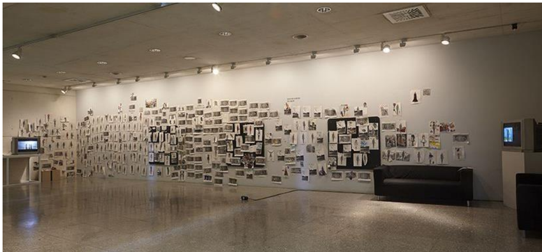
Fig. 6. Taller en Antesala

A partir del año 2005 DEAC comisaría diversas exposiciones conformadas también por piezas de los fondos del museo. Las muestras son de pequeño formato y se sitúan en la antesala del edificio, un espacio de bienvenida al que se puede acceder de forma gratuita. Esta medida facilita la entrada del visitante, y es además un lugar de tránsito hacia exhibiciones temporales y hacia la colección permanente. La antesala se divide entre la exposición y un taller anejo donde se proponen actividades que los asistentes pueden realizar y cuyos resultados son después colocados en las paredes de la propia antesala ( fig. 6 ). Se incluye además un espacio de lectura y documentación 44 .