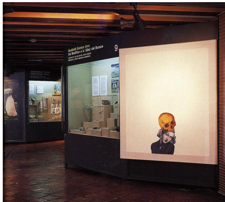
Fig. 4. Gótico... pero exótico.

No se escoge un número masivo de obras: prima un criterio funcional y estético, de tal forma que unas pocas piezas puedan encajar de manera natural en las distintas arquitecturas, realzándose mutuamente ( fig. 4 ). El adjetivo exótico alude a lo inesperado de las conexiones que surgen entre las imágenes contemporáneas y los distintos entornos medievales, renacentistas y barrocos. La exposición se completa con una serie de relatos que recoge el catálogo de la misma; se trata de narraciones breves elaboradas por distintos escritores y artistas de los fondos de Artium, a quienes se les pide crear nuevas historias y significados para el casco medieval del mismo modo que ha hecho Artium con sus obras 21 .