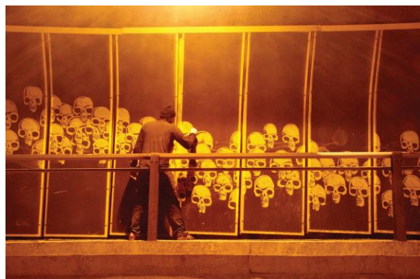
Figura 9. Alexandre Orion creando su obra Ossario en 2006.

El primer artista urbano en utilizar esta técnica es Paul Curtis (también conocido como Moose ), aunque la primera pieza a gran escala de grafiti inverso fue realizada por el artista brasileño Alexandre Orion en Sao Paulo en el año 2006. Este artista realizó esta obra en un túnel oscurecido por el hollín de los coches, para concienciar a la gente acerca de la contaminación que producen los automóviles. La intervención fue llamada Ossario (osario), medía más de 300 metros y constaba de más de 3500 calaveras, convirtiendo así el túnel en una