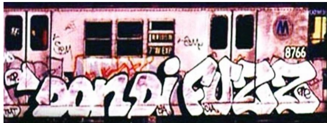
Figura 5. Obra de extremo a extremo realizada por Dondi White y Fuzz en 1980.

- Whole car o Vagón entero : se trata de una obra que ocupa un vagón entero, de arriba a abajo y de extremo a extremo. Los vagones enteros suelen ser pintados por grupos de escritores que comparten la pintura, y por lo general se trabaja conforme a un boceto en papel trazado anteriormente. Cuando se trata de un grupo, los escritores más experimentados se encargan de dibujar los diseños preliminares y de pintar las decoraciones y los contornos de los nombres, mientras que los escritores con menos práctica realizan las tareas de relleno y pintado de los fondos.