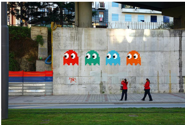
Figura 10. Instalación realizada por Invader en la Avenida Abando Ibarra de Bilbao en 2007. Pertenece a la serie BBO, nº 23-26.

Con una técnica cercana al mosaico, encontramos a Invader, pseudónimo de un conocido artista urbano francés, que toma su alias del videojuego de 1978 Space Invaders , y cuya verdadera identidad es desconocida. La obra de Invader está inspirada en la pixelación de los videojuegos de 8 bits de los años 70 y 80 y muchas de sus piezas se inspiran en personajes de videojuegos que compone con pequeñas baldosas cerámicas cuadradas, a modo de teselas de mosaico, en el que cada baldosa representaría un pixel. Se documenta cada intervención en una ciudad como una "invasión", y se realizan libros y mapas de la ubicación de cada uno de sus mosaicos.