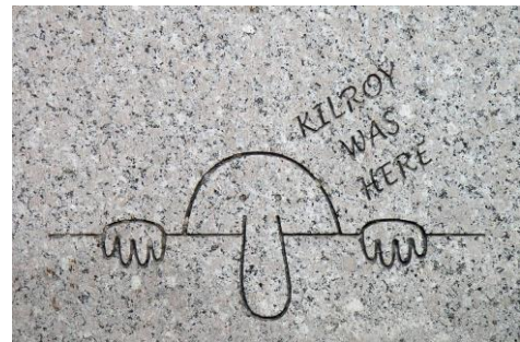
Figura 3. Inscripción de Kilroy en el Memorial de la II Guerra Mundial (Washington D.C.).

Uno de los primeros artistas en considerar el grafiti como arte fue el fotógrafo húngaro afincado en París Brassai, pseudónimo de Gyula Halász. En el año 1930 Brassai comenzó a interesarse por el grafiti; de hecho, fue uno de los primeros en identificar la importancia artística de esta forma de expresión, aunque ya existían estudios arqueológicos sobre la misma. El fotógrafo realizó durante toda su vida un trabajo de investigación en el que documentaba los grafitis que encontraba en un cuaderno, en el que dibujaba y anotaba las direcciones exactas de los lugares que elegía antes de hacer su fotografía. Estudió incluso la evolución del grafiti, así como su transformación y alteración en las paredes con el paso del tiempo.