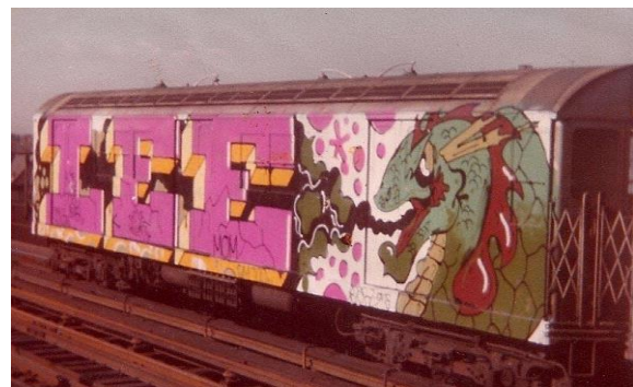
Figura 4. Grafiti que ocupa el lado completo de un tren (llamado de vagón entero) realizado por Lee Quinones en 1979.

Además del estilo, los escritores empezaron a experimentar con el tamaño y el color; descubrieron que podían cubrir grandes áreas de color con la pintura en spray y se creó una nueva forma, la pieza ( piece ). El nombre proviene de la abreviatura de pieza maestra ( masterpiece ) y las primeras eran simples firmas delineadas con pintura de otro color. La escala de las pinturas creció hasta ocupar, en 1975, el lado completo de un tren, incluidas las ventanas.