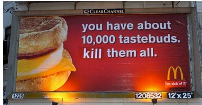
Figura 8. Adbusting realizado por Billboard Liberation Front en 2010. La instalación altera el mensaje de McDonald's, originalmente You have about 10.000 tastebuds, use them all (Tienes 10.000 papilas gustativas, úsalas todas) cambiando la palabra use (usar) por la palabra kill (matar) y el eslogan I'm loving it (Me encanta), por I'm sick of it (Estoy harto de ello).

El colectivo de San Francisco Billboard Liberation Front se ha dedicado a realizar adbusting en las vallas publicitarias desde la década de 1970 y en Canadá el colectivo Adbusters organiza actividades similares y publica una revista homónima de gran tirada, que se distribuye por todo el mundo.