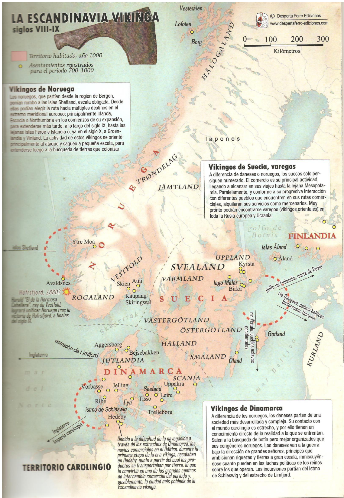
Mapa 2. Países escandinavos y regiones durante la época vikinga. Siglos (VIII-IX). 54