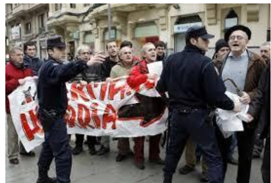
Entzierroaren monumentua jarri zuteneko tentsio unek