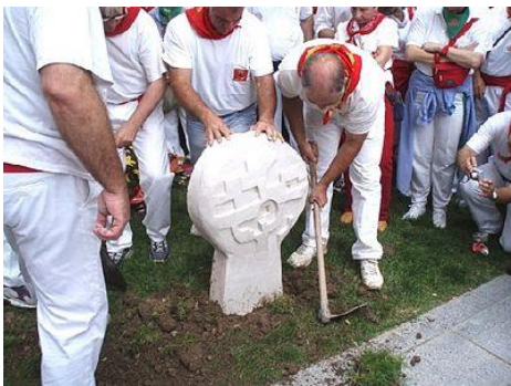
Estelaren birkokatze unea

Gauzak horrela, abenduaren 15ean estela birjarri zuten. Aurreko hilabeteetako plastikozko estela haiekin zutela, errepresentazio instituzionalik gabeko ekitaldia ospatu zuten erraldoiekin, dantzariekin eta txaranga doinuekin alaituta. Behintzat borroka hori irabaztearen sententziarekin geratu ziren. Sabino Cuadrak adierazi bezala, “nahiz eta