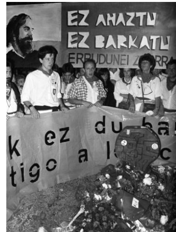
1988ko omenaldi jendetsua

Lehenik, 1978 ondoko urteetan gertatutakoak oihartzun handiagoa izan zuen. Honek bi arrazoi izan litzake: batetik, denboran hurbilagoa zenez, herritarrek biziago eta gertuago sentitzen zuten; bestetik, 1980ko hamarkadako urteak biziki gatazkatsuak izan ziren eta ondorioz, mugimendu honek, beste askok bezala, indar handia izan zuen.