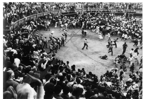
Polizia armatuak zezen plazara

Asaldadura ikaragarria izan zen ihes egiten eta hareara poliziei aurre egitera jaitsitakoen artean. Jasotako erantzunarengatik poliziek atzera egin behar izan zuten birritan, berriz ere bortiztasun handiagoz sartzeko. Eraso hauetan nahieran erabili zituzten ke-potoak, borrak, gomazko pilotak eta suzko armak (CIPMP, 1978: 10-11).