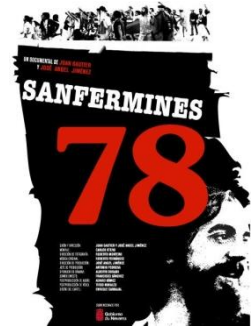
Sanfermines 78 dokumentalaren kartela