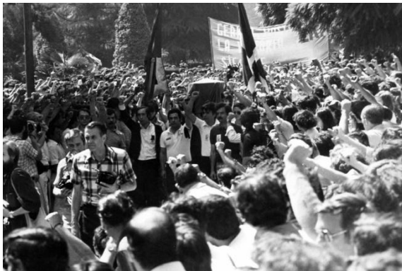
Germánen hiletan hilkutxa eramaten

Hurrengo egunean hirian anabasa eta suntsiketa ziren jaun eta jabe. Peñek deialdia egin zuten 30.000 pertsona baino gehiago bertaratu ziren Germánen hiletara joateko. Hilerr