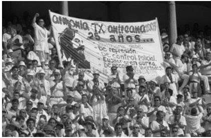
Zezen plazako peñen pankarta gertakarien 26. urteurrenean

antzekoak aldarrikatuz. “El silencio” jo eta plaza zutituta isiluneko minutu bat egiten zen. Horren ostean, maiz “Herriak ez du barkatuko”, presoen eta amnistiaren aldeko eta poliziaren kontrako aldarriak oihukatu eta “Que se vayan”, “Eusko gudariak” edota “Hator hator etxera” bezalako abestiak kantatu ohi ziren. Zenbait urtetan, hainbat peña zezenketak bukatu aurretik atera ziren, 1981 eta 1988an kasu ( Diario de Navarra , 1981/07/09 eta 1988/07/09). Edonola ere, gaur egunera arte mantendu den ohitura izan da zezenketak amaitzean peña guztiak musikarik gabe eta pankartak tolestuta irteteara