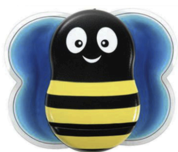
Figura 1: Buzzy® , dispositivo que combina frío externo y vibración utilizado durante el proceso de vacunación 6,7,8 .

nervios receptores de dolor aferentes (Fibras A-delta rápidas que transportan dolor agudo y fibras C lentas no mielinizadas que transportan mensajes de dolor crónico) son bloqueadas por fibras A-Beta de gran diámetro no nociceptivas. Éstas inhiben indirectamente los efectos de las fibras dolorosas “cerrando la puerta” a la transmisión de su estímulo 5,6,7,8,13,16,20 . El frío prolongado estimula las fibras C y bloquea las señales de dolor de las fibras A-delta 2,5,8,16 .