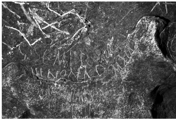
FIGURA 5. Inscripción n.º 71, en el sector X de la cueva.