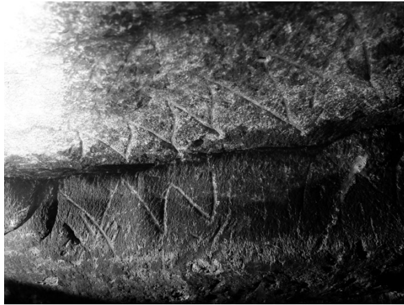
FIGURA 4. Fotografía del pseudo-epígrafe n.º 52 realizado en la pared inferior de una cornisa rocosa; sobre él se observa un grabado sinuoso similar, aunque en posición inversa, al de la supuesta inscripción latina