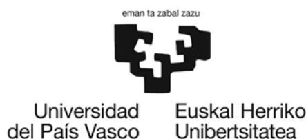
Figura 1. Logotipo de UPV/EHU

Recuperado de: https://www.ehu.es/es/web/gizartea/upv-ehuren-logo-orokorrak