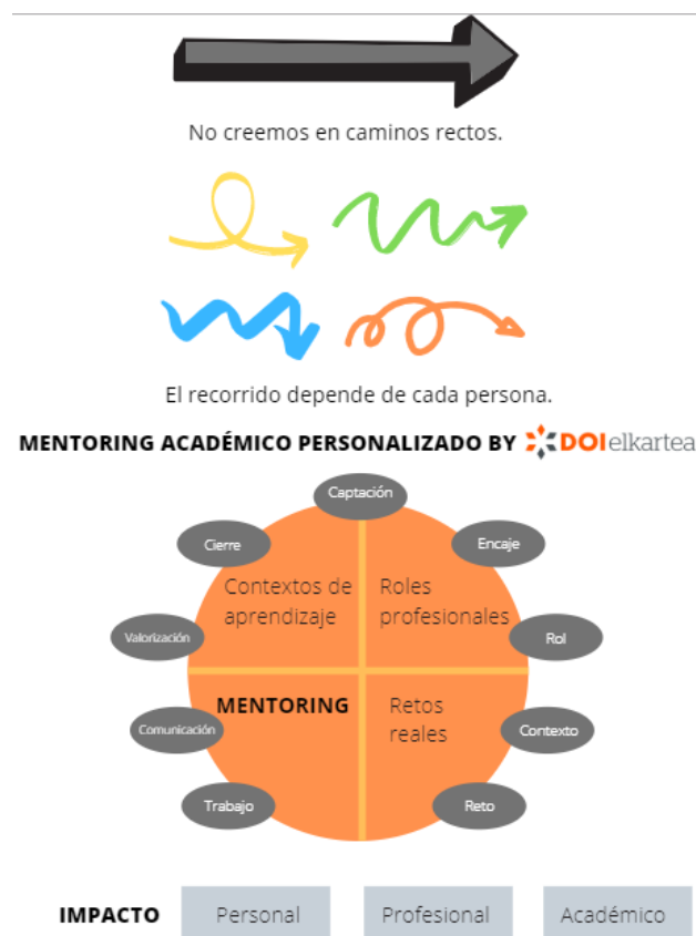
Figura 9. Resumen visual del mentoring académico personalizado de DOI elkarte

Durante la década de 2010, en la UPV/EHU y en el País Vasco, en general, se han diseñado y puesto en marcha, distintos programas de mentoring, enfocados a la orientación e inserción laboral (alumnado últimos cursos) y la mejora de la competitividad de emprendedores, pymes y pequeños comercios. En cambio, no hemos encontrado evidencias del uso del mentoring, como herramienta educativa, bien integrada en los planes curriculares oficiales, bien de manera complementaria, a los programas oficiales de enseñanza-aprendizaje. Ante este gap y las ventajas que puede ofrecer el mentoring en el entorno educativo, desde DOI elkarte, proyecto spin-off de UPV/EHU se han organizado las primeras experiencias de aprendizaje basado en el mentoring. En este caso, con el objetivo de aumentar la interdisciplinariedad estas experiencias han sido puestas en marcha por una organización híbrida, formada por alumnado, profesorado y profesionales en activo, de distintas empresas vascas. Al fin y al cabo, los programas de mentoring desde la asociación DOI elkarte, para la innovación social, educativa y de gestión, han sido diseñados a partir de una combinación intencionada de distintas metodologías educativas activas: aprendizaje en contextos reales, aprendizaje basado en retos reales y el role playing profesional (véase Figura 9 para resumen visual).