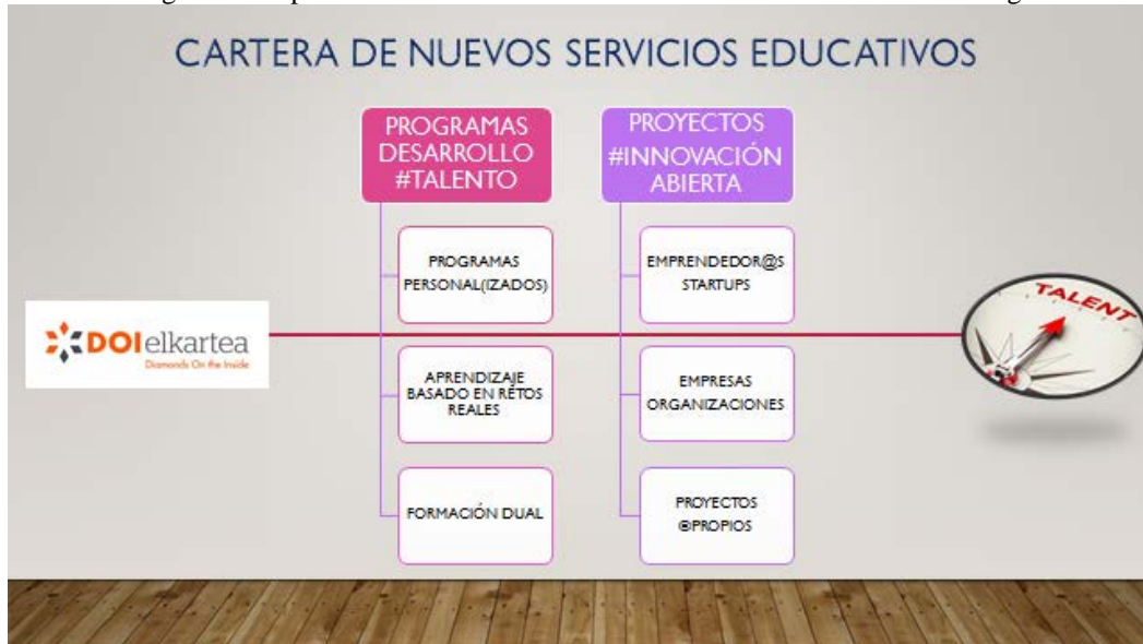
Figura 4. Propuesta de nuevos servicios educativos basados en el mentoring