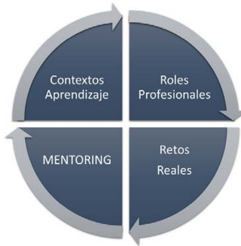
Figura 5. Mix de metodologías pedagógicas del programa de mentoring: asociación DOI elkarte