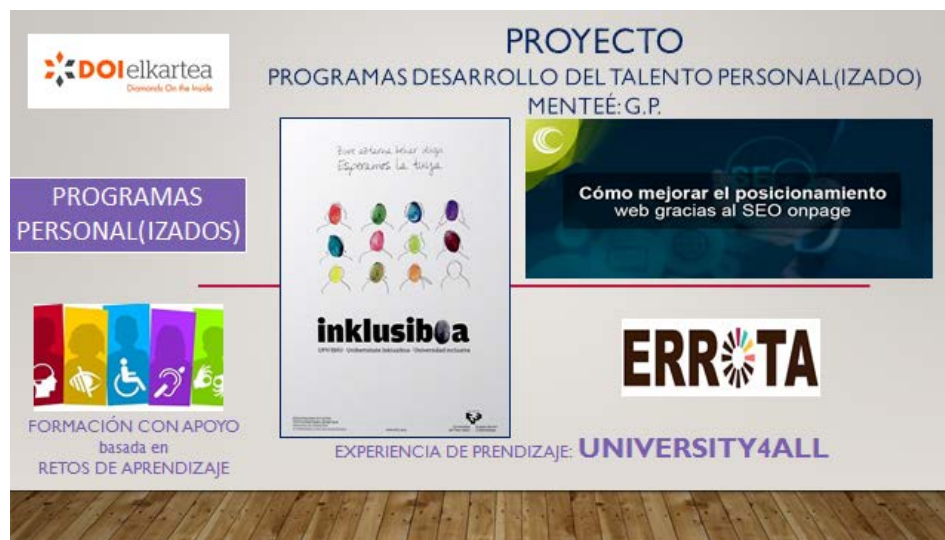
Figura 7: Mentoring académico con alumnado con necesidades educativas especiales

En septiembre de 2018, DOI elkarte puso en marcha una segunda experiencia de mentoring, de tipo inclusivo, con un alumno (G.P.) del cuarto curso del Grado de Marketing que se imparte en la Facultad de Economía y Empresa de Bilbao (UPV/EHU), con distrofia muscular y un grado de dependencia del 77%.