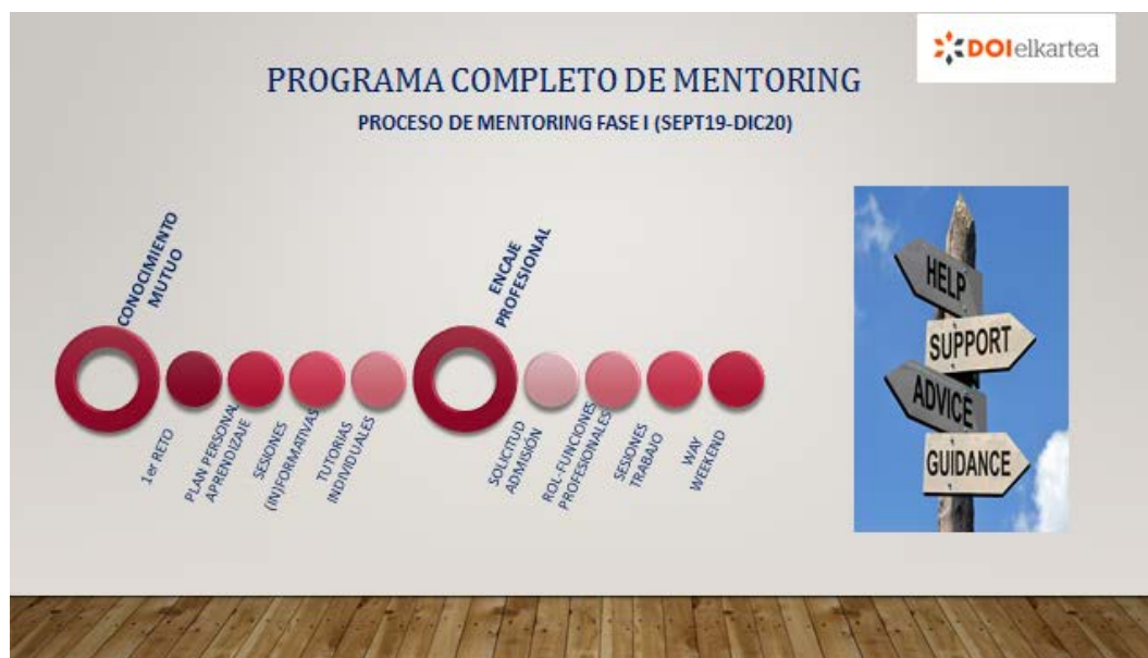
Figura 8. Fases iniciales del programa de Mentoring curso 2019/20

La tercera experiencia de mentoring académico puesta en marcha por DOI elkarte al comienzo del curso académico 2019/20, cuenta con la participación de 3 menteés : 2 alumnas del doble grado de Derecho y ADE (N.G. del segundo curso e I.J. del cuarto curso) y un alumno del segundo curso del Grado ADE.