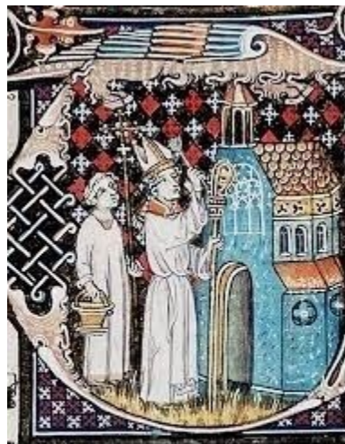
3. Irudia Elizaren kanpoaldeko ihintzadura, Hagako misala 192 orr., Haga

Lehen elizaren kanpoaldea ihintzatu egin den bezala, orain barrualdearen momentua ailegatuko da. Oinarrietatik hasita, hiru aldiz tenplu osoko barrualdeko murrak bedeinkatuko ditu apezpikuak gregoriar-urarekin. Aspersio hirukoitz honek sinbolikoki ere paralelotasun bat dauka. Izan ere, katekumenoak bataiategian hiru aldiz sartzen ziren bataioaren prozesu osoa gauzatzeko. Horrela, eraikuntzaren aspersioa, eraikuntzaren bataioarekin parekatzen da. (ikus 3. irudia).