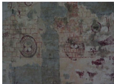
10. Irudia Murru zuzenaren aldeko horma-pinturak, PETRA S.COOP.

Lehenengo eta bigarren geruzen tartea oso mehea den kare-esne batek banatzen ditu. Alabaina, bi geruzen artean joera aldaketa nabaria dago. Bigarren geruza honetako dekorazio hau harlanduzko lana imitatzen duen lauki zuzenetan oinarritzen da. Jatorrian abside osoan aurkitzen zirenak, gaur egun bakarrik leihoaren barrualdean mantentzen dira. Hala ere, absideko murruan dekorazio honen arrastoak antzematen dira oraindik ere. Argazkietan agertzen zaigun bezala, abside osoan zegoen harlandu hau imitatzen zuen dekorazioa lehenengo geruzako elementuak ikusteko kendu egin