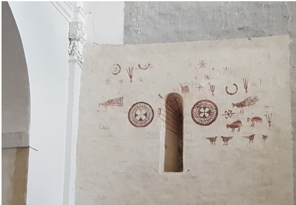
9. Irudia Arbuluko Tourseko San Martin eliza

abside aldean bistakoak izaten jarraitzen dute. Zaharberritzaileek nahita erromaniko eta gotiko garaiko murruek artean desberdintasun argi bat utzi zuten, jatorrizko tenpluaren murrua eta profila argi ikusiz (ikus 9. irudia).