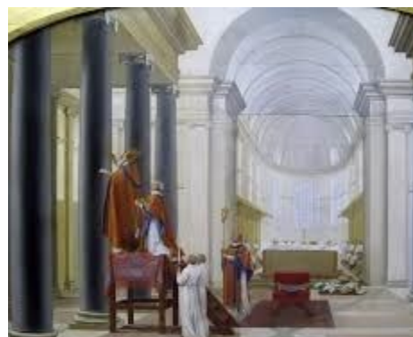
1. Irudia Eustache Le Sueur, Eliza kartujo baten sagarapena , Paris, Louvre museoa

Ondoren, elizaren barrualdeko hormetan, gure gaiarentzat interes handien daukan pausoa gauzatuko zen. Momentu honetan, apezpikuak elizaren barnealdean, sagarapeneko hamabi gurutze margotuko ditu. Gurutzeak margotuak izango ziren lekura ailegatzeko, kasu askotan paretan altuera batean aurkitzen zirelarik, apezpikua mitra eta euri-kapa bat eramaten zuena, eskailera batez baliatzen zen. Bertan, bere eskuz, eta pontifikalean agertzen zena jarraituz, forma ezberdinetako gurutzeak margotu egingo zituen. Irudi hau ikonografikoki maiz ageriko zaigu zeremoniarekin lotuta (ikus 1. irudia).