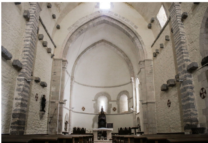
6. Irudia Aiarako Andre Maria basiliza

Elizak, hegoaldeko horman elizpe erromanikoa mantendu du. Araban kontserbatzen diren gutxienetariko kasu bat daukagu. Eraikuntzaren altuera eta zabaltasuna oso aipagarria da, garaiko eraikuntzetan, ezagutzen dugun testuinguruan ezohikoa dena. 23x 12,5 metroko dimentsioak ditu, hori bai, presbiterio aldean, altuera bi metro jaisten da 39 . Beraz, dimentsio handiko eliza da, inguruko testuinguan berezia dena (ikus 6. irudia).