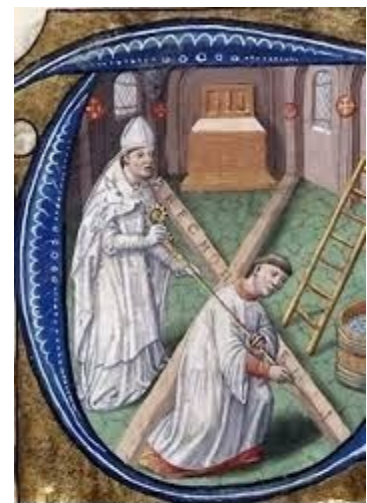
2. Irudia Jacques de Besançon maisua, Alfabeto bikoitzaren idazkera , Melungo misala, 234 orr., Paris.

Elizara sartzen zirenean, apezpikuak kristoren monograma lurrean idatziko du, Abecedariuma 24 bezala ezagutzen den momentua izango zen. Horretarako, area eta errautsaren arteko nahasketa bat botako du zorura. Bertan, X forma bat sortuko du. Gero makuluarekin, Xren ikoroski batean alfabeto grekoa idatziko du. Beste ikoroskian berdina egingo du, baina kasu honetan latindar alfabetoarekin. Sinbolikoki prozesu hau mezu argi bat zeukan. Eliza osoa Kristoren izaeraren inguruan, monograma