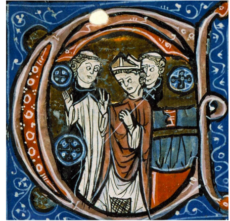
5. Irudia Apezpikuak paretan kokatu behar den sagarapen gurutzea bedeinkatzen du. Decretum , 1284, Angerseko Udal Liburutegia

Badakigu, erritu honek suposatzen zuen jazoera zela medio, igandeetan ospatu egiten zela. Hau Zaragozako kontzilioan (691) aipatu egiten da “ Apaizen ordenazioetarako igandea hautatzen bada, arrazoi gehiagorekin hautatu egingo da egun hau Jainkoaren omenezko tenpluko sagarapen baterako ” 30 .