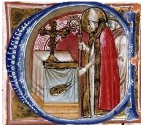
4. Irudia Aldarearen intsentsazioa, Brebiario ms.431 orr., Madril

Jada lehenago egin ziren gurutzeen leku berdinean, apezpikuak katekumenoen olioarekin gantzudurak egingo ditu. Orain aldarea berriz ere intsentsatuko du, hala ere, orain aldarearen inguruan egingo du, ez gainean (ikus 4. irudia). Azken prozesu hau bigarren aldi batean errepikatuko da. Eta gero, apezpikuak aldarean olio isuriko du. Krismarekin bost gurutze eginez, lehen bezala, aldare guztia oliatuko du. Egindako bost gurutzeak sinbolikoki kristoren gurutzeak errepresentatuko dituzte. Ideia hau azpimarratu egingo da apezpikuak intsentsua jarri eta su ematen dionean.