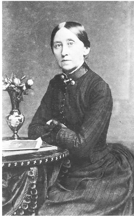
1.Irudia: Johanna Mestofen erretratua.

irakasle bilakatzera iritsi, hau da, Europako unibertsitateko lehen irakasle emakumea, arkeologiaren historiaren lan garrantzitsuetan ez da inoiz aipatzen.