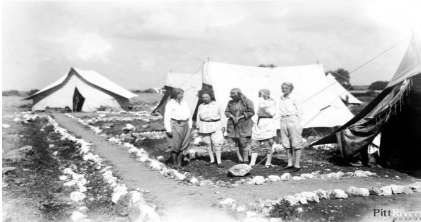
6.Irudia: Dorothy Garrod eta beste emakumeak Carmelo mendiko haitzuloetan 1929ko indusketetan.