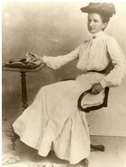
5.Irudia: Harriet Boyd Hawesen erretratua.

Garai hartan, emakumeengan eragin handia izan zuen ere hainbat gizonen jarrerak, izan ere, batzuk emakumeak indusketa lanetan parte hartzearen aurka egon ziren. 1904ean Danimarkako Museo Nazionaleko Bigarren Departamenduko zuzendariak honakoa adierazi zuen: “The work with the monuments of our fatherland is according to its nature men's work, it demands the exercise of physical strength and stamina which cannot be expected to be found amongst women” emakumeak lan hauek egiteko gaitasunik ez zutelara argi utziz (Díaz Andreu M., Sørensen M., 1998, 8). Irakasle batzuk ere, emakumeak indusketa-lanetan parte hartzearen kontra azaldu ziren, eta honen adibide argia dugu Harriet Boyd Hawes (1871-1945) estatubatuarraren kasua. Hawes arkeologiako ikasle bat baino ez zenean, Atenaseko American School-eko zuzendaria Hawesek indusketa-lan batzuk burutzearen aurka azaldu zen. Hala ere, Harrietek ez zuen amore eman eta Kretara bidaiatu zuen, non, geroago azalduko dugun bezala, sekulako aurkikuntza lana egin zuen.