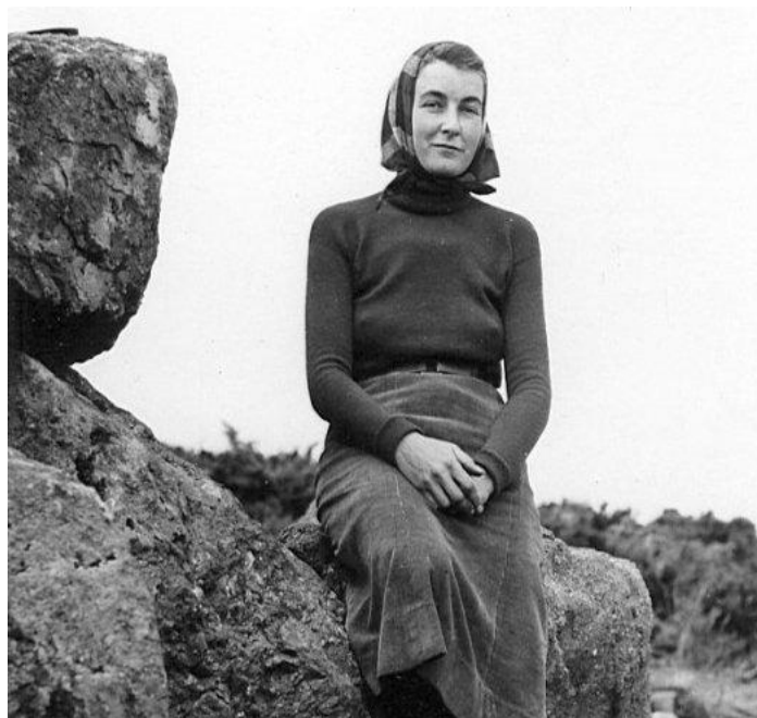
8.Irudia: Jacquetta Hawkes, seguraski 1939ko indusketa lan batzuetan Irlandan. Iturria:

Labur esanda, Jacquetta Hawkes Ingalaterra, Irlanda eta Palestinan indusketa lanak burutu ondoren, lehen emakume arkeologo ezagunetarikoa bilakatu zen. Hawkesek, gizarte minoikoan emakumeak agintzen zutela iradoki zuenean, bide guztiak erabili zituen, liburuak, artikulatuak, elkarrizketak telebistan, irratia eta abar teoriaren berri emateko eta arkeologiaren ezagutza gizarteratzeko.