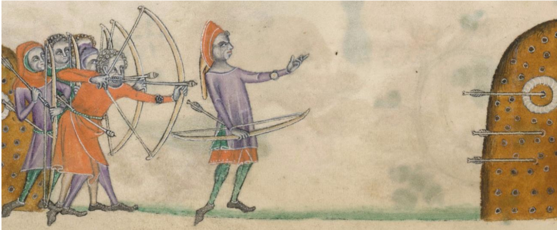
Imagen 2. Salterio de Luttrell (Lincolnshire, circa 1320-1340)

Pasando ya al ámbito militar, conviene recordar que fue con Edward I con quien el sistema táctico inglés comenzó a transformarse al implementar arqueros a gran escala 70 . Durante la Guerra de los Cien Años, y como pervivencia en la Guerra de las Dos Rosas, al inicio de la batalla se situaban los arqueros en la vanguardia, disparando para intentar mermar las fuerzas rivales desde el comienzo 71 . El disparo en salvas, cuya existencia muestran las pinturas, buscaba tanto causar daños, como hemos analizado previamente, como aterrorizar a los rivales 72 , causar confusión y desfigurar la formación atacante, lo que se lograría gracias a una cadencia de hasta 12 salvas por minuto 73 , cifra puesta en duda por muchos, por lo que me remito a la cadencia de fuego comentada previamente 74 . Además, la cadencia de fuego parece ser mayor conforme más cerca se encontraba el enemigo, dejando el grueso de la munición para distancias inferiores a 90 y sobre todo 30