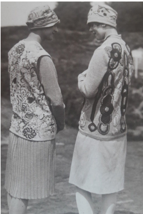
13.Irudia: Erresuma Batuko golf-jokalariak, 1927. 125