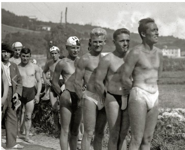
9. Irudia: Urumea ibaiko gizon bainulariak, 1929. 121