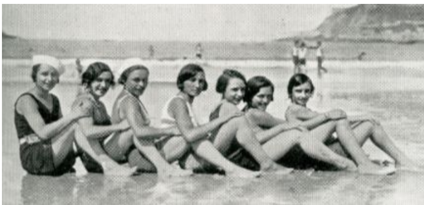
14.Irudia: Emakumeak Kontxako Hondartzan (1930). 126