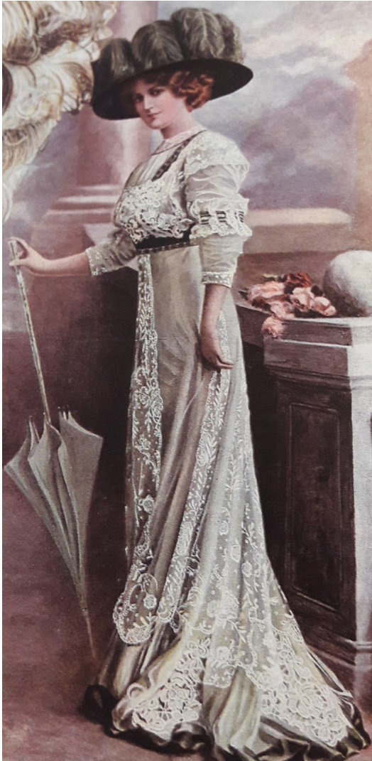
1.Irudia: Belle Époque -1900eko hamarkada-. 114