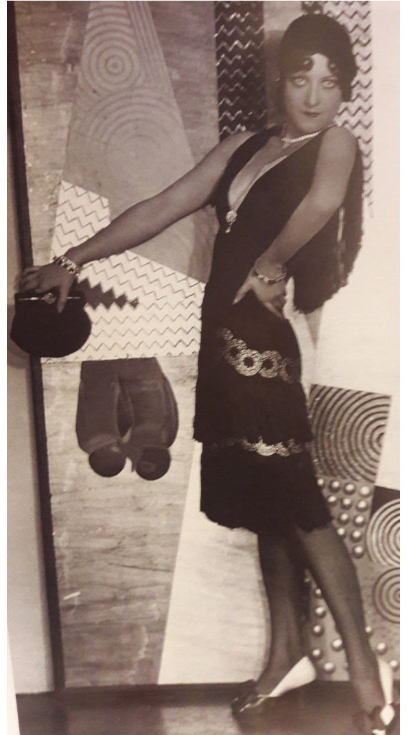
2.Irudia: Garçonne -1920ko hamarkada-. 115