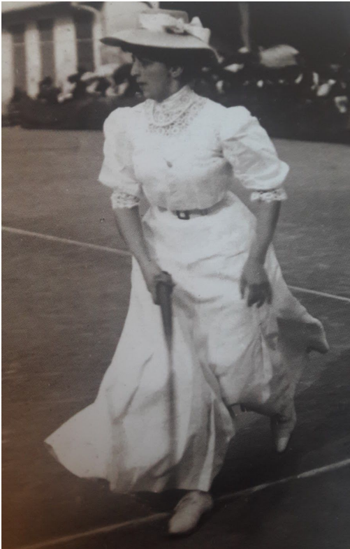
11.Irudia: Tenislari frantsesa, 1906. 123