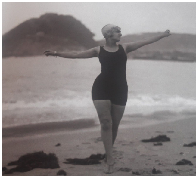
10. Irudia: Ondarretako emakume bainularia, 1926 (Donostia). 122