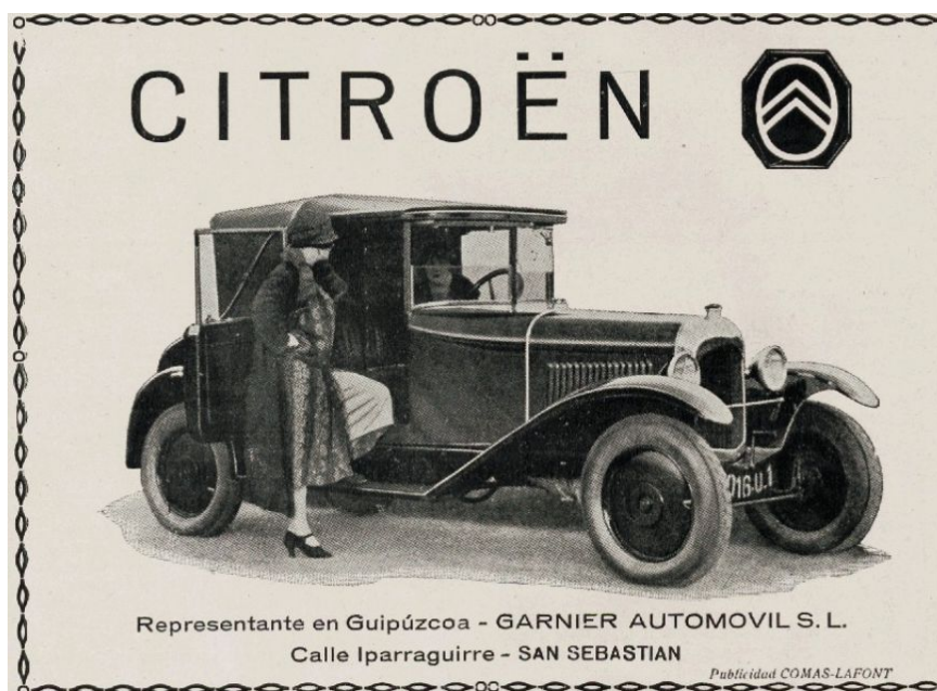
18.Irudia: Citroën iragarkian emakumea protagonista. 130