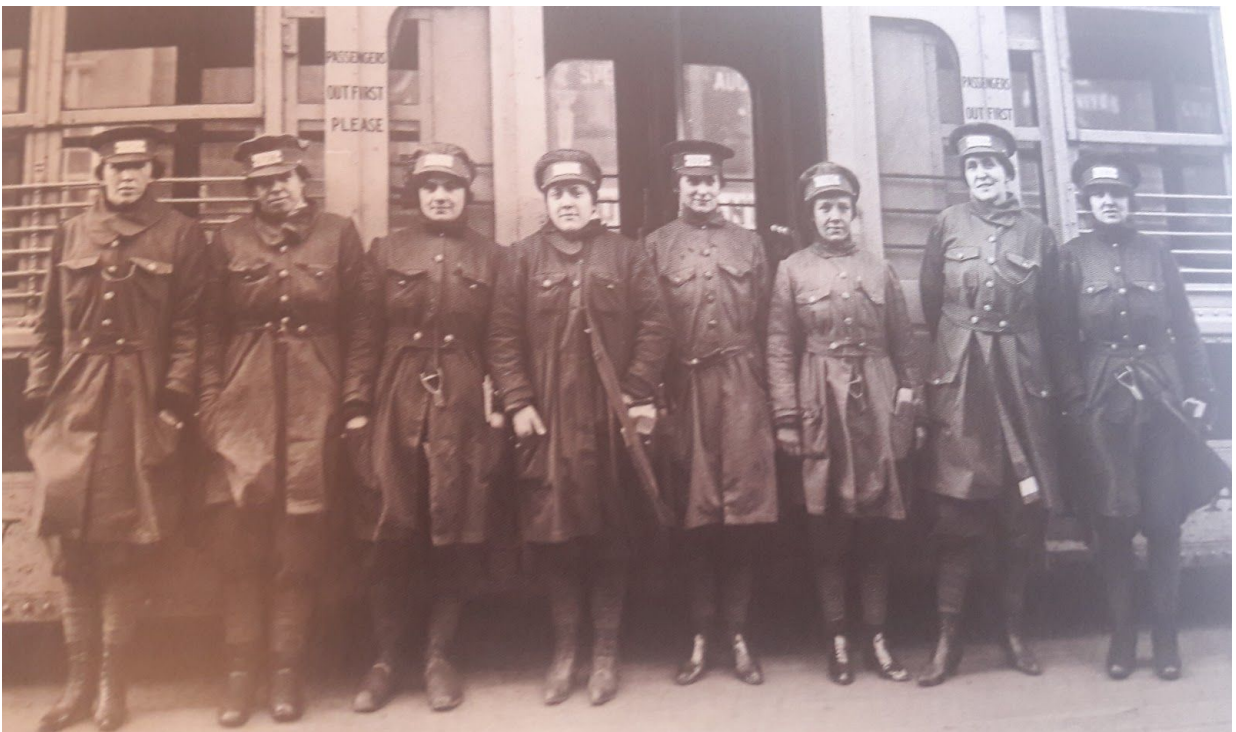
6.Irudia: New Yorkeko tranbia gidariak. 118