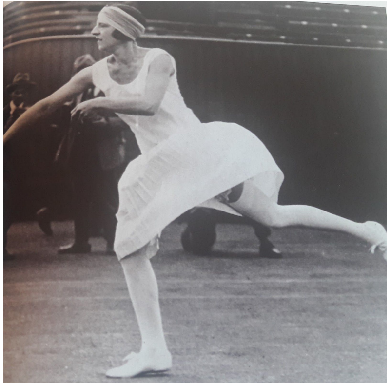
12.Irudia: Suzanne Lenglen tenislaria, 1925. 124