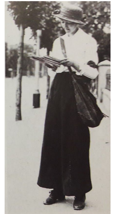
5.Irudia: Lehen Mundu Gerra garaiko postari ingeles bat. 117