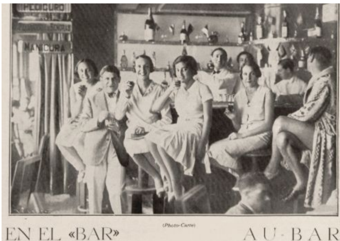
15.Irudia: Emakumeak tabernan (1930). 127