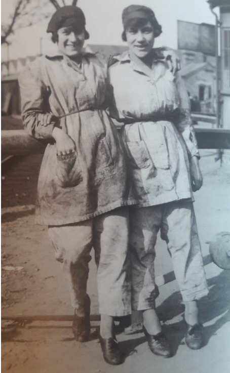
4.Irudia: Erresuma Batuko munizio fabrika bateko bi langile. 116