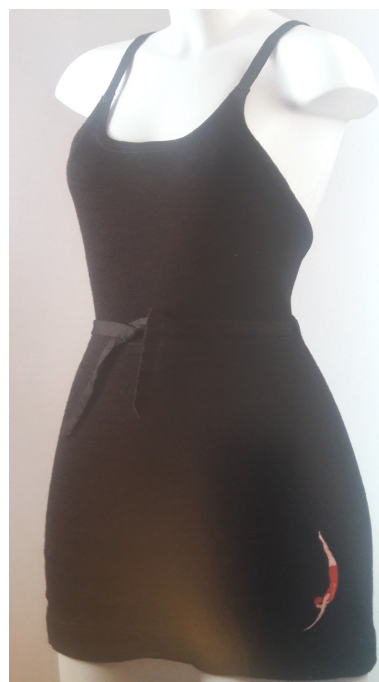
8. Irudia: 1930, Jantzen logodun maillota. 120