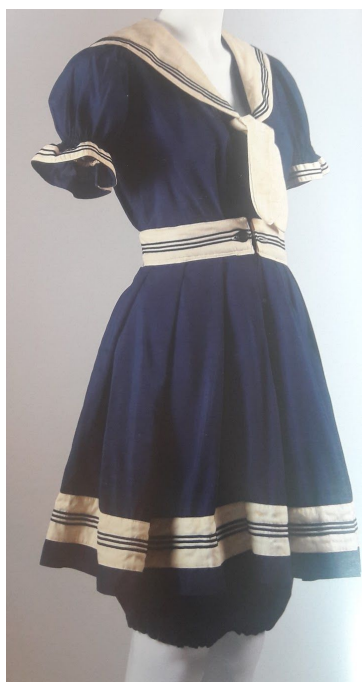
7. Irudia: Bainujantzia, 1895-96. 119