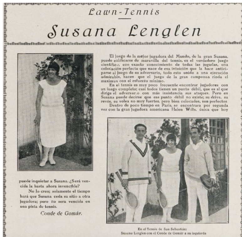
16.Irudia: Suzanne Lenglen tenis jokalaria 128