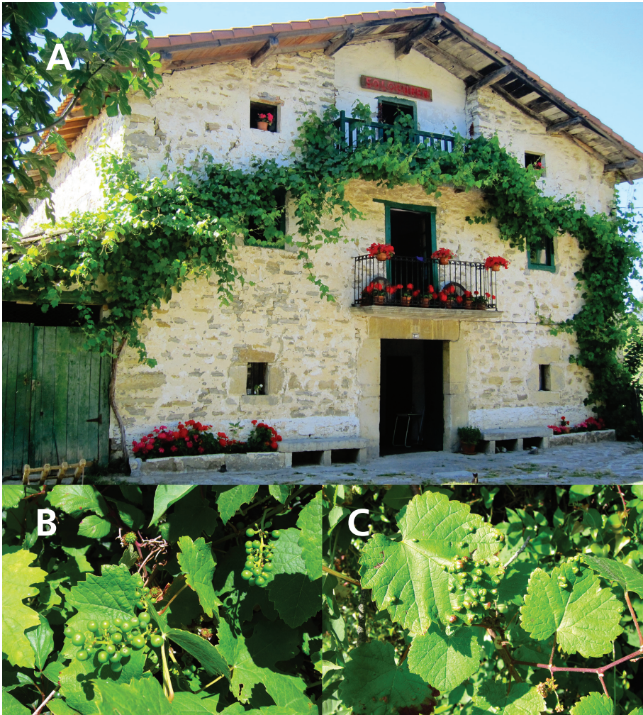
Fig 2.- A) Caserío Sologuren en Quejana, con parra en su fachada principal. (B) Ejemplar femenino con bayas en tamaño guisante, Amurrio. (C) Parra con síntomas de erinosis, Santa Coloma (Artziniega).

Referente al estado sanitario de las raíces, cabe destacar la ausencia de síntomas atribuibles a la fase radicícola de la filoxera ( Daktulosphaira vitifoliae Fitch), alimentándose de los pelos absorbentes, así como de nódulos provocados por nematodos.