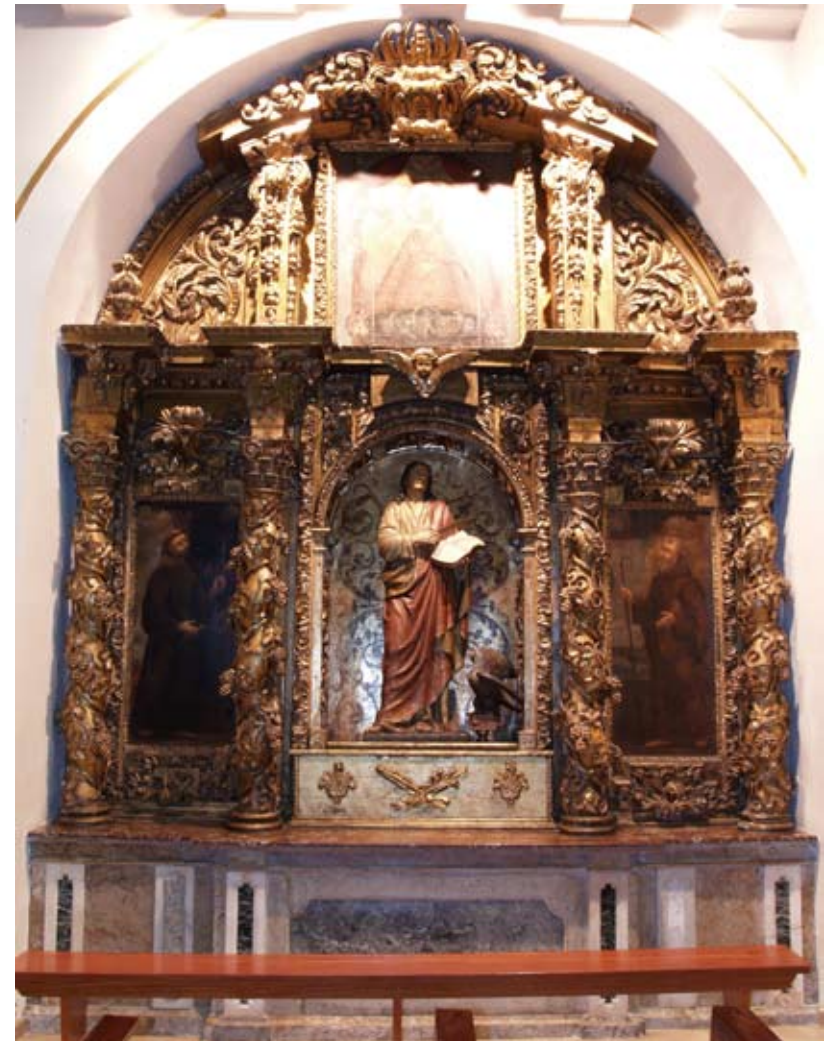
Fig. 9) Bilbao. Iglesia colegial de San Andrés. Retablo de San Francisco Javier.