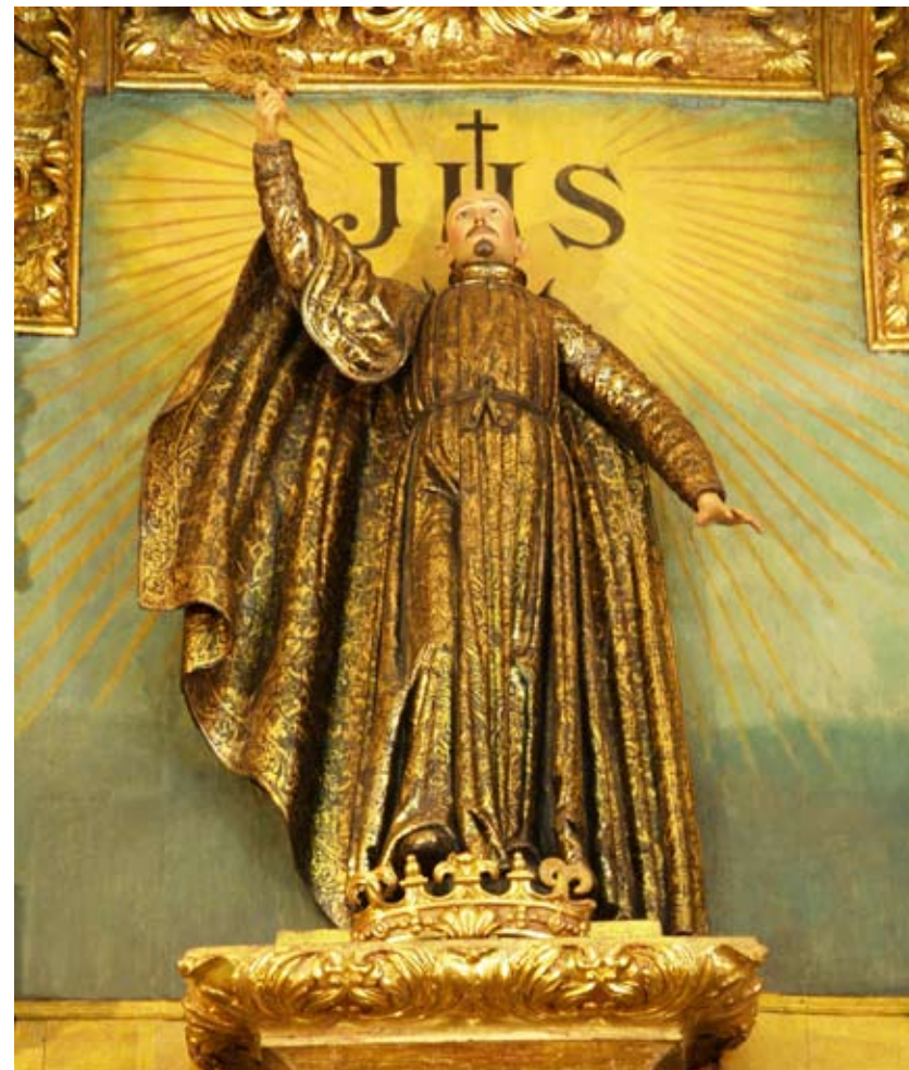
Fig. 5) Bilbao. Iglesia colegial de San Andrés. Retablo mayor. Talla de San Francisco de Borja como apóstol del Nombre de Jesús.