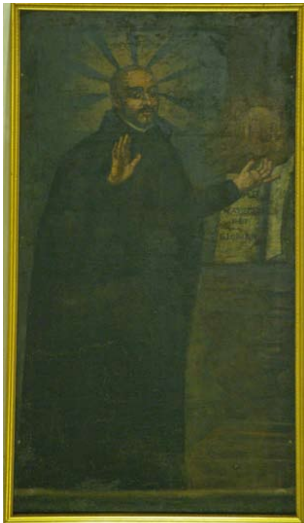
Fig. 6) Bilbao. Iglesia colegial de San Andrés. Pechina. Lienzo de San Ignacio fundador de la Compañía de Jesús.