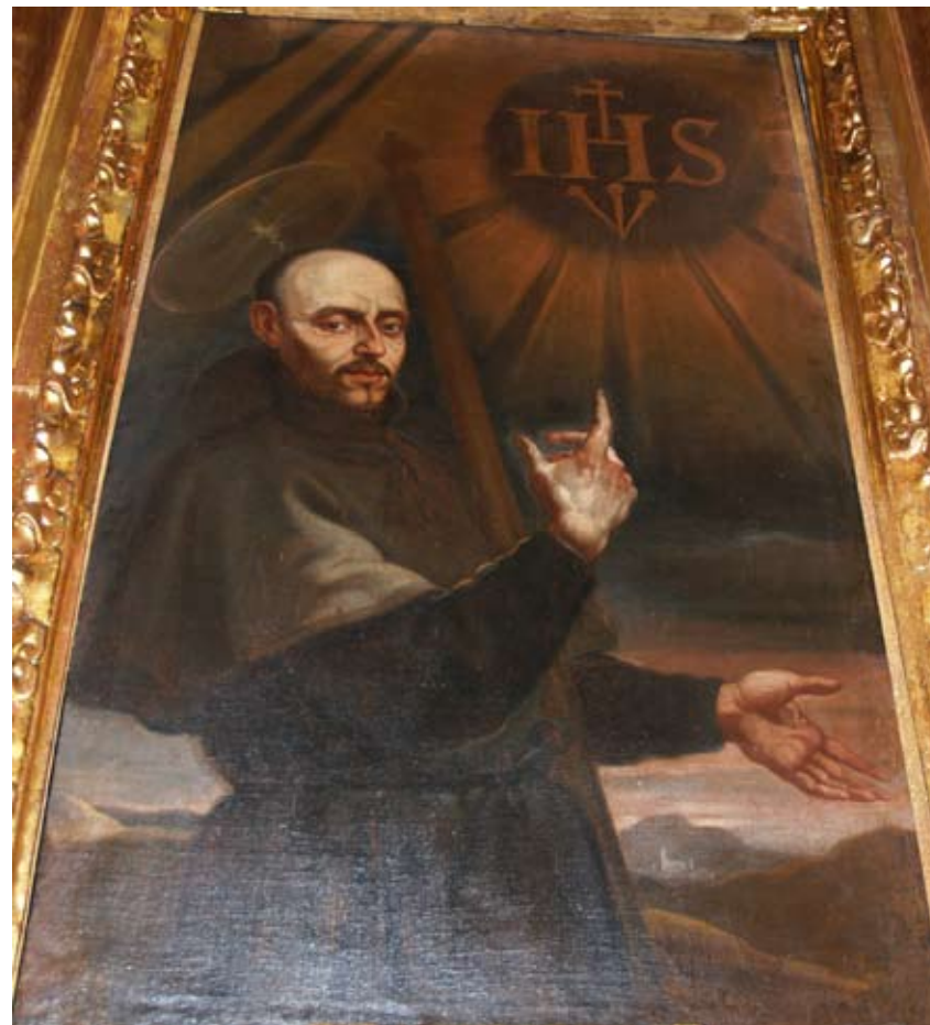
Fig. 3) Bilbao. Iglesia colegial de San Andrés. Retablo mayor. Lienzo de San Ignacio peregrino defensor del Nombre de Jesús.