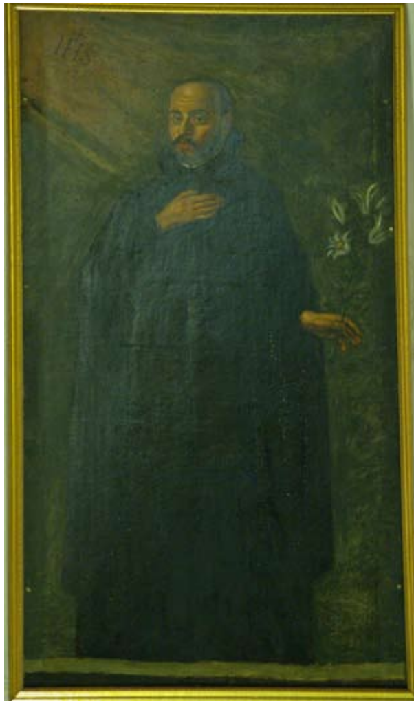
Fig. 8) Bilbao. Iglesia colegial de San Andrés. Pechina. Lienzo de San Francisco Javier expresando su amor por Cristo.