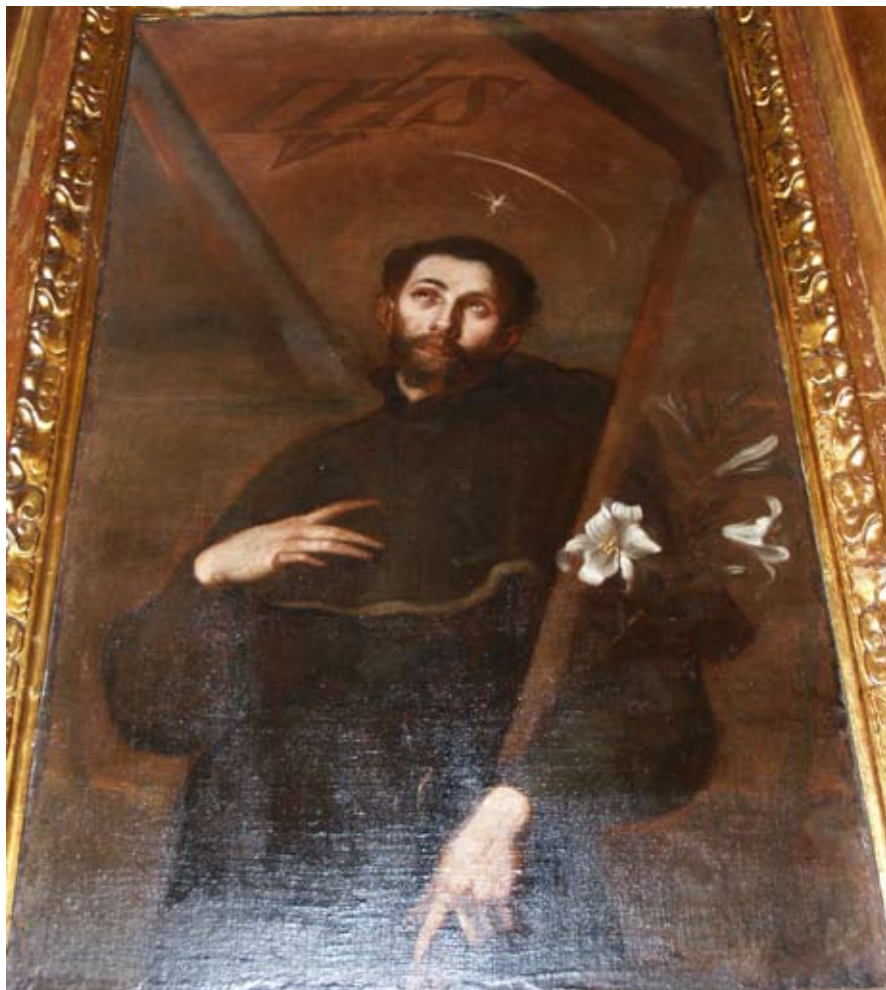
Fig. 4) Bilbao. Iglesia colegial de San Andrés. Retablo mayor. Lienzo de San Francisco Javier peregrino.