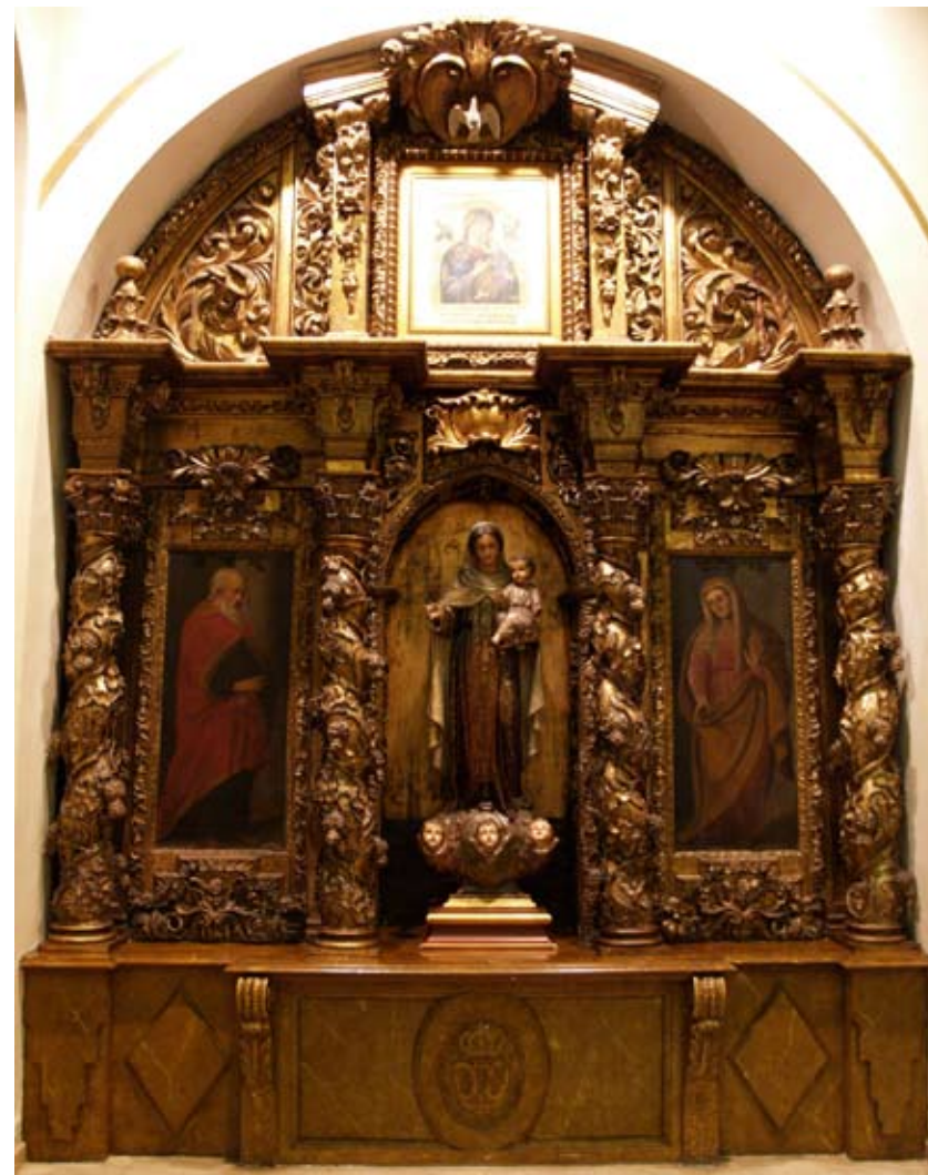
Fig. 7) Bilbao. Iglesia colegial de San Andrés. Retablo de San Ignacio de Loyola.