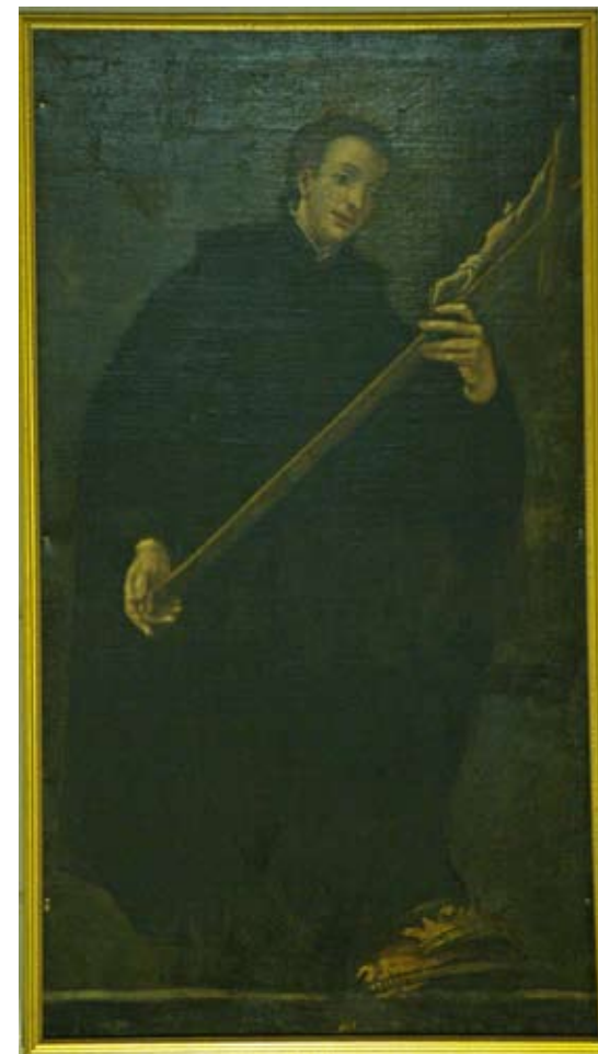
Fig. 13) Bilbao. Iglesia colegial de San Andrés. Pechina. Lienzo de San Luis Gonzaga adorando el crucifijo.