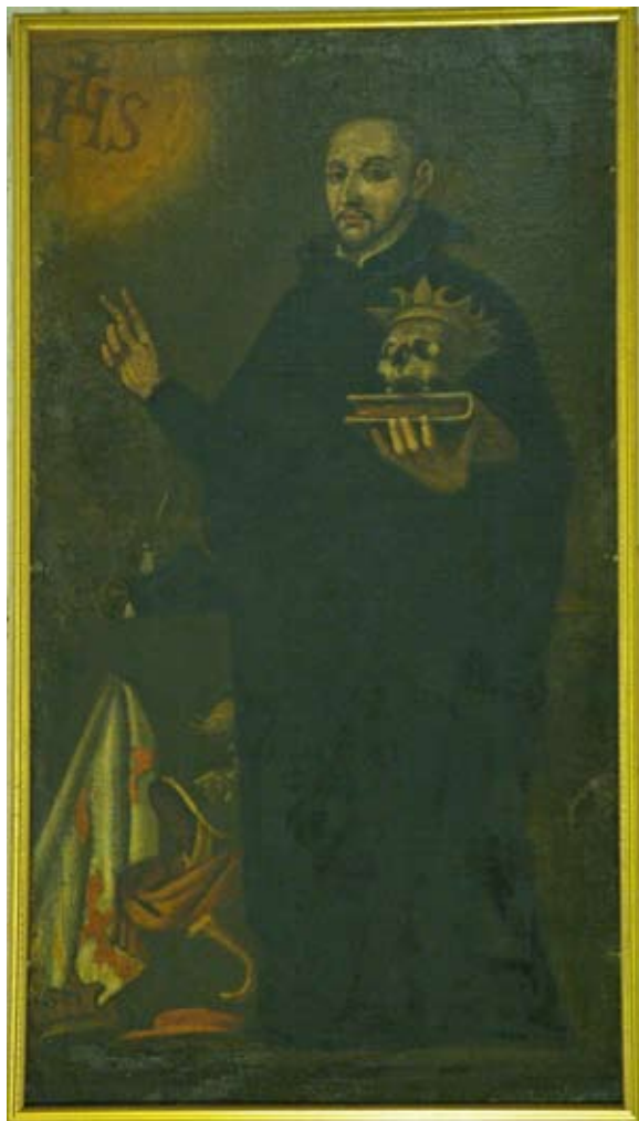
Fig. 10) Bilbao. Iglesia colegial de San Andrés. Pechina. Lienzo de San Francisco de Borja renunciando a las glorias del mundo.