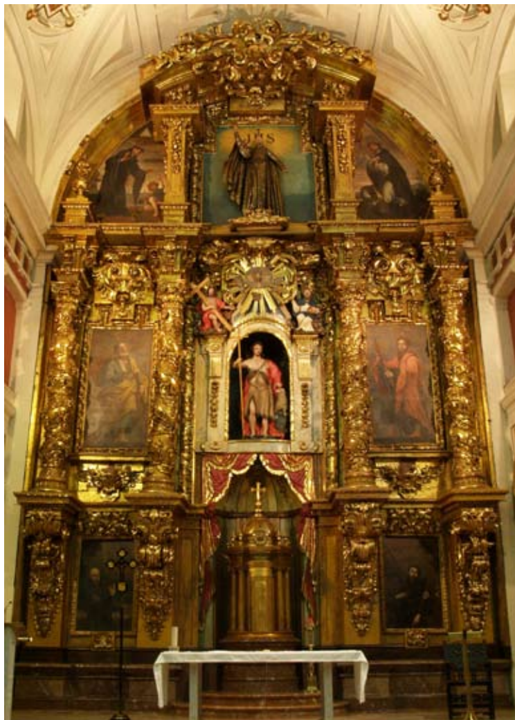
Fig. 2) Bilbao. Iglesia colegial de San Andrés. Retablo mayor.