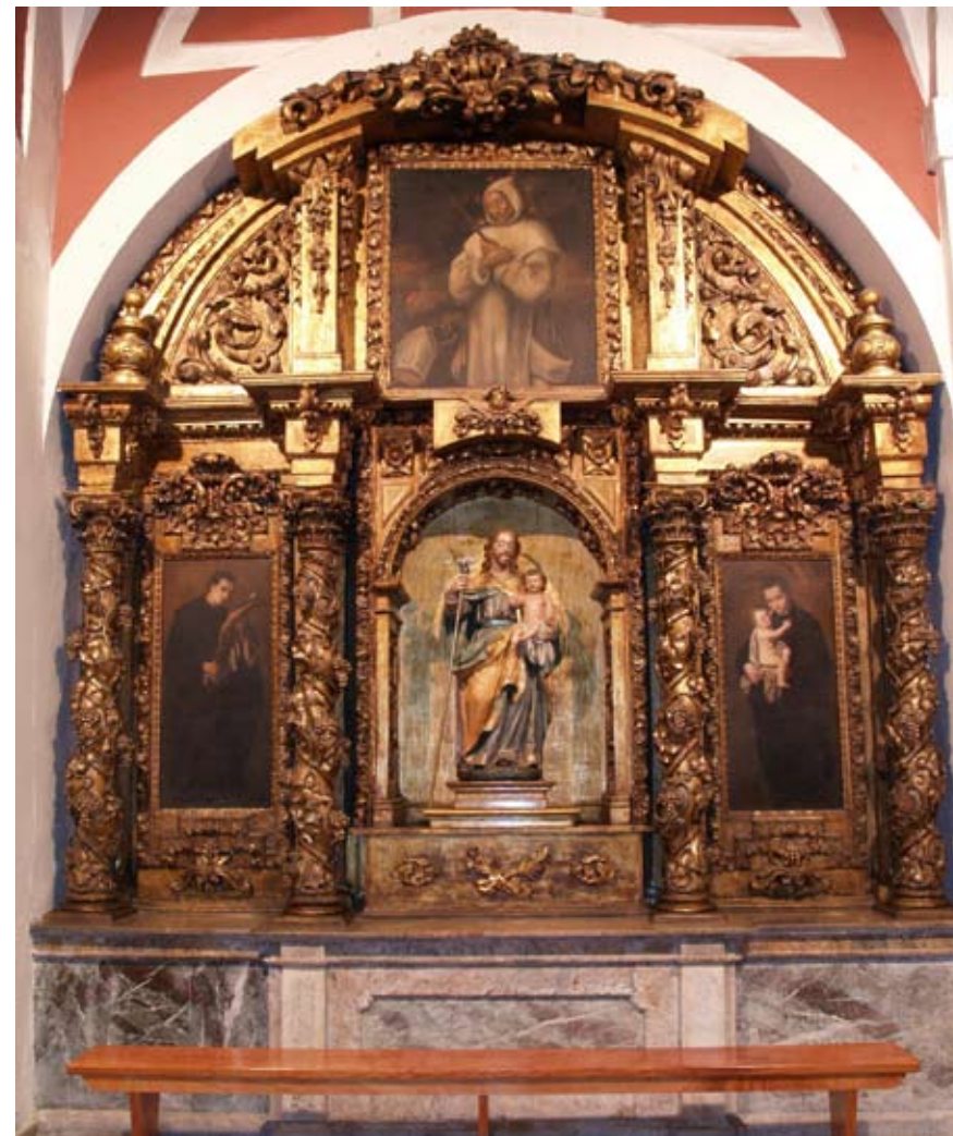
Fig. 11) Bilbao. Iglesia colegial de San Andrés. Retablo de San Francisco de Borja.