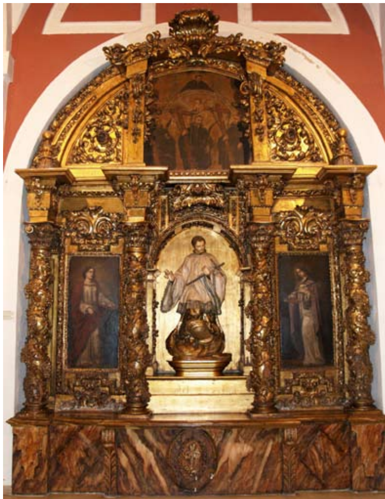
Fig. 12) Bilbao. Iglesia colegial de San Andrés. Retablo de San Luis Gonzaga.