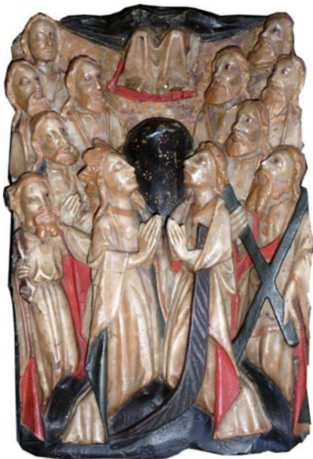
Fig. 9) Ascensión. Madres Agustinas de Errenteria

La pieza, policromada, mide 43 x 28 cm. El fondo que se encuentra a los lados de los pies de Cristo estuvo dorado, representando el cielo áureo, decorado con pequeñas bolitas de estuco también doradas. Hoy ese fondo está cubierto por una capa de ocre claro que corresponde al mixtión, base del oro. La misma capa la podemos ver en los cabellos y barbas de los apóstoles, la corona de la Virgen y en las cenefas de los vestidos, donde podemos apreciar restos de dorado. El rojo de las partes internas de las túnicas no parecen ser de época, ya que hay algunas zonas donde el alabastro se ha desprendido, su espacio está cubierto por el rojo, lo cual nos lleva a pensar en un repinte, pero con dudas, a falta de un análisis químico. Toda la parte inferior está cubierta por una gruesa capa de barniz oscuro que cubre las flores y algunos colores verdosos. La placa posee pequeñas roturas hoy encoladas.