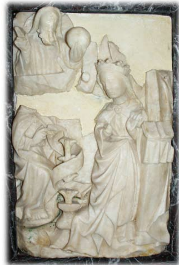
Fig. 5) La Anunciación. Usurbil

Relieve de alabastro de 41 x 26,5 cm. con restos de policromía escenifica una Anunciación (Fig.5) y pertenece a la ermita de la Virgen del Socorro, antiguo hospital de peregrinos del Camino de Santiago en la localidad de Usurbil (Gipuzkoa). Los fragmentos de la placa fueron hallados en unas excavaciones bajo el altar de la ermita. La escena, que se encuentra incompleta, representa a la Virgen arrodillada con gesto de sumisión y con las manos abiertas, abandonando su lectura y girándose levemente en una postura algo forzada. Sobre un atril posa su libro y falta lo que sería el baldaquino con la cortina. El Padre Eterno, sin corona, bendice con su mano derecha y con la izquierda sostiene la bola del mundo. De su boca debería salir un soplo que se transforma en una paloma, el Espíritu Santo, elemento que ha desaparecido. Un ángel se acerca a la Virgen para comunicarle la buena nueva, momento que se reflejaría en una filacteria con la leyenda "Ave María gratia plena", hoy borrada. La policromía ha desaparecido casi totalmente, aunque existen unos pequeños restos de verde en la zona cercana al jarrón con el lirio, símbolo de la pureza de María.