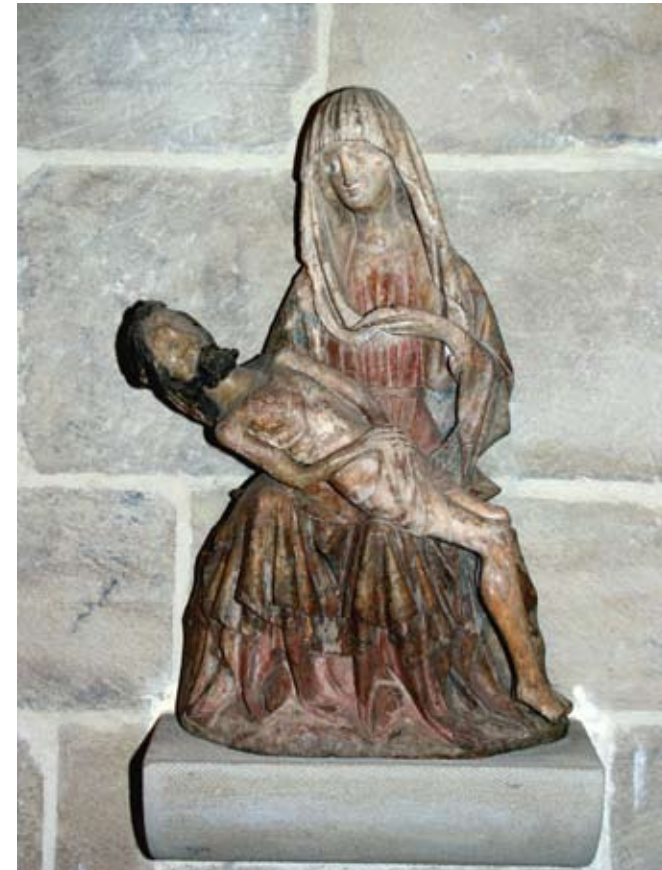
Fig. 4) Piedad. Parroquia de San Esteban de Oiartzun

La Piedad policromada (Fig. 4) de la localidad de Oiartzun representa a la Virgen Dolorosa que posa a su hijo muerto sobre sus piernas, eleva su torso con su mano derecha y con la otra sostiene el velo que cubre su cabeza, formando una especie de círculo o mándorla alrededor de su rostro. La imagen, que se encontraba en el tímpano de la entrada principal gótica del templo, fue trasladada al interior de la iglesia al efectuarse las obras de restauración de la misma en 2001. Su representación no es ajena a otras realizadas en esta misma época. Similares composiciones las encontramos