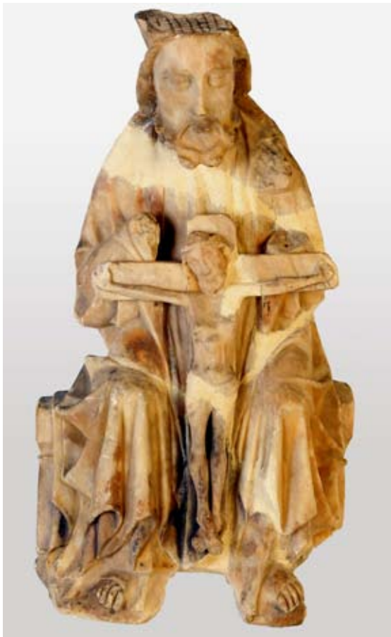
Fig. 1) La Santísima. Trinidad. Museo San Telmo, Donostia

caracterizada por la falta de la paloma, Espíritu Santo, y la ausencia de otros personajes. Es de destacar la talla de los ojos de forma almendrada donde se dibujan suavemente los párpados, característica de los primeros momentos, al igual que los dos bucles de la barba. Así mismo destaca la posición de la cabeza del Cristo, no a la altura del travesaño de la cruz o algo más baja, sino en posición más alzada. Hemos encontrado otra escultura muy similar a ésta en la parroquia de Lekeitio en Bizkaia (94 x 40 x 10 cm) y en el Victoria & Albert Museum de Londres. También poseemos representaciones de la Trinidad en el Museo Nacional de Antigüedades de la Universidad de Oslo (80 x 20 cm) y en el Museo Marès de Barcelona (56,5 x 25 x 5 cm), aunque parte de esta Trinidad de Barcelona ha sido reconstruida 5 . La pieza de San Telmo conserva restos de policromía en la frente y cuello en las que se puede apreciar una preparación negra y capas de carnación, y en la parte interna de los plegados del manto un color rojo. Pero no es el único alabastro que podemos encontrar en el Museo San Telmo.