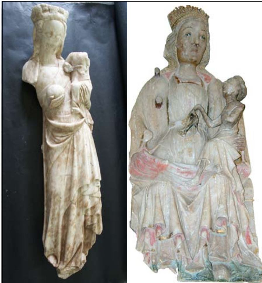
Fig.10) Virgen con Niño. Irun e Irura

relacionada con la exportación de lana, hierro y manufacturados como espadas o puñales y la importación de tejidos y otros productos elaborados ingleses como los alabastros y otras piezas de arte. Las obras guipuzcoanas coinciden en sus medidas con las medidas de los alabastros ingleses de otros países. Observando la analítica, ésta también coincide en el uso de los mismos pigmentos y mezclas, y sólo podemos destacar que el mixtión empleado en las obras renacentistas españolas, algo más tardías, presenta características diferentes a las obras inglesas, como su color más pardo frente al naranja inglés y su diferente grosor. También hemos podido constatar el uso del azul índigo y la azurita en algunas piezas de Gipuzkoa, dato que no hemos podido comprobar en las restantes piezas debido a los escasos datos 39 .