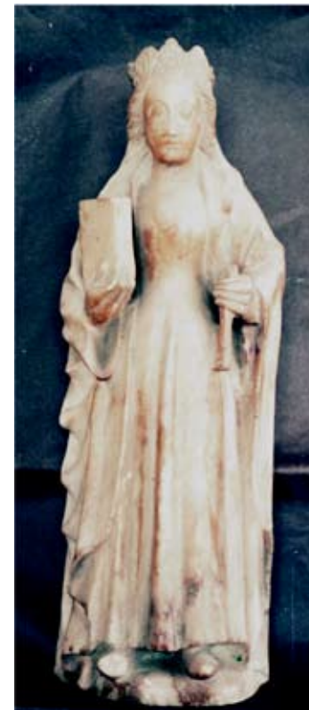
Fig. 6) Santa Apolonia. Ezkio

Esta escultura de la santa mártir con restos de policromía actualmente se custodia en el Museo Diocesano de San Sebastián y posee unas dimensiones de 39 x 13 x 5,5 cm (Fig. 6). La santa está representada erguida y en actitud hierática con un libro en una mano y posiblemente la palmera del martirio o la pinza en la otra. Posee un vestido de cuello redondo con cintura de avispa muy ajustada y unos pocos pliegues de tipo tubular. El manto cae muy limpio, excepto la zona de la mano izquierda, donde se pliega formando pequeñas ondas de gran elegancia. Este tipo de vestimenta, ajustado al pecho, marcando pechos y cintura, y holgado a partir de la cintura se impuso en el último cuarto del siglo XIV hasta casi mediados del siglo XV según Carmen Bernis 26 , lo que nos ayudaría a confirmar la datación de esta pieza y situarla a principios del siglo XV.