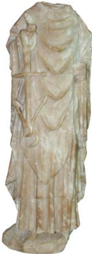
Fig. 2) San Judas. Museo San Telmo. Donostia

nos es difícil definir. Cheetham lo calificó como San Judas, sin cabeza y Angela Franco sostiene que el ancla y el báculo, parcialmente conservado, del triple travesaño, lo define como San Clemente 7 . Una representación similar completa la encontramos en la colección Bonhams en Londres, donde Cheetham lo identifica como San Judas, con los símbolos del ancla y remo, y el Victoria & Albert Museum posee un panel con la figura de San Judas sentado con los atributos del ancla, barca y remo 8 . Personalmente me decanto por la acepción de San Judas, debido a su mayor presencia en los alabastros ingleses. Esta asignación de la imagen como San Judas con los dos símbolos, puede deber su origen a un milagro atribuido a él por la Leyenda Dorada que dice: “A tres docenas de muertos ahogados entre olas devolvió la vida humana” 9 .