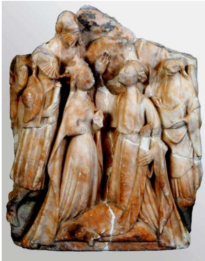
Fig. 3) La Ascensión. Museo San Telmo. San Sebastián