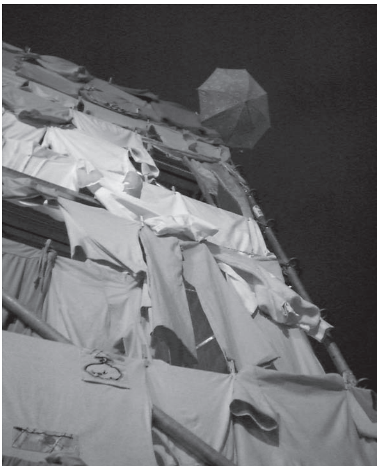
FIG. 7 Instalación en andamio, Madrid, 2007. Basurama.