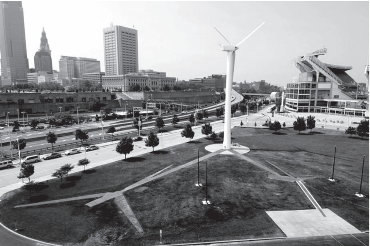
FIG. 4 «Shadow and Light», 2007. Allan y Ellen Wexler.

senderos toman la forma de las sombras que se originan con la turbina y sus cuchillas en los días de los equinoccios, que se producen el 21 de septiembre y el 21 de marzo. Complementando las sombras, se encuentra una estructura escultórica, que está hecha de cartones que contienen 4.400 bombillas incandescentes de tipo estándar, haciendo referencia al gasto medio de electricidad existente en un hogar americano durante un año.