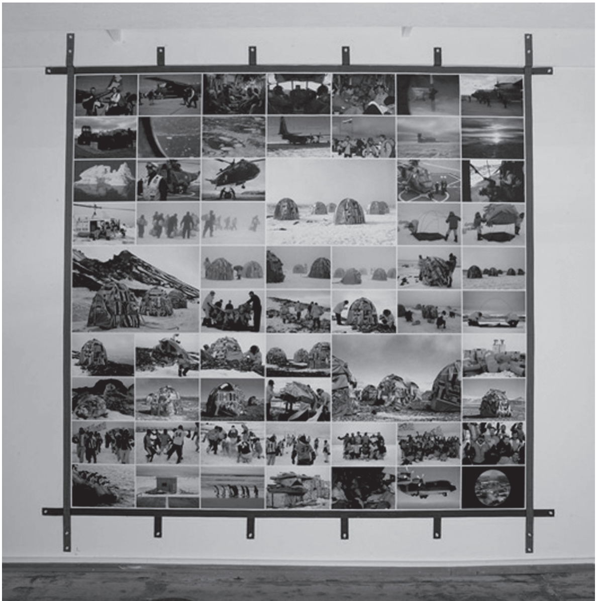
FIG. 1 «Antarctic Village: No borders, Expedition Tarpaulin», 2007. Lucy + Jorge Orta.

Con el objetivo de delimitar algunas de las principales prácticas artísticas relacionadas con el arte sostenible, hemos planteado la conveniencia de remarcar tres campos principales de actuación: economía, ecología y