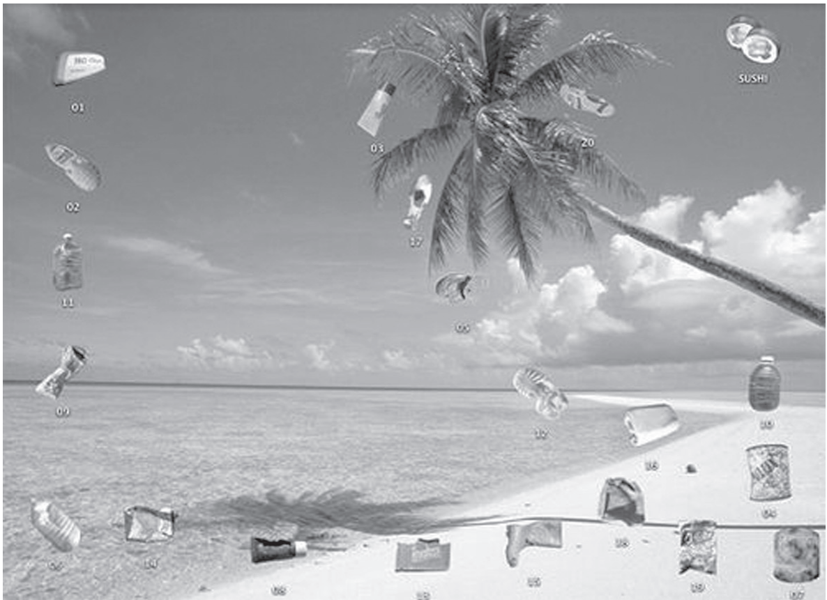
FIG. 6 «Iconsfactory», 2004. Transnational Temps.

desaparición de especies en el mundo natural y la consecuente relación de nombres taxonómicos vacíos.