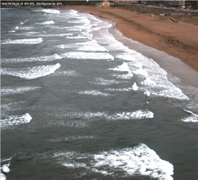
Instantánea de la Playa de Zarautz. 2018-04-29 a la 7:19 pm.