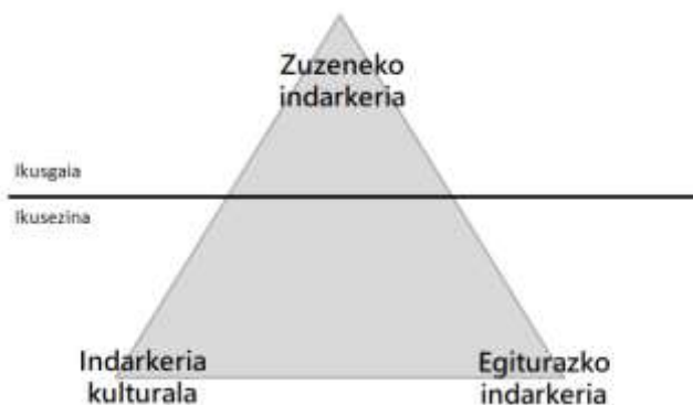
1. Irudia Ageriko indarkeria gatazkaren zati txiki gisa irudikatua.

Galtung-ek (1984) gatazka sozialetan indarkeria sortzeko dinamika irudikatzen sortutako kontzeptua indarkeriaren triangeluarekin erlazionatu da (ikus 1.irudia).