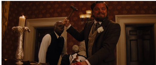
Figura 23: Candiek Broomhilda mehatxatzen du. Berreskuratua filmeko fotograma batetik