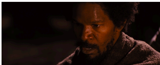
Figura 13: Django burumakur. Berreskuratua filmeko fotograma batetik