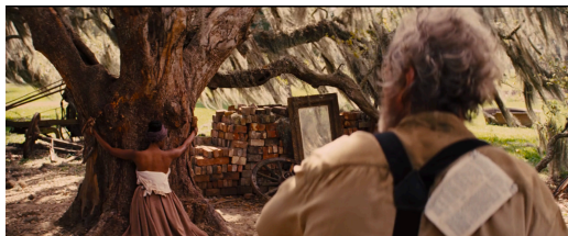
Figura 17: Arrautzak puskatzeagatik emakume bat zigortua izaten. Berreskuratua filmeko fotograma batetik

Figura 16: Djangok arropa aukeratzen du lehen aldiz. Berreskuratua filmeko fotograma batetik