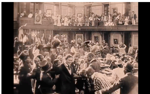
Figura 8: Kongresuak sekulako gatazka. Berreskuratua filmeko fotograma batetik