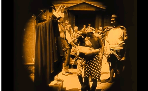
Figura 1: Esklaboak merkatariaren aurrean. Berreskuratua filmeko fotograma batetik