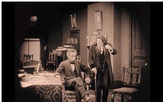
Figura 5: Lincolnek emantzipazioa sinatzen du. Berreskuratua filmeko fotograma batetik