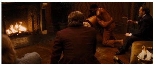
Figura 18: Mandingo borroka. Berreskuratua filmeko fotograma batetik

Figura 17: Arrautzak puskatzeagatik emakume bat zigortua izaten. Berreskuratua filmeko fotograma batetik