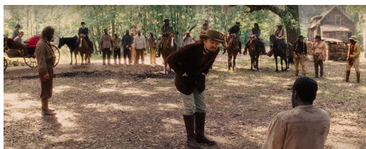
Figura 19: Esklaboa txakurrek erasotua izan aurretik. Berreskuratua filmeko fotograma batetik

Figura 18: Mandingo borroka. Berreskuratua filmeko fotograma batetik