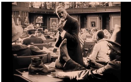
Figura 7: Beltz bat kongresuan mahai gainean hankak dituelarik zapatak kenduta eta bestea oilaskoa jaten. Berreskuratua filmeko fotograma batetik