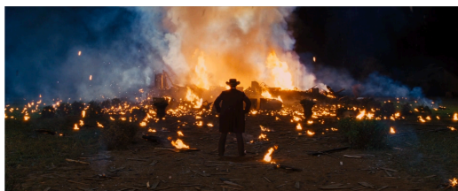
Figura 20: Djangok Candyland suntsitzen du. Berreskuratua filmeko fotograma batetik

Figura 19: Esklaboa txakurrek erasotua izan aurretik. Berreskuratua filmeko fotograma batetik