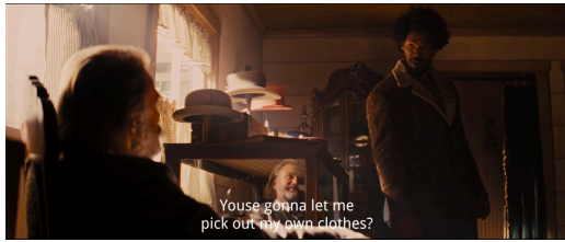
Figura 16: Djangok arropa aukeratzen du lehen aldiz. Berreskuratua filmeko fotograma batetik

Figura 15: Django urkan zintzilikatua sinbolikoki. Berreskuratua filmeko fotograma batetik