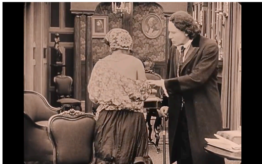
Figura 6: Neskamea arropa urratuta. Berreskuratua filmeko fotograma batetik