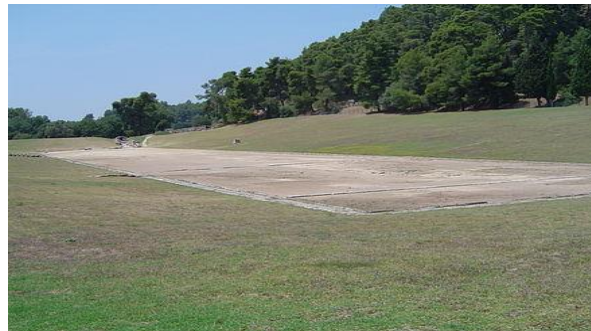
Estadio de Olimpia

decenas de altares, estatuas y ornamentos que engrandecían el complejo e impresionaban a los visitantes que frecuentemente acampaban en los terrenos colindantes mientras se celebraban los juegos. En Olimpia residía también el Consejo o Senado olímpico, que era el que organizaba y presidía los juegos. En definitiva, Olimpia era un lugar de encuentro del mundo griego; un lugar que unía a todos los griegos a pesar de sus diferencias y sus confrontaciones aludiendo a la idea unificadora de “panhelenismo” o “identidad griega” descrita por Heródoto (Barceló & Hernández de la Fuente, 2019, 170); de hecho, en el caso de que dos poleis estuvieran en guerra se forzaba una tregua con el fin (entre otros) de salvaguardar a todos los espectadores que acudieran a Olimpia. No podía haber conflictos militares entre los griegos durante esta festividad o Zeus lo castigaría con severidad. A pesar de que los juegos de Olimpia eran los más grandiosos e importantes, había muchos otros dedicados a otras deidades como los Juegos Píticos en Delfos en honor a Apolo, los Juegos Ístmicos o los Juegos Nemeos, por nombrar los más importantes.