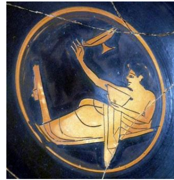
Copa de fig. ro., cótabos. 510 a.C. MNA Atenas.

Tras el banquete Arifrón se dirige hacia su hogar en unas condiciones deplorables, prácticamente a hombros de Estéfano. El joven atraviesa el umbral, se quita el cinturón y se desploma en el sencillo camastro del dormitorio que comparte con sus dos hermanos pequeños. No queda mucho para que amanezca y Arifrón tendrá que ayudar a su padre barnizando unas ánforas desde primera hora.