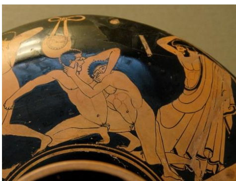
Copa ática hallada en Vulci (Italia). 500 a.C.