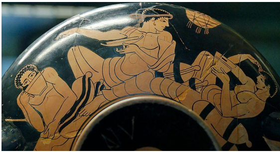
Copa de figuras rojas. 490-480 a.C. Louvre.

cometido era dar placer a los hombres de la sala. Todos estos aspectos de los symposia han sido representados en numerosas ocasiones en la cerámica griega. Como ejemplo, en estas dos imágenes podemos ver a jóvenes reclinados bebiendo en un simposio con sus característicos kylix (Domínguez & González, 2011, 195).