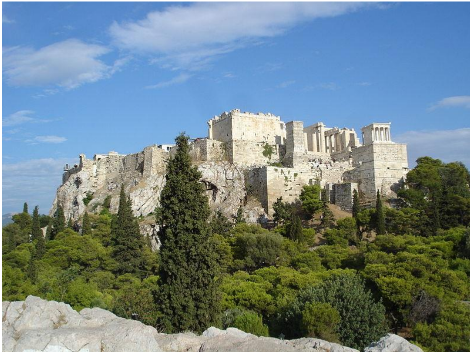
Vista de la Acrópolis desde el Areópago