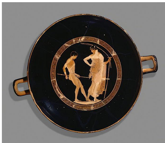
Joven atleta con su entrenador, copa de fig. rojas, ca. 480 a.C., Ashmolean Museum, Oxford

Arifrón ha realizado ya el servicio militar que todo ciudadano ateniense debe hacer en la efebía, y se dispone a formar parte de la guarnición ateniense que compondrá el grueso de las fuerzas aliadas frente a la Liga del Peloponeso cuando comience la conflagración entre las dos ligas.