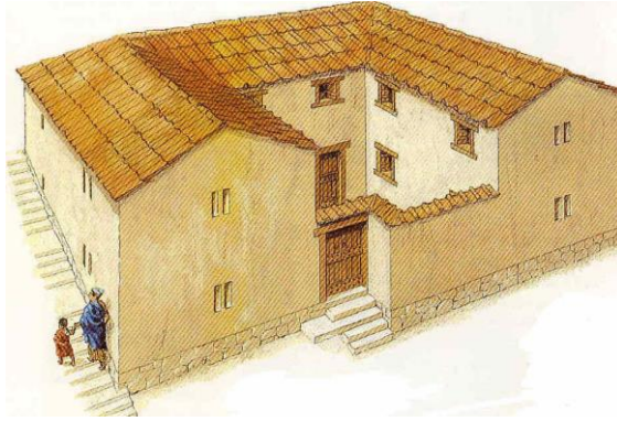
Reconstrucción de una vivienda ateniense