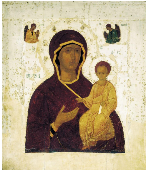
2.IRUDIA: Konstantinoplako Hodegetriaren erreplika (XIV. mendea). Egun Moskuko State Tretyakov Galerian aurki daiteke.

Ezkerreko eskuarekin haurra sostengatuz eta eskuinekoarekin berriz, haurra seinalatuz agertu ohi zaigu Maria. Eskuineko eskuaren keinu hori litzateke Hodegetriaren bereizgarri, horrek egiten du identifikagarri 24 (ikus 2. irudia). Izan ere, keinuaren esanahia ezin itxi daitekeen arren (bitartekaritza, miresmena zein haurraren arreta deitzeko asmoa bildu ditzakeen heinean) 25 , Hodegetria hitzaren etimologia esanguratsua da oso: “Bidea seinalatzen duena” esan nahi baitu. Hortik, imajina dezakegu Hodegetriak helarazten duen mezua: Jainkoa da bidea . 26 Haurtxoak bedeinkapen keinua eginez erantzuten dio Amari. Antza, prozesioaren inguruan biltzen ziren fededunek imintzio edo keinu horiek errepikatzen zituzten mimetikoki ( proskynesis arekin batera: gurutzea egitea eta ahuspeztea 27 ), modu horretara, Maria eta Jesusen arteko elkarriketa isila (margotua) otoitzaren espazio fisikora zabalduz. 28