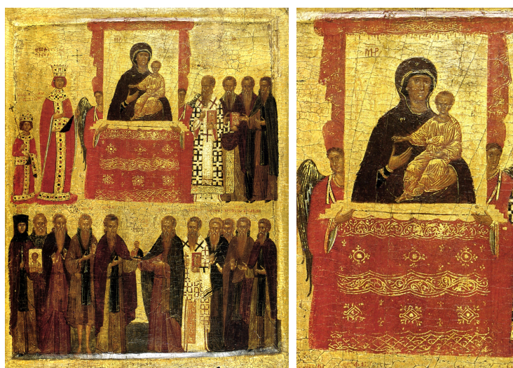
6. IRUDIA: “Ortodoxiaren Garaipena” ikonoa (XIV. mendea). Egun Londreseko British Museumen dago.

Ortodoxiaren jaia urtero ospatzen zen Garizumaren lehen igandean. Festa horrek oihartzuna izan zuen XI. mendeko miniatura baten harira (egun Atos Mendian gordeta dagoena) eta denboraren poderioz, XIV. mendean, ikono guztien ikonoa eta Theotokoupolis edo hiriaren babesle zen Hodegetriaren irudiaren presentzia ezinbesteko bihurtu zen, garaikidea den eta ikusi berri dugun ikonoak islatzen duen bezalaxe. 59