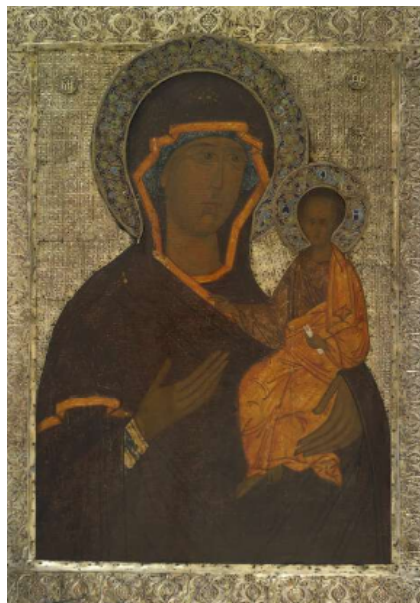
10. IRUDIA: XVI. mende erdialdeko Smolenskaya Jainkoaren Ama. Egun British Museumen aurki daiteke.

Hodegoneko Hodegetria Konstantinoplako palladiuma izan zen lekuko argiak lirateke halaber, punta-puntako pertsonaiek (enperadore-enperatrizek, nobleziako kideek...) Hodegon elizara gerturatu eta ikono mirarigileari eginiko eskaintzak (adibidez, gudetan irabazle irtendakoan, garaipena hari zor ziotelakoan, esker onez). 114