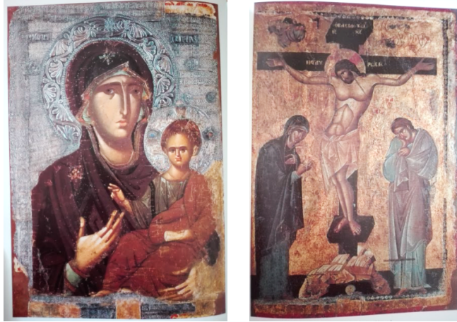
7. IRUDIA: San Klemente elizako (Ohrid, Mazedonia) Peribleptos irudi sakratua: Hodegetria ikonoaren kopia (XIII. mendea), atzealdean Kristo gurutziltzatua duena.