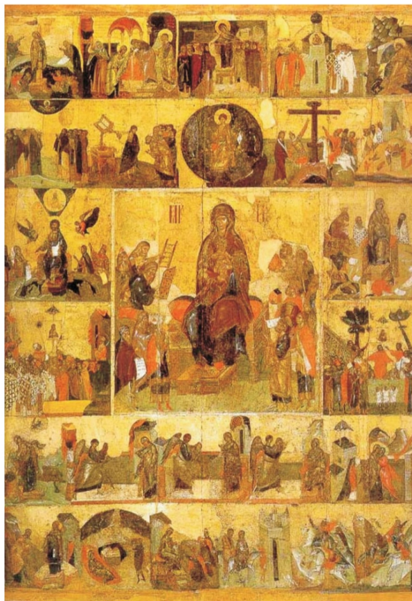
3. IRUDIA: Moskuko Kremlineko Dormitio Katedraleko

Eskuineko eszenan (ikus 5. irudia), prozesioaren unerik garrantzitsuena jasotzen dela uler daitekeen horretan, gorri koloreko janzkera duen gizon bat azaltzen da beso zabalik, orans eran (otoitz keinua eginez). Sorbalden gainean, zerurantz abiatu dela dirudien ikono mirarigilea darama . 49 Hain zuzen, itxura denez, gizonak bere eramaile lana (ezkerreko eszenan —4. irudia— ikus daitekeena) jada amaitu du, irudiaren azpian kokatuta dirauen arren, ikonoa airean gora doala dirudi. Zentzu horretan, pentsa liteke, argi eta garbi islatzen duela arestian esandako ideia: ikonoak espazio lurtarretik espazio zerutiarrera irekitzen ziren leiho modura definitzen dituen. 50 Kremlineko taula pintatua arretaz behatuz gero, ikonografikoki bitxia suerta daitekeen elementu baten azpian agertzen zaigu, gainera, Hodegoneko Birjinaren irudia: aterki baten pean (artean, ordea, ezezaguna horren zergatia edo esanahia). Eszena osatuz, eramailearen inguruan, elizgizon eta fededun andana ageri da eta guztiek ere orans eran jasotzen dituzte eskuak, Jainkoaren Amari babes eta erruki eske. 51