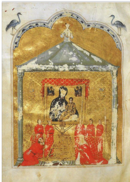
8. IRUDIA: Hamilton Salmo-Liburuko miniatura (1300 inguru). Egun Berlingo Staatliche Museoon dago.

Hodegon elizako baoetatik sartuko ziren eguzki izpiak...—. Bestalde, ikono mirarigilea babesteaz gain, espazio intimoagoa eskaini ziezaiokeen fededunari eta baita, nolabait, sarbidea zaintzeko aukera eman ere, lehentasuna emanaz gaixorik zeudenei eta sendatzeko premia zutenei. Hartaz eta beste zeregin batzuez (hala nola: ikonoaren zainketa eta garbiketa lanez edo Hodegonera sartzen zen fededun orori iturri mirarigiletik hartutako ur bedeinkatua banatzez) elkarte bat (edo diakonia 72 ) arduratzen zen, 73 “San Lukas Ebanjelistaren tribuarekin” erlazionatu ohi zena: Hodegetriaren margolari saildua haien arbasoa izan zela sinesten zen 74 .