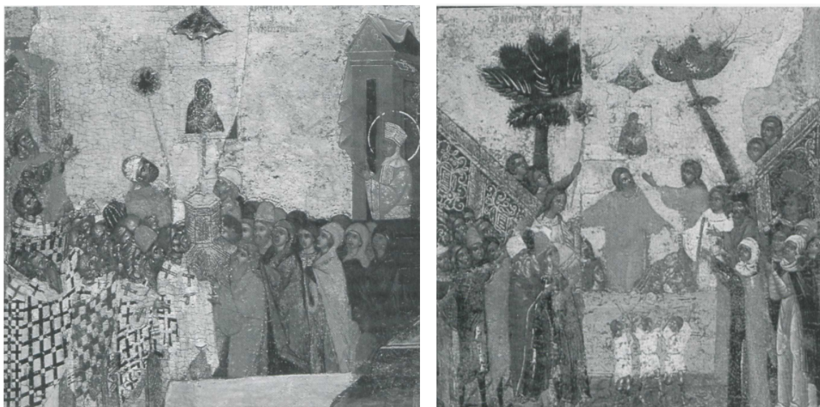
4. ETA 5. IRUDIAK: Hurrenez hurren, Akathistosaren lehen eta azken kontakionak. “Alabantza Ama Birjinari Akathistos zikloaren bidez” ikonoaren (XIV. mendearen bigarren erdia) xehetasunak.

Bestalde, “formalki” ere egin liteke lotura Hodegetria ikonoaren errituaren eta 626ko setioaren parte izan zen gertaera baten artean. Izan ere, antza denez, konstantinoplatarrek laguntza jainkotiarraren premia larria zuten gatazka testuinguru horretan, irudi mirakulutsu bat prozesioan hartuta itzulinguru batzuk eman zizkioten Konstantinoplako harresiei. Bere aldetik, Hodegoneko Amaren astearteroko prozesioetan, erritu garrantzitsuena, azoka plazan Hodegetriaren irudia zeraman lagunak egin ohi zuen mugimendu zirkular errepikakor hura zenez gero, zentzu horretan ere planteatu litezke analogiak. 52