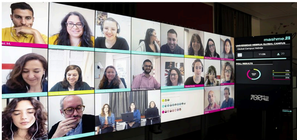
IMAGEN 1. Programa “Nebrija Room of the future”

Room of the future era una tecnología desarrollada por la empresa mashme.io que permitía a los estudiantes presenciales y los que se conectaban en remoto adquirir las mismas competencias y experiencias educativas de una manera personalizada 4 .