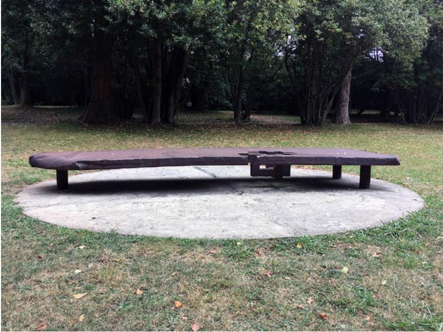
Figura 4. Homenaje a Luca Pacioli.