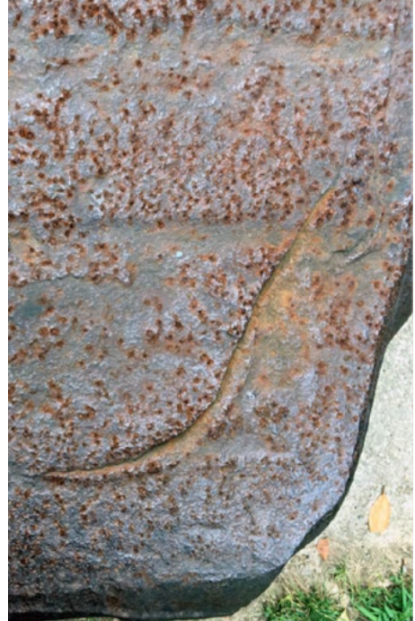
Figura 6. Homenaje a Pacioli (detalle 2)