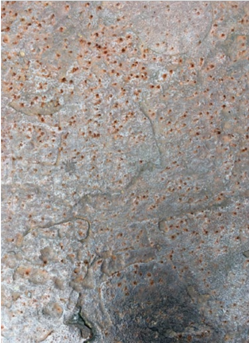
Figura 5. Homenaje a Pacioli (detalle 1)