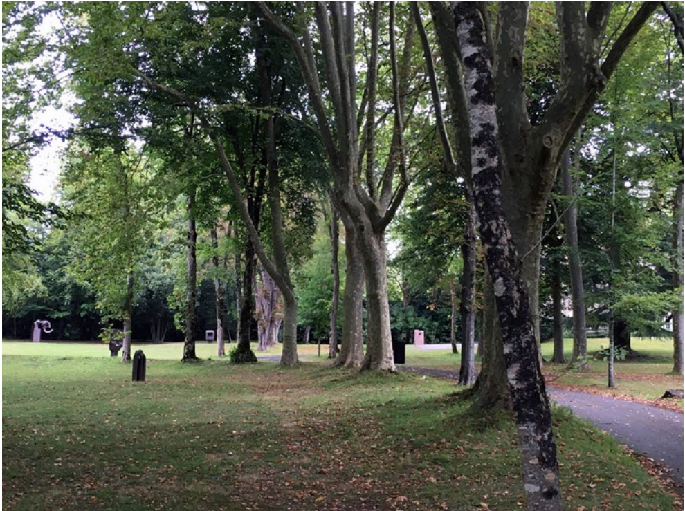
Figura 3. Vista desde la zona boscosa.

Este entorno sostenible es prácticamente un juego visual que imita los trazados topográficos. La misma topografía limita, pero también abre y propicia los recorridos, insinuando direcciones para caminar entre las esculturas.