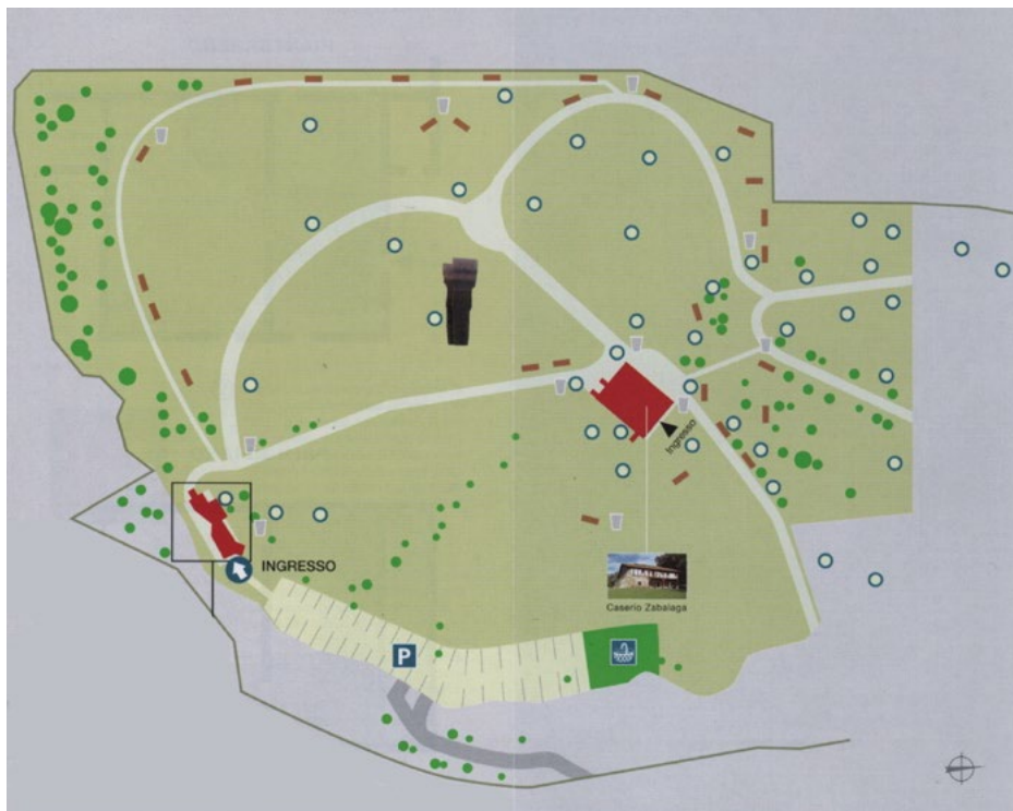
Figura 2. Mapa de Chillida-Leku en 2004.

Con este inventario la propuesta es demostrar el carácter vivo del museo como un paisaje híbrido que se va modificando con el tiempo. Aquí se adjuntan dos mapas de Chillida-Leku, el que está disponible actualmente (2022) y el que corresponde al año 2004 (Figura 2).