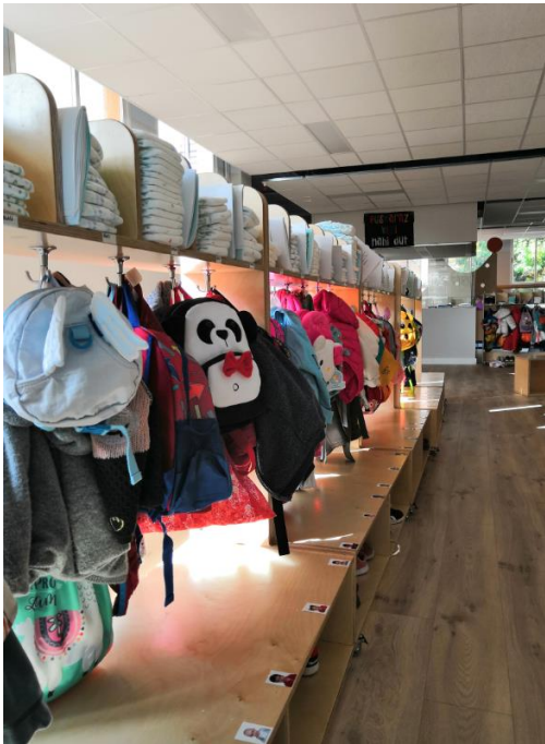
Irudia 1: Egurrezko eskegitoki indibidualak.