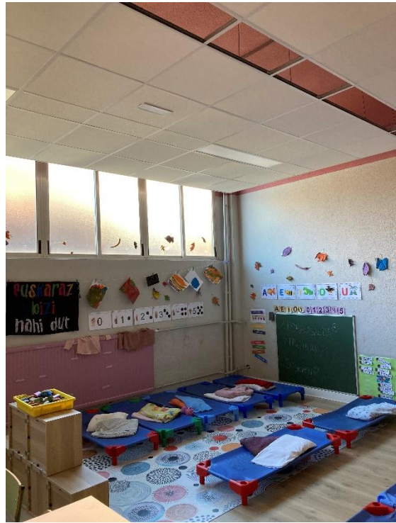
Irudia 2: 3 urteko gelako plastika gunea edo espazioa, siestarako oheekin.