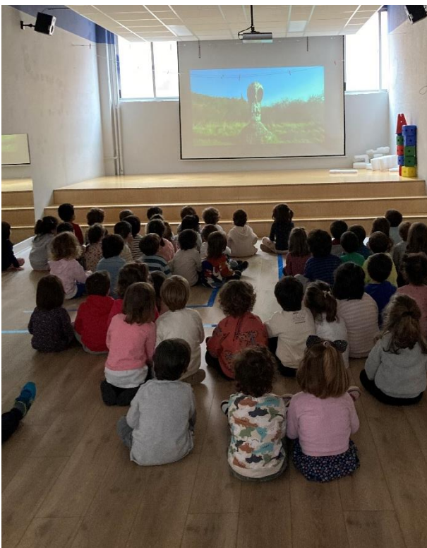
Irudia 3: 'Plaza', bideoak edo pelikulak pantaila handian ikusteko gunea.