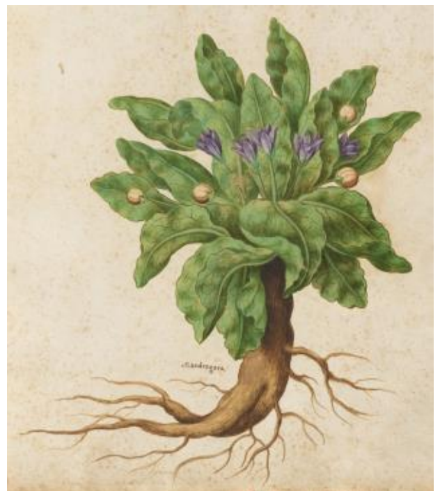
Irudia 23. Giovanna Garzoni, Piante Varie, Mandragora , circa 1630, Dumbarton Oaks liburutegia.