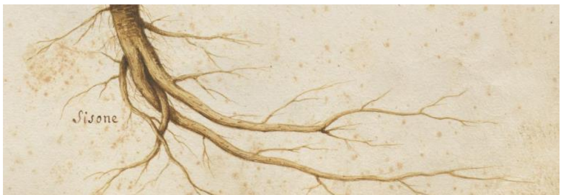
Irudia 31. Giovanna Garzoni, Piante Varie, Sisone , circa 1630, Dumbarton Oaks liburutegia