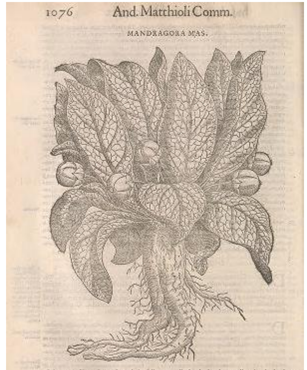
Irudia 10. Andrea Mattioli, Mandragora , Commentarii in Sex Libros Pedacii Dioscoridis , 1544.

Hortaz, nahiz eta zientifikoki baliagarriak diren irudiak izan, XVII. mendeko obra hau arte kategoriaren barruan sailkatu daitekeen liburu botanikoa da. Garzonik lehenagoko ilustrazio zientifikoei beste kategoria bat eman zien, bere trebezia edo gaitasun artistikoen bidez beste maila batera eramanez, lehenago ulergarriak eta identifikagarriak baziren ere, orain haratago doaz. Akaso landara hauek bodegoi edo paisaia irudi baten barruan ikusiko bagenitu ez genituzke ba arte kontsideratuko? Euskarria garrantzitsua den arren, banakako elementuei erreparatu behar diegu eta orain arte ilustrazio botanikoa bezalako adierazpenak artearen mundutik kanpo gelditu diren arren lekurik ote duten zalantzan jarri beharra dago.