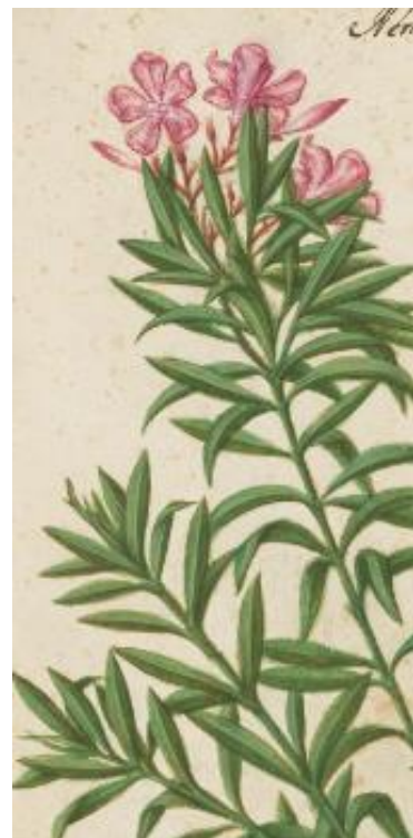
Irudia 25. . Giovanna Garzoni, Piante Varie, Nerium Olander ,circa 1630, Dumbarton Oaks liburutegia