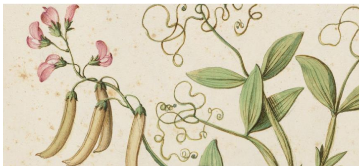
Irudia 34. Giovanna Garzoni, Piante Varie, circa 1630, Dumbarton Oaks liburutegia