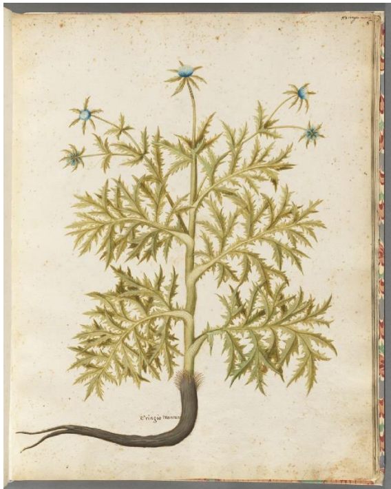
Irudia 9. Giovanna Garzoni, Piante Varie , Eryngio Montano , circa 1630, Dumbarton Oaks liburutegia.