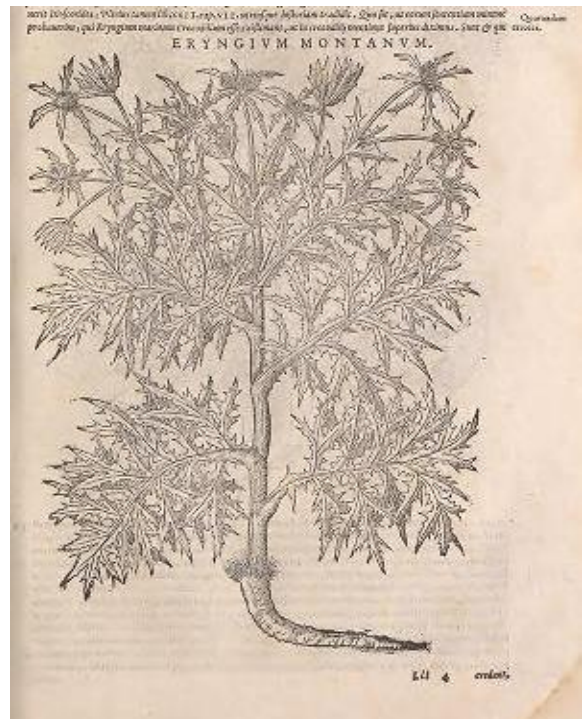
Irudia 8. Andrea Mattioli, Eryngium Montanum , Commentarii in Sex Libros Pedacii Dioscoridis , 1544.