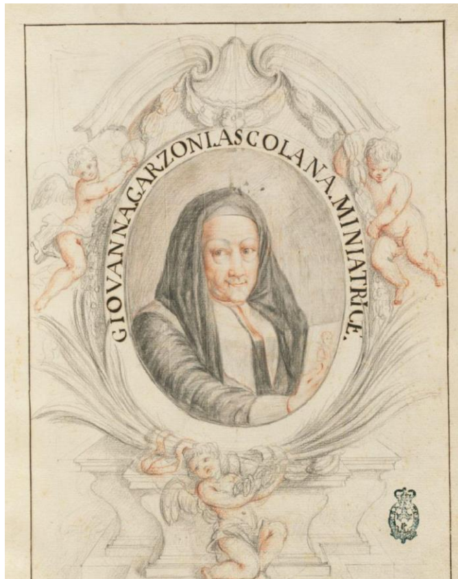
Irudia 3. Giuseppe Ghezzi, Giovanna Garzoniren erretratua , Piante Varie, circa 1630, Dumbarton Oaks liburutegia.