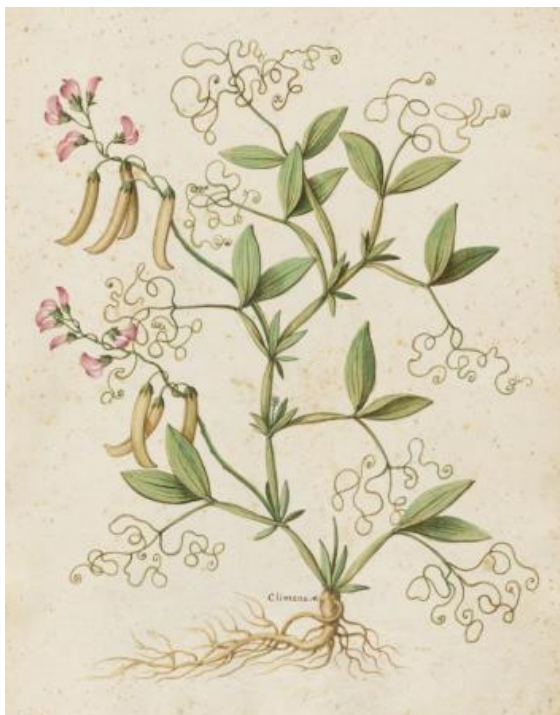
Irudia 33. Giovanna Garzoni, Piante Varie , circa 1630, Dumbarton Oaks liburutegia

Bestetik, berrogeita seigarren ilustrazioari erreparatuz gero, Andrea Mattioliren kuadernoan oso antzerakoa den ale bat dagoela ohartu daiteke. Bien arteko antzekotasuna ageria da eta argi dago Mattioliren ale honetan inspiratu dela, landareren morfologia errepresentatzerako orduan duen antolamendua, aukeratutako elementuak eta forma berberak dira. Hala ere, beste behin, Garzoniren Piante Varie kuaderno botanikoan artea dela demostratzen duten zenbait ideiarekin egiten dugu topo: alde batetik, artistak irudi botanikoa berinterpretatu eta lanketa berri honen bidez landarearen irakurketa erraztu eta edertu du. Sormen eta estilo propio baten bidez Lathyrus Clymenum -aren irudiari bizitasun handiagoa eman dio, kromatismo originalaz gozatzea ahalbidetzen diguna eta ingerada lerro meheago eta disposizio argiago baten bidezkoa. Hortaz, aurreko ilustrazioa botanikari batek egin bazuen ere, oraingoan artista batek egindako ilustrazio botaniko baten aurrean gaude.