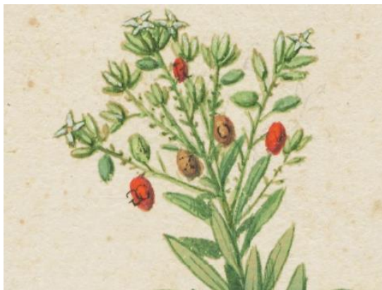
Irudia 14. Giovanna Garzoni, Piante Varie , Timelae , circa 1630, Dumbarton Oaks liburutegia