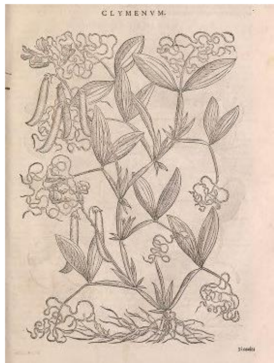
Irudia 32. Andrea Mattioli, Clymenum , Commentarii in Sex Libros Pedacii Dioscoridis , 1544.