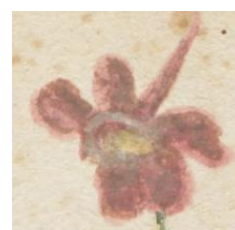
Irudia 21. Giovanna Garzoni, Piante Varie, Consolida Regale , circa 1630, Dumbarton Oaks liburutegia.