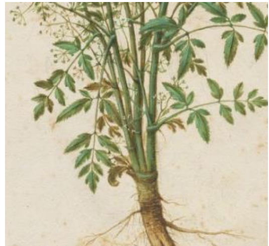
Irudia 29. Giovanna Garzoni, Piante Varie, Sisone , circa 1630, Dumbarton Oaks liburutegia