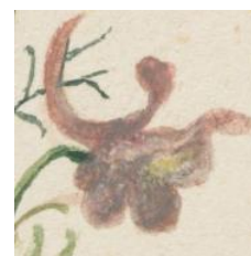
Irudia 20. Giovanna Garzoni, Piante Varie, Consolida Regale , circa 1630, Dumbarton Oaks liburutegia.