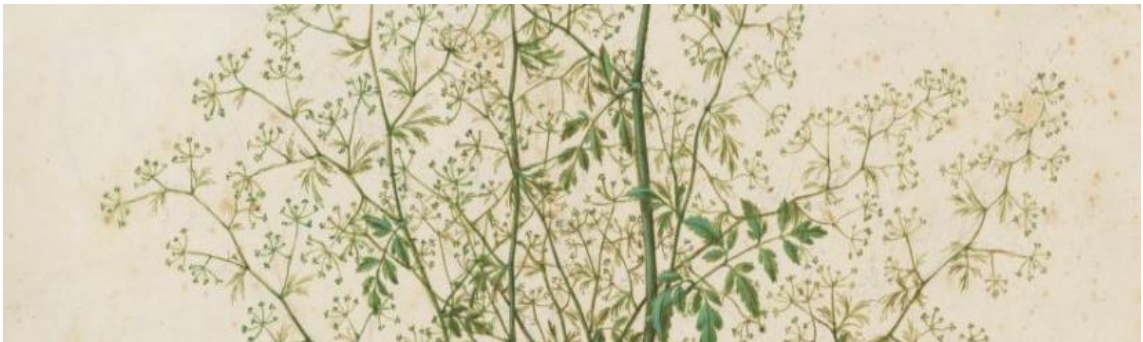
Irudia 30. Giovanna Garzoni, Piante Varie, Sisone , circa 1630, Dumbarton Oaks liburutegia