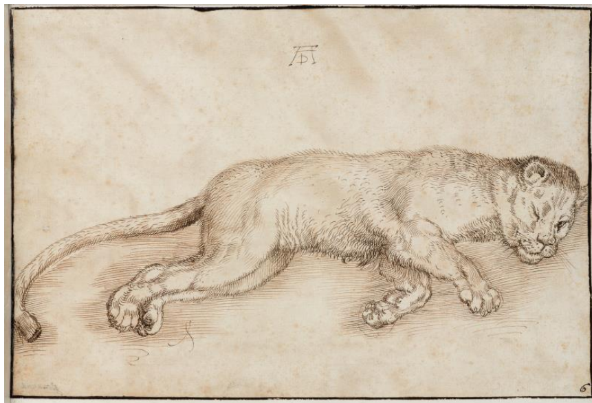
Irudia 4. Giovana Garzoni, Lehoi emea, “ Libro di miniature e disegni , circa 1648, San Lucaren Akademia.

Piante Varie kuadernoaz at, aurrerago Erroman igaro zituen urteetan zientzia eta artearekin zerikusia duen beste obra bat egin zuen, ilustrazio botaniko eta zoologikoz osatutako “ Libro di miniature e disegni ”. Italiako hiriburuan aurkitzen den San Lucaren akademiarentzat egina, botanika eta faunaren inguruko ohar eta diseinuak biltzen dituen liburu interesgarri bat da 27 . Liburuak biltzen dituen marrazkien artean, Albrecht Düreren obran inspiratutako zenbait errepresentazio zoologiko aurkitu ditzakegu, irudiak kopiatzeaz gain jatorrizko artistaren sinadura ere gehitu zizkien marrazkiei 28 . Egun, akademiak traba ugari jartzen dituen arren, kontsultatu daitekeen obra da.