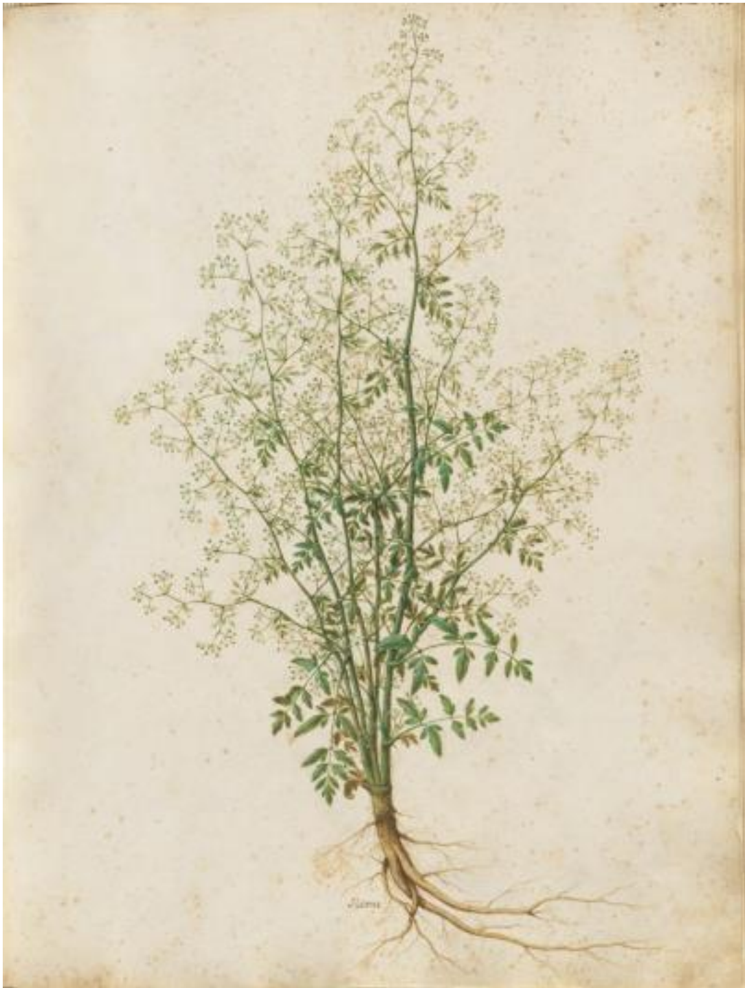
Irudia 27. Giovanna Garzoni, Piante Varie , Sisone , circa 1630, Dumbarton Oaks liburutegia