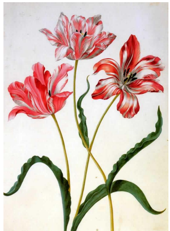
Irudia 1. Maria Sybilla Merian, Hiru Tulipak , circa 1679, Teylers museoa.