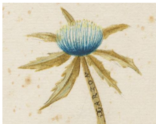
Irudia 13. Giovanna Garzoni, Piante Varie , Eringio Montano , circa 1630, Dumbarton Oaks liburutegia