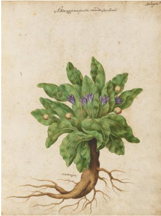
Irudia 11. Giovanna Garzoni, Piante Varie, Mandragora , circa 1630, Dumbarton Oaks liburutegia.