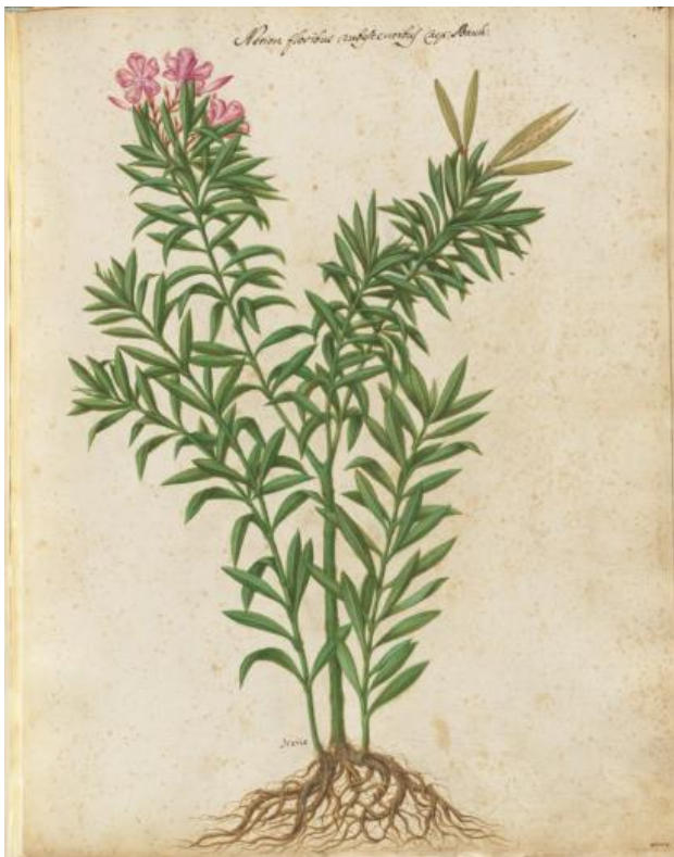
Irudia 26. Giovanna Garzoni, Piante Varie, Nerium Olander ,circa 1630, Dumbarton Oaks liburutegia.