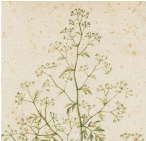
Irudia 28. Giovanna Garzoni, Piante Varie, Sisone , circa 1630, Dumbarton Oaks liburutegia