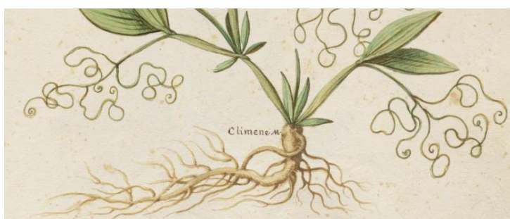
Irudia 35. Giovanna Garzoni, Piante Varie, circa 1630, Dumbarton Oaks liburutegia