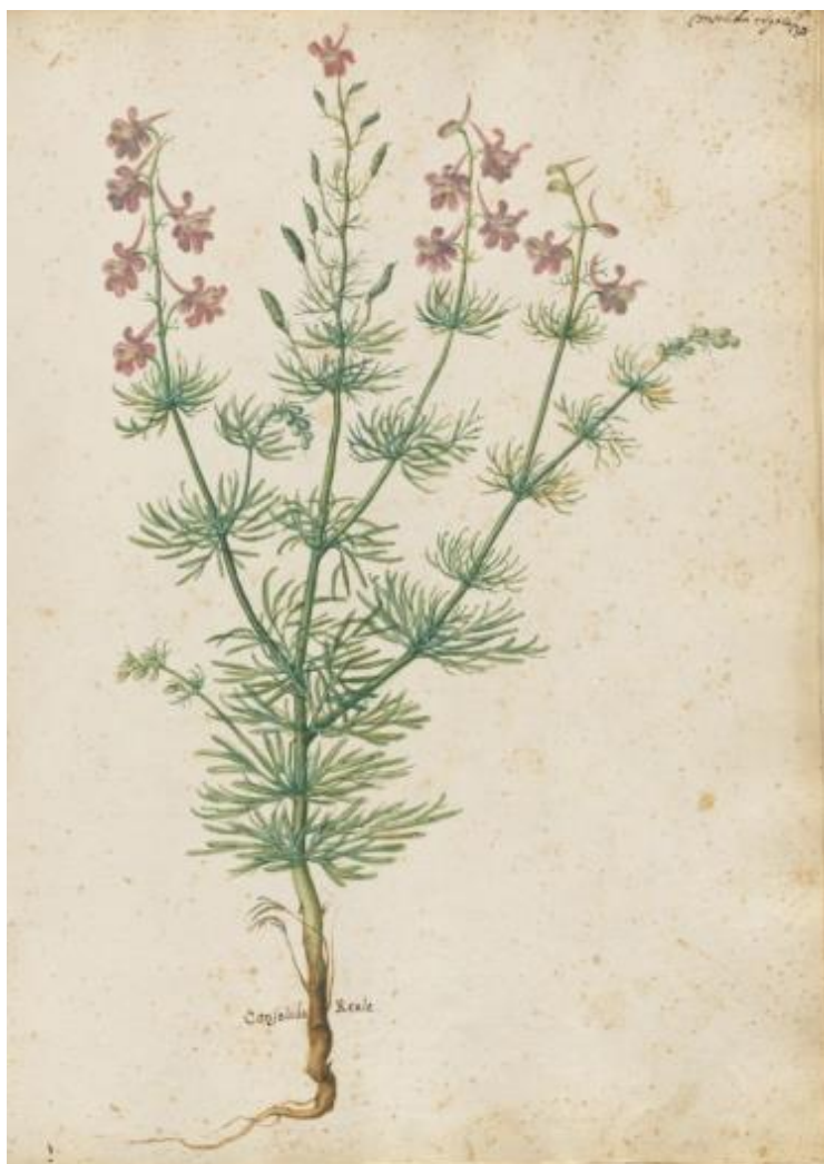
Irudia 18. Giovanna Garzoni, Piante Varie, Consolida Regale , circa 1630, Dumbarton Oaks liburutegia.