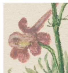
Irudia 19. Giovanna Garzoni, Piante Varie, Consolida Regale , circa 1630, Dumbarton Oaks liburutegia.