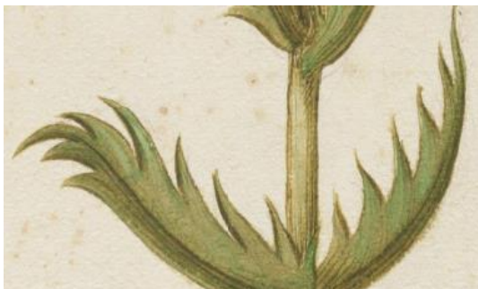
Irudia 16. Giovanna Garzoni, Piante Varie , circa 1630, Dumbarton Oaks liburutegia