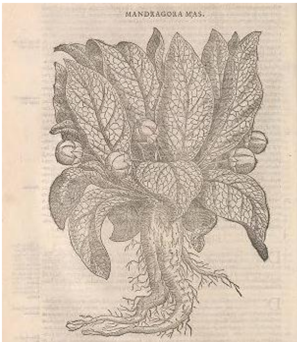
Irudia 22. Andrea Mattioli, Mandragora , Commentarii in Sex Libros Pedacii Dioscoridis, 1544.