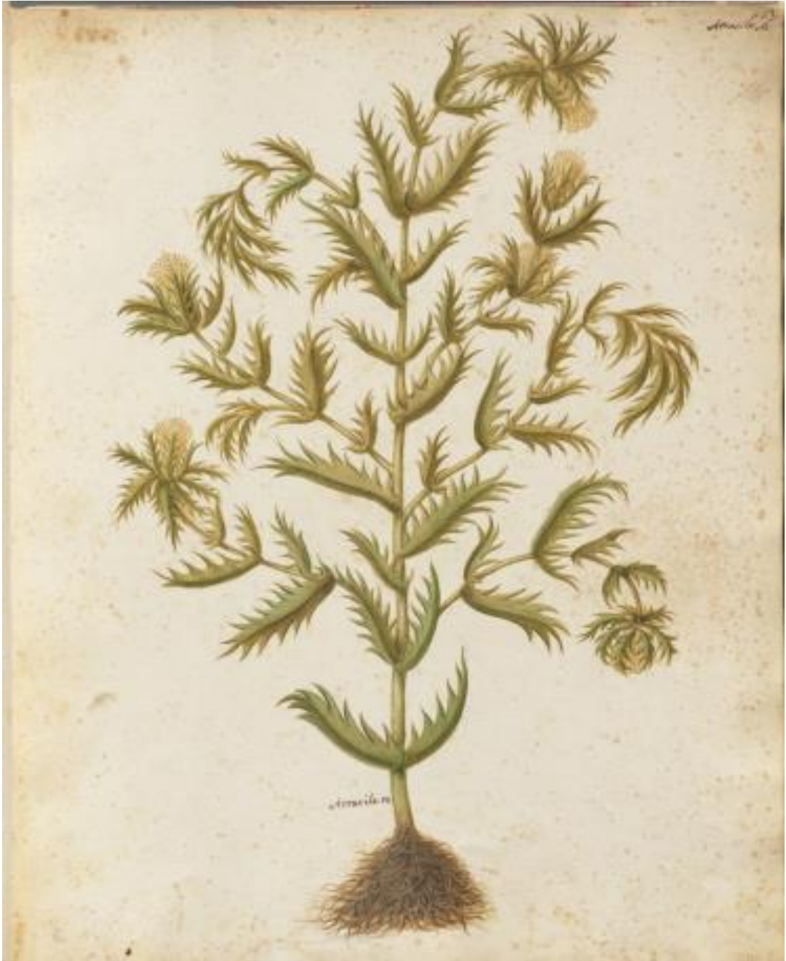
Irudia 15. Giovanna Garzoni, Piante Varie , circa 1630, Dumbarton Oaks liburutegia