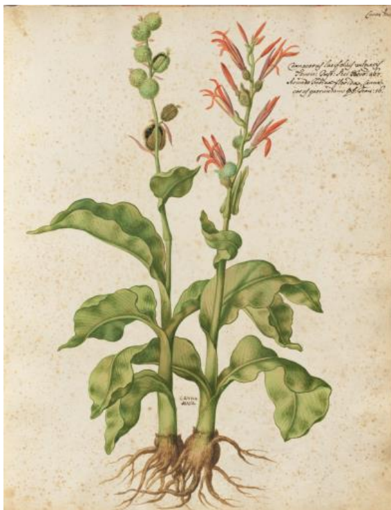
Irudia 2. Giovanna Garzoni, Cana Musa , Piante Varie, circa 1630, Dumbarton Oaks liburutegia.

Adibide bat jartzearen eta aurrerago aztertuko dugun kuaderno botanikorantz abiatzeko asmotan, labur-labur Giovanna Garzoniren eta Maria Sibylla Merian esanguratsuenaren obra bi alderatu nahiko nituzke. Nahiz eta biak zientifikoki balizkoak izan estilo aldetik desberdintasun nabariak aurkitzen ditugu: lehenengoan gama kromatiko urriagoa ikusten dugu, denboraren poderioz bizitasuna galdu duen kromatismoa nabaria izanik. Garzonirenak estatikoagoak aurkezten zaizkigu, Marya Sibylla Merianen errepresentazioak forma kurbatuen bidez mugimendua adierazten du, haize-bolada batek astinduko balu bezala. Bigarreanean, argi-itzalak nabarmenak dira, Garzoniren ilustrazioan baino errealismo gehiago izanik; lehenengoak aldiz itxura opakoagoa du, distira gutxiagokoa. Hortaz, konparazio honek ilustrazio botanikoak mantentzen duen errealismo zientifikoaz haratago sormena eta “arteari dagozkion” elementuak biltzen dituela frogatzen du.