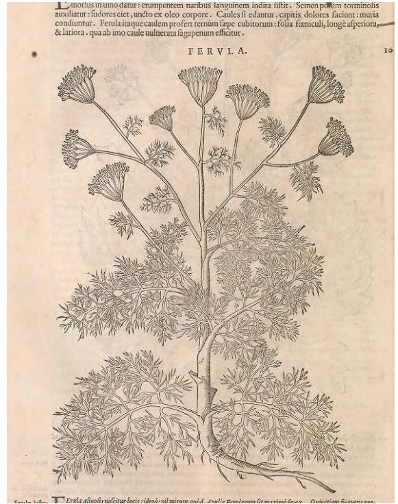
Irudia 6. Andrea Mattioli, Ferula , Commentarii in Sex Libros Pedacii Dioscoridis , 1544.