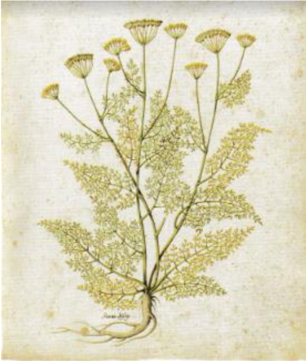
Irudia 7. Giovanna Garzoni, Piante Varie , 27, circa 1630, Dumbarton Oaks liburutegia.