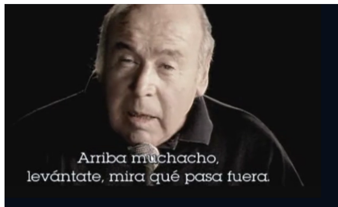
Imagen 1. Mikel Laboa canta frente a la cámara Haika Mutil , entremezclado con escenas de la Transición democrática española. Documental La pelota vasca: la piel sobre la piedra (2003).

El formato del documental alterna las mencionadas escenas de deportes vascos con las entrevistas, agrupadas a veces en 4-5 personas. Los protagonistas están a un lado frente a la cámara, y de fondo se observan paisajes tradicionales de la zona. En el transcurso de las entrevistas se escuchan también varias canciones de Mikel Laboa, como Txoria txori , Haika mutil y Baga Biga Higa , fragmentos de películas como Around the world with Orson Welles , de 1955, Operación Ogro (1979), Yoyes (1997) o incluso una producción del propio director, Vacas , de 1992.