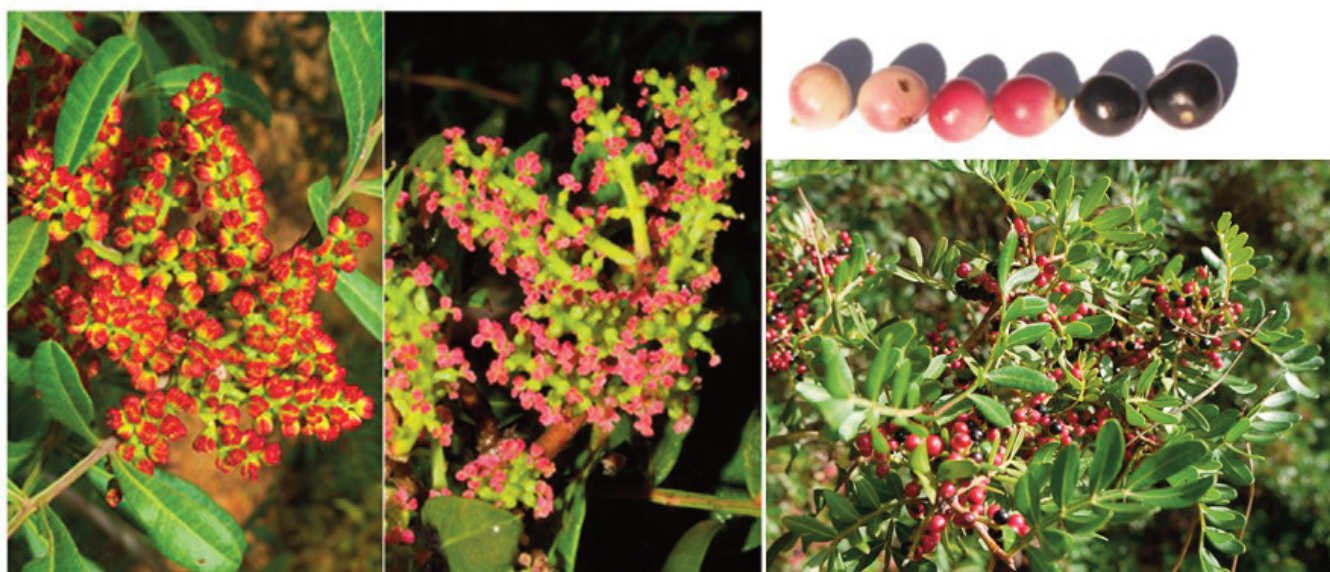
Figura 1. Flores masculinas (izquierda) y femeninas (derecha) de Pistacia lentiscus . En la imagen superior frutos en distintos estadios de maduración desde inmaduros, abortados o partenocárpicos (los blancos y rojos) a maduros que contienen la mayoría de las semillas que son viables (negros). En la imagen inferior, un individuo femenino de P. lentiscus en época de fructificación.

Los frutos del género Pistacia son de tipo drupa, conteniendo una única semilla. La maduración y la viabilidad de las semillas dependen de los recursos hídricos disponibles para la madre (Jordano 1988, 1989; Verdú y García-Fayos 1998a, 2002). Los frutos tienen un diámetro de entre 4-8 mm y la maduración del fruto va asociada a un cambio del color del fruto que pasa de blanco a rojo y finalmente a negro, siendo estos últimos los que contienen la mayoría de las semillas viables, el contenido de los frutos negros es 58.8 % de lípidos, 5.5 % de proteínas y 2.5 % de minerales respecto a peso seco de pulpa (Jordano 1985) (Fig. 1). Los frutos que permanecen blancos o rojos en la planta son de origen partenocárpico, frecuente en la familia Anacardiaceae (Verdú y García-Fayos 1998a) o bien presentan semillas abortadas (Jordano 1988, 1989). En otras es-