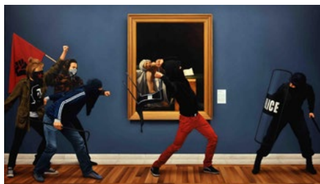
Fig. 10. Action of Assault on art 14, Brussels, 2009. Óleo sobre lienzo, 200 x 300 cm.