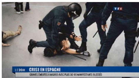
Fig. 9. TF1 news, June 2014, 2014. Gouache sobre papel, 43 x 74 cm.

A pesar de ello, también observa divergencias. Según explica, la pintura de historia trataba acontecimientos pretéritos de relevancia, en contraposición a la obra de Garraza, quien desde la actualidad imagina y plantea un hipotético porvenir. Con todo, González de Durana advierte que los pintores del siglo XIX también emplearon su creatividad e ingenio en sus propias piezas, y que no siempre reflejaron en las mismas los acontecimientos de manera fehaciente.