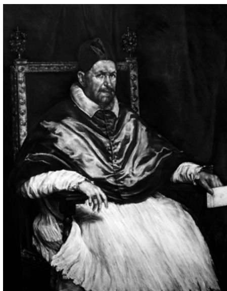
Fig. 6. Innocentius X . 2019. Carbón comprimido y pastel sobre papel, 140 x 110 cm. Imagen cedida por el artista.

En este sentido, como se señala en Ways of seeing , obra coordinada por John Berger, desde que se toma una instantánea fotográfica a una pintura, el carácter de objeto único de la misma desaparece, y que su significado se expande. Garraza opera en dicha resignificación. Y es que tal y como apunta John Berger “The art of the past no longer exist as it once did. Its authority is lost. In its place there is a language of images. What matters now is who uses that language for what purpose” 1 (Berger et al. [1972] 1977, 33). A su