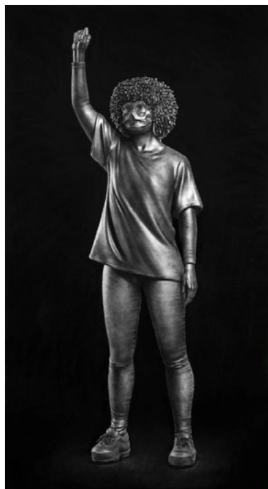
Fig. 19. Model for statue 1 (aluminium). 2021. Carbón comprimido sobre papel, 200 x 110 cm.