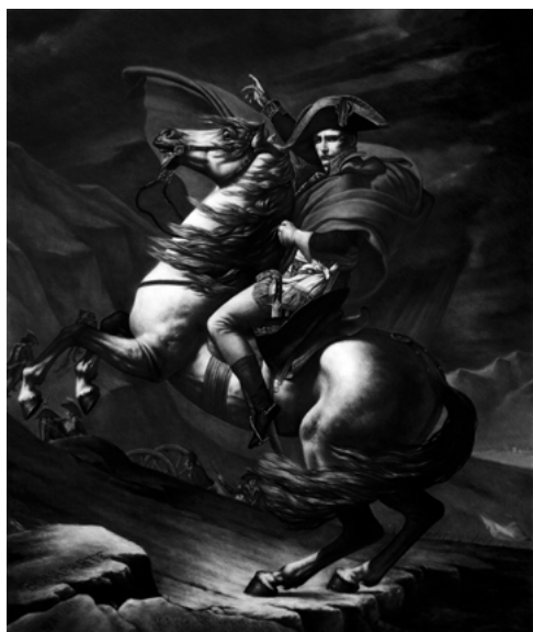
Fig. 5. Napoleon crossing the Alps . 2018. Carbón comprimido y pastel sobre papel, 170 x 140 cm.

cuestión el carácter unívoco de cualquier imagen” (San Martín 2018, 81). De igual modo, San Martín considera que también pueden establecerse vínculos con la obra de Robert Longo (1953), en concreto con la colección Heritage (2006) en la que, según explica, el americano volvió su mirada al pasado para volver a construir unas obras preexistentes a través del dibujo. Por otro lado, David Barro (2018) considera que podrían establecerse nexos entre las obras de Garraza y del fotógrafo Jeff Wall (1946-). Tal y como señala Barro, el resultado que vemos en la obra de ambos artistas es fruto de un proceso premeditado. Así, argumenta que la fotografía del canadiense nos lleva a pensar en pintura de siglos anteriores y que, por su parte, Garraza la toma como referencia para reinterpretar la actualidad. A este respecto, añade que “se narra con el tiempo de otro siglo, recuperando los formatos y maneras de la pintura del siglo XIX, situando al espectador (...) en una suerte de conflicto, donde se conjuga lo político y la memoria desde lo irónico y perturbador” (Barro 2018, 14).