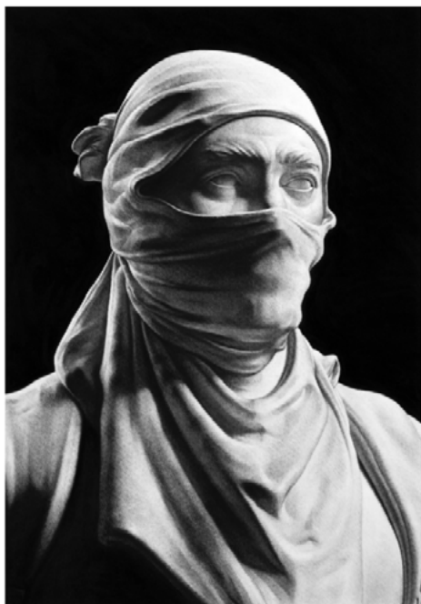
Fig. 21. Model for statue 2 (detail) . 2022. Carbón comprimido sobre papel, 100 x 70 cm.

del dibujo y de la pintura. Es algo relacionado con obras que realicé en el pasado, en las que representé portadas de periódicos y escenas televisivas. Por cuestiones obvias, lo llevaré al terreno donde me defiendo, que es el dibujo y la pintura, pero haciendo mención a que nuestra forma de consumir información o, incluso las noticias, ha cambiado drásticamente. La mayoría de la gente en la actualidad lo hace a través del móvil. Me interesa mucho la configuración de la información a través de ese formato fijo. Por tanto, serán piezas idénticas y lo único que cambiará será el contenido y los medios de comunicación empleados para informarse. No tiene porque ser la página web, sino que puede ser, por ejemplo, la página en Instagram de CNN News , entre otras.