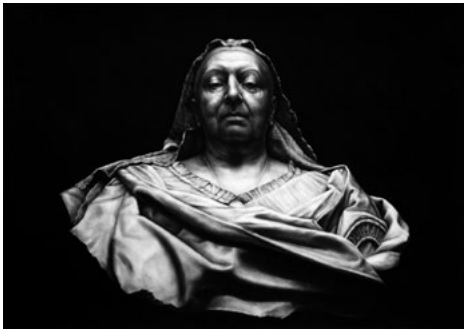
Fig. 7. Queen Victoria . 2016. Pastel sobre papel, 100 x 140 cm.

Muy acertadamente, San Martín explica, en relación a las piezas pertenecientes a la serie Power (2016) de Garraza, que en las obras confluyen tres disciplinas: “la escultura como texto de origen, la fotografía como repertorio en el que la escultura ha sido reproducida y difundida, y el dibujo como traducción y síntesis de todo ello” (San Martín 2018, 75). Del mismo modo, añade que posiblemente por motivo de “las pérdidas de esta traducción el hecho de que a pesar de que los modelos pertenezcan mayoritariamente al pasado y la técnica de reproducción en pastel sea tan fiel al modelo fotográfico, los dibujos tienen un inequívoco sabor contemporáneo” (ibíd.).