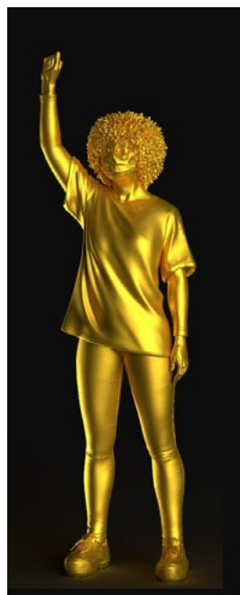
Figs. 16 y 17. El artista en su estudio e imagen de referencia en modelado 3D.