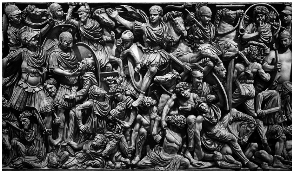
Fig. 4. Sarcophagus . 2018. Carbón comprimido y pastel sobre papel, 140 x 240 cm.

En muchas de sus obras se hacen alusiones directas a obras existentes y, en otras, se apropia de diversos elementos como los visuales, compositivos y procedimentales de siglos anteriores. No obstante, una mirada atenta a sus piezas desvela que Garraza no parte de las obras originales, sino que trabaja a partir de una información superficial que le brindan las fotografías de las mismas, y que con posterioridad, él mismo también edita. Cuando el autor hace una cita a una obra ya existente, vemos que las pinceladas, veladuras, transparencias, empastes o, incluso el mármol de las esculturas, son simulados y reinterpretados; en muchas ocasiones con una técnica completamente distinta como puede ser el carbón comprimido. Esto nos indica que no existe la voluntad de crear una copia exacta de una pieza original, y que el propósito del artista es volver a construir y pensar una imagen a través de nuevas técnicas, formatos, iluminación y, en definitiva, dotarla de un nuevo significado.