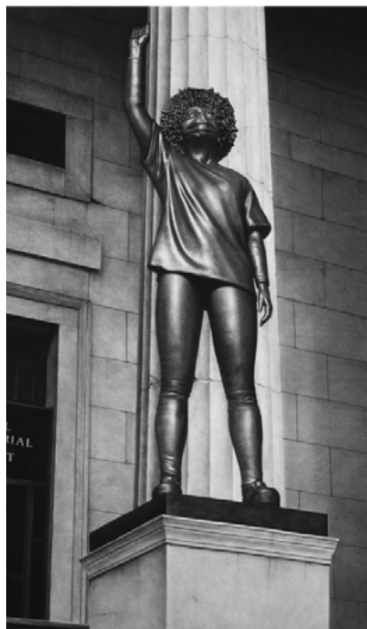
Fig. 20. Proposal for monument 1 (Wall Street, New York). 2021. Carbón comprimido sobre papel, 200 x 130 cm. Imagen cedida por el artista.