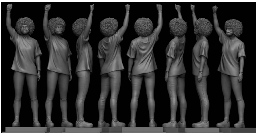
Fig. 18. Imagen de referencia en modelado 3D.

Las obras de Garraza son, en la actualidad, dibujos y pinturas en soporte físico. En conversaciones mantenidas en su estudio, el artista nos comenta que no descarta el uso de otros procesos de trabajo como puede ser la pintura digital en el futuro. Tal y como hemos dicho anteriormente, para la serie en la que trabaja en este momento, el artista ha colaborado con un profesional del modelado en 3D, y dicha cooperación ha llevado a Garraza a trabajar con nuevos programas como puede ser Marmoset Toolbag . La incorporación de esta nueva tecnología a su proceso de trabajo le ha permitido poder crear una escultura, cuyo proceso de elaboración queda detallado en la entrevista adjunta.