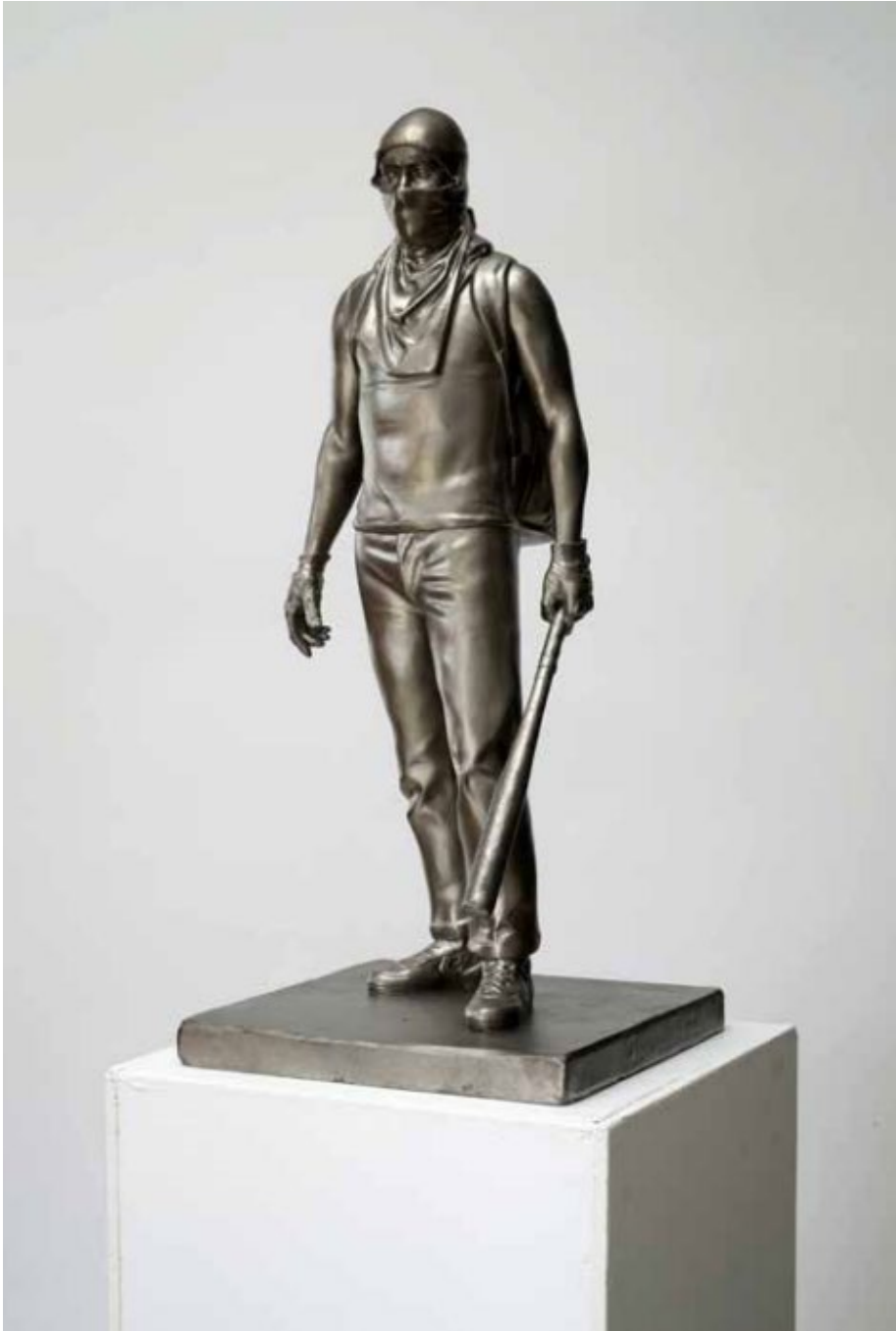
Fig. 23. Model for statue 2. 2022. Acero inoxidable, 60 x 25 x 25 cm. Edición de 6 + 2.