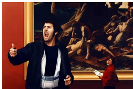
Fig. 11. Action of Assault on art 4, Paris , 2007. Óleo sobre lienzo, 150 x 200 cm. Imagen cedida por el artista.