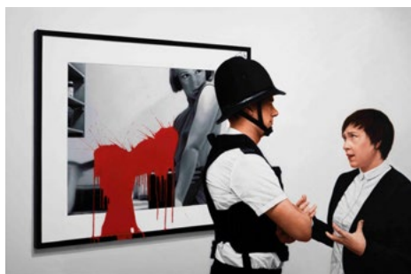
Fig. 12. Aggression 4, Frieze London , 2015. Óleo sobre lienzo, 100 x 140 cm.

Cuando tiene que trabajar con modelos en su estudio, suele emplear elaborados procesos de caracterización, preparando con gran detalle las tomas fotográficas. En este sentido, Barragán, en referencia a la serie Osama (2013), señala que Garraza “recurre al género de historia para recrear una contravisualidad teatralizada, dramática y sensacionalista (...) no duda en mezclar personajes de ficción y personas reales, héroes y anti-héroes, con familiares y amigos (...) a fin de reproducir una escena creíble” (Barragán 2014, 114-115). Del mismo modo, Ángel Calvo Ulloa (2014) destaca la elaborada puesta en escena que realiza Garraza antes de pintar, y encuentra similitudes con el proceder del fotógrafo Andrés Serrano (1950). Según explica, el estadounidense brinda más importancia a los preparativos previos que a la propia captura fotográfica.