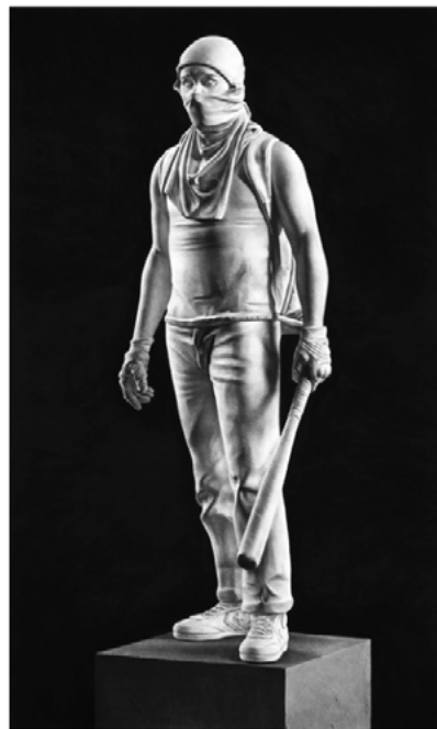
Fig. 22. Model for statue 2 (marble) . 2022. Carbón comprimido sobre papel, 200 x 120 cm. Imagen cedida por el artista.