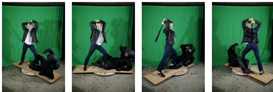
Figs. 13. Sesión fotográfica con modelos en el estudio.

Cuando tiene que trabajar con modelos en su estudio, suele emplear elaborados procesos de caracterización, preparando con gran detalle las tomas fotográficas. En este sentido, Barragán, en referencia a la serie Osama (2013), señala que Garraza “recurre al género de historia para recrear una contravisualidad teatralizada, dramática y sensacionalista (...) no duda en mezclar personajes de ficción y personas reales, héroes y anti-héroes, con familiares y amigos (...) a fin de reproducir una escena creíble” (Barragán 2014, 114-115). Del mismo modo, Ángel Calvo Ulloa (2014) destaca la elaborada puesta en escena que realiza Garraza antes de pintar, y encuentra similitudes con el proceder del fotógrafo Andrés Serrano (1950). Según explica, el estadounidense brinda más importancia a los preparativos previos que a la propia captura fotográfica.