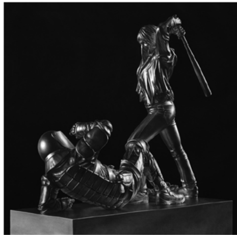
Fig. 15. Model for statue 3 (silver). 2022. Carbón comprimido sobre papel, 195 x 200 cm. Imagen cedida por el artista.