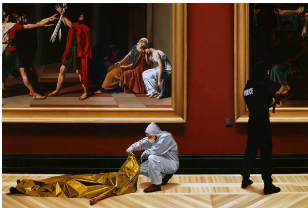
Fig. 1. Action of assault on art 7. Paris, 2008. Óleo sobre lienzo, 200 x 300 cm