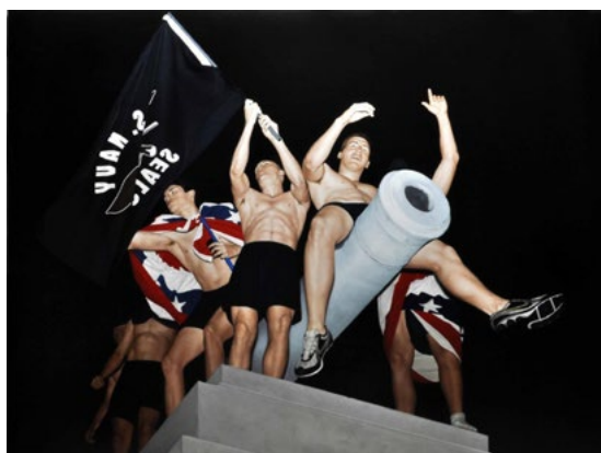
Fig. 2. Celebration 2 . 2012. Óleo sobre lienzo, 150 x 200 cm. Imagen cedida por el artista.

Es de gran interés ver cómo la obra de Garraza ha evolucionado con los años, desde plantear críticas al establishment del arte, pasando por representar mundos distópicos, hasta reflexionar sobre la consagración de las figuras de poder a través de las esculturas. Todo ello, como decimos, empleando un lenguaje pictórico que ha ido también enriqueciéndose con el paso del tiempo. A este respecto, Raffaele Quattrone opina que Garraza ha revitalizado un realismo que se consideraba caduco, a través de la creación de piezas que se nutren de los medios de información y del cine. Añade que el artista “a menudo construye sus obras siguiendo una delgada y frágil línea de demarcación que separa lo hiper-real de lo irreal” (citado en Di Fabio & Garraza 2017, 14).