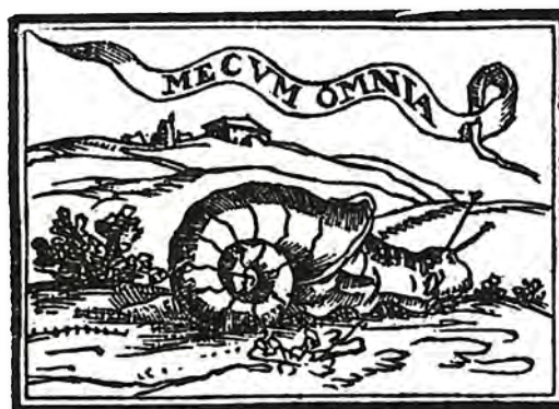
Fig. 2. El caracol, Bernat Vistarini, A., Cull, J. T. [1999]. Enciclopedia de Emblemas Españoles Ilustrados .

Percibiendo que la respuesta que buscábamos no se encontraba en los textos clásicos, ampliamos el ámbito de búsqueda incluyendo las obras de emblemistas contemporáneos puesto que, según era preceptivo, al artista le convenía conocer y tratar a los hombres instruidos de su propio tiempo (Rensselaer, 1982: 73). Descubrimos que, poco después, Sebastián de Covarrubias había utilizado la imagen del molusco en su emblema 78 de la segunda centuria de sus