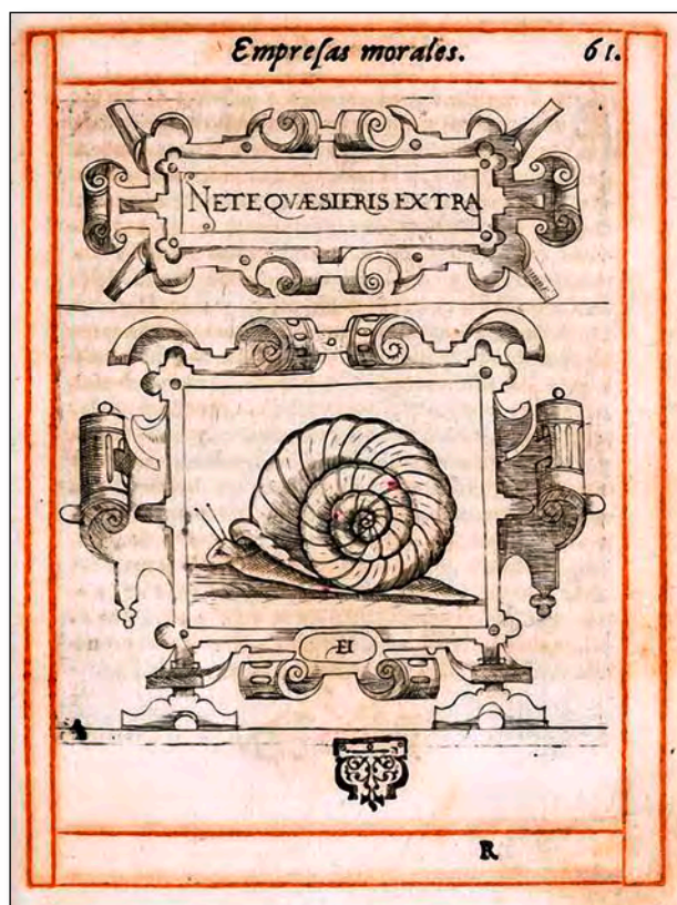
Fig. 1. Empresa LX, Borja, J. [1680]. Empresas Morales .

En otra ocasión (Martínez Sobrino, 2007), hablando de las relaciones de las Sátiras de Persio en las Empresas morales de Juan de Borja, decíamos acerca del emblema 60 que, así como el mote « Ne te quaesieris extra » (Pers. 1, 7) provenía claramente del autor latino, el origen de la pintura permanecía desconocido [fig. 1].