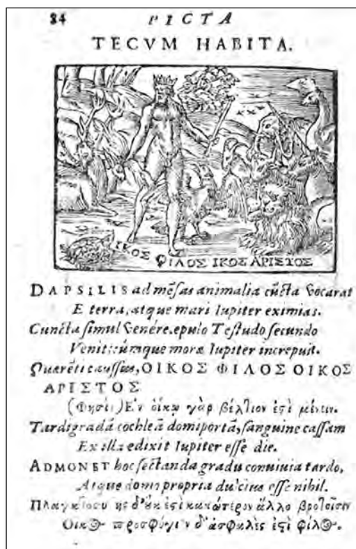
Fig. 3. Tecum Habita, Barthèlemy, A. [1552]. Picta Poesis .

10. Traducción nuestra: «Júpiter había convocado a todos los animales de tierra y mar a sus ricas y eximias mesas. Todos llegaron juntos. / La tortuga llegó al segundo plato y Júpiter le reconvinó por su demora. A la que se le pedía