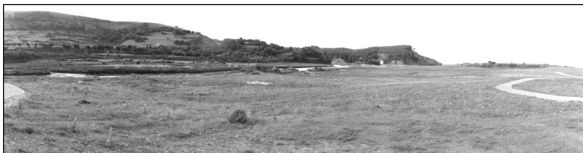
Figura 3. Fotografía actual de la recuperación de la marisma de Pobeña.