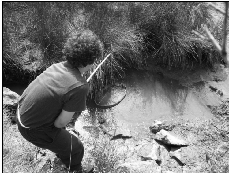
Figura 5. Joven pescando en la marisma

Los modos de vida en la marisma han estado caracterizados por cuatro actividades principales: la pesca, la caza, la ganadería y la recolección. La pesca artesanal de varias especies animales, especialmente angulas, moluscos (mejillones o mojojones ), quisquillas ( crangon crangon ) o gusanos para usar como cebo en la pesca con caña (MONTENEGRO, 2007). La actividad cinegética se desarrollaba durante los periodos de pase de las especies migrantes, especialmente patos y becadas, aunque también de otras especies que residían durante todo el año en la marisma como mirlos comunes o zorzales. La ganadería sigue siendo una actividad que se desarrolla en la marisma y en las zonas de vega próximas, aunque en claro descenso según los datos del censo agrario (EUSTAT, 2011). Y por último, la recolección de diferentes especies vegetales, principalmente las algas, usadas con fines medicinales y que suponen una fuente de ingresos para algunas personas. Una especie vegetal recolectada en épocas pasadas eran los juncos que se usaban para adornar y revestir el interior de las iglesias (GLARIA, 2003).