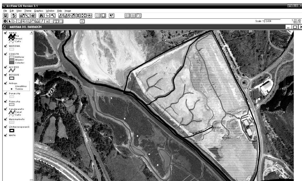
Figura 4. Imagen del análisis SIG.