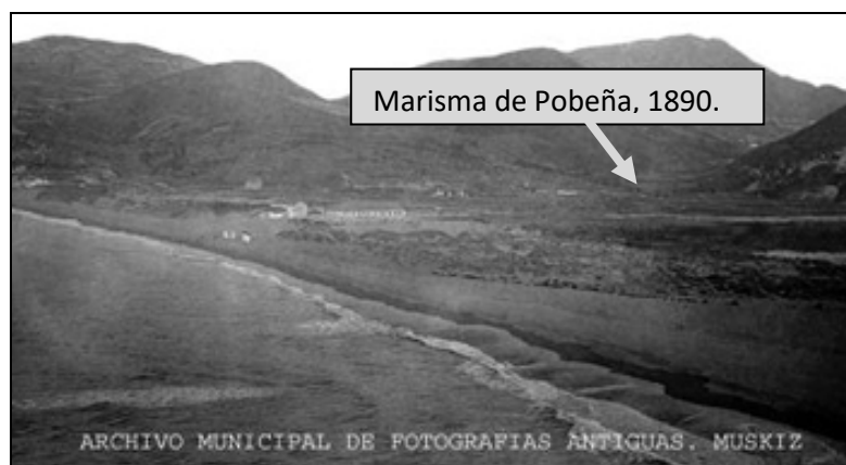
Figura 1. Fotografía histórica de la Marisma de Pobeña, año 1890.