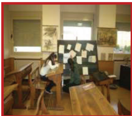
Ilustración 2. Alumnos de la Escuela de Magisterio de Zamora en el CEMUPE

En el escenario de convergencia que representa la apuesta por un espacio europeo de educación superior, es preciso comenzar por una reflexión sobre el significado e importancia de nuevos formatos de enseñanza en el marco de la Historia de la Educación de los nuevos planes de estudios. En este sentido, la actuación del Centro Museo se dirige a conseguir unos conocimientos y competencias generales que permitan a profesores y alumnos poseer una base científica y humanista en relación con los procesos educativos, culturales y de enseñanza a lo largo de la historia educativa contemporánea. Para ello se programan actuaciones diversas que incluyen