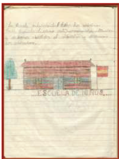
Ilustración 5. Cuaderno de trabajo individual del alumno

Es, sin embargo, el estudio de los cuadernos de la escuela lo que marca la línea de actuación e investigación más importante del Centro Museo