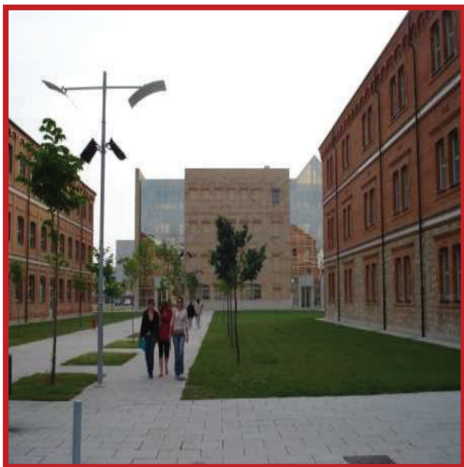
Ilustración 1. Edificio del CEMUPE (Centro Museo Pedagógico) de la Universidad de Salamanca.

Este Centro se convierte en instrumento de primer orden en la conservación del patrimonio legado, la recuperación de la memoria, la interpretación de la historia educativa o la investigación de la Historia de la Educación. La sede del Centro Museo Pedagógico radica en el Campus Viriato de Zamora, en las dependencias del edificio "Aulario" de la Escuela Universitaria de Magisterio. Actualmente en sus espacios hay una exposición permanente con dos aulas que representan dos modelos educativos del siglo XX: el de la Segunda República y el del franquismo; una sala de investigación y de trabajo