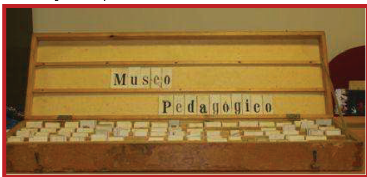
Ilustración 3. Recurso didáctico para la enseñanza de la lectura donado al CEMUPE.

Los objetos y los materiales escolares nos transportan muchas veces al