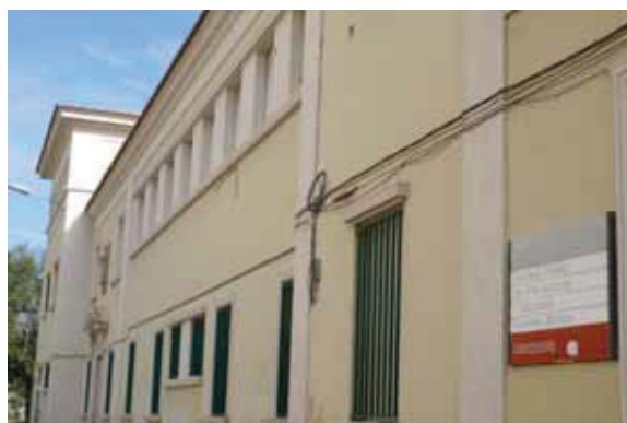
Colegio Público Padre Manjón, c/ Castillo de Cullera nº 3, Valencia.

Este centro escolar está dedicado al sacerdote y pedagogo burgalés de la escuela activa y fundador de las escuelas del Ave María en Granada, Andrés Manjón 21 , el cual, paradójicamente, se convirtió en un referente e icono de la educación franquista, llegando incluso a citar su persona y obra educativa como paradigma de la pedagogía española en el preámbulo de la Ley de Educación Primaria de 1945: