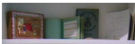
Foto 11. Libros de costura, utensilios y trabajos de la clase de labores