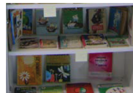
Foto 7. Libros de texto