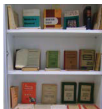
Foto 14. Libros de texto de Magisterio

En esta sección, también se muestran ordenadas cronológicamente, prensa y revistas especializadas con artículos escritos por maestros e inspectores. Entre las diversas publicaciones expuestas están varios números de Cuadernos de Pedagogía , Bordón , Vida escolar , publicada por CDODEP, y de Orientación Pedagógica , que era un boletín de la Inspección de Enseñanza Primaria.