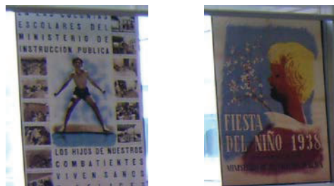
Foto 13. Cartel publicitario de las colonias y de la Fiesta del año 1938

ideas principales, se tienen que presentar por medio de frases que utilicen el vocabulario específico de la materia, y además, tienen que tener agarre publicitario. Las frases tendrán que ser cortas y de fácil comprensión. El texto se tiene que combinar con imágenes expresivas e impactantes.