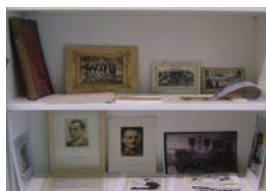
Foto 12. Documentos y fotografías de una clase de la época franquista