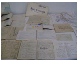
Foto 8. Actividades de sociales Matemáticas y lenguaje