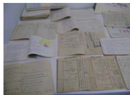
Foto 9. Actividades de contabilidad