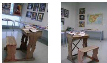
Foto 2. Pupitre unipersonal

Hay que recordar que el mobiliario escolar está lleno de historia, y como testimonio vivo del pasado, nos permite analizarlo. En la exposición encontramos un pupitre unipersonal que representa el mobiliario que se podía encontrar en un aula de una escuela pasada. Este pupitre está hecho de madera tradicional. Posee un tablero inclinado y abatible que deja, debajo de él, un cajón para colocar libros y material escolar. En el tablero hay un agujero y una ranura para poner el tintero y la pluma. El asiento está formado por un banco sin respaldo, formando todo ello una única pieza.