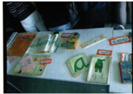
Foto 4. Material didáctico lecto-escritor, láminas de religión, mapa físico de España