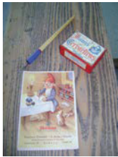
Foto 3. Pluma y papel secante

También, se muestra en esta sección algunos recursos didácticos que se empleaban en las escuelas de ayer como el franelograma utilizado para las explicaciones de la materia de Geografía (mapa de España con los límites) o de Ciencias Naturales (los animales domésticos). Además, en esta parte de la exposición, se habilitó un espacio dedicado a los materiales audiovisuales, con un proyector de diapositivas y de películas de cine, que sirvieron de apoyo en las explicaciones de los maestros.