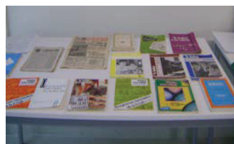
Foto 15. Revistas pedagógicas