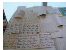
Foto 10. Copias de Caligrafía