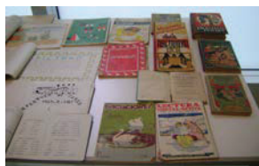
Foto 6. Cartillas, libros de lectura y Enciclopedias