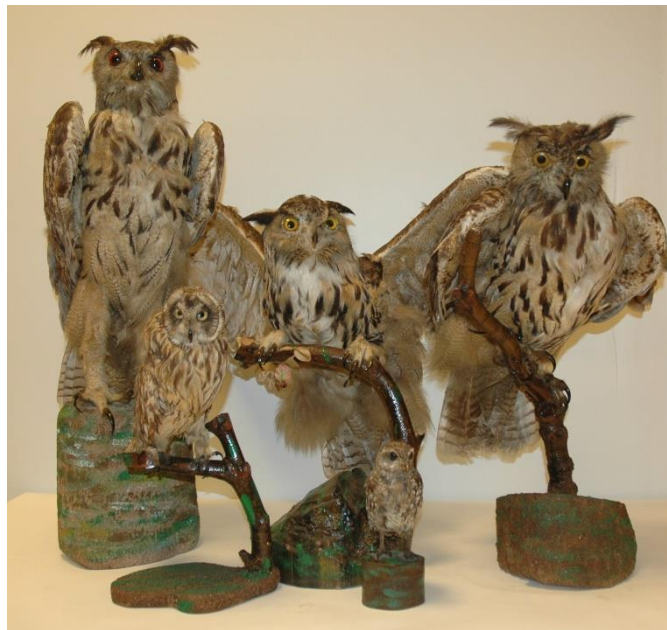
Ilustración 5. Colección de aves disecadas del CEME. Rapaces nocturnas: tres ejemplares de búho real Bubo bubo , una lechuza campera Asio flammeus y un mochuelo Athene noctua (López, 2012: 46).

CEME cuenta entre sus principales colecciones, además de las procedentes de la Escuela Normal ya referidas, con las de manuales escolares, formada por más de 1.300 libros de texto (López, 2015), de cuadernos escolares, con un número en torno a un millar (Viñao y Martínez, 2011), de catálogos comerciales de material de enseñanza, compuesta por unos 250 volúmenes, que también ha sido referida en diversos trabajos —como, por ejemplo, (Martínez, 2012; Martínez, Moreno y Sebastián, 2013; Moreno y Marín, 2014; Moreno y Sebastián, 2012)—, de fotografías (Moreno, 2015) y tarjetas postales de imágenes escolares (Viñao y Martínez, 2015), con unas 500 y 300, respectivamente. También se ha generado un fondo documental sobre la memoria de los docentes que, entre otras iniciativas, se ha concretado, hasta el momento, en la creación de la “Colección del CEME de archivos personales de antiguos docentes”, ubicada en el Archivo Universitario de Murcia, iniciada en 2015 con la donación, catalogación y puesta a disposición de los investigadores del legado de Félix Martí Alpera, o la colección de documentos audiovisuales con la realización de grabaciones de grupos de renovación pedagógica mencionados.