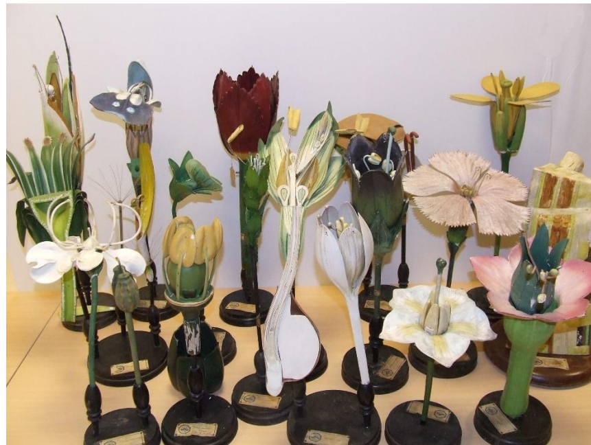
Ilustración 1: Modelos de botánica del CEME de la casa comercial Cultura procedentes de las colecciones de la antigua Escuela Normal de Murcia (López, 2012: 59).

Asimismo, el Centro de Estudios podía contar con un rico legado de materiales didáctico-científicos existente en la Facultad de Educación procedente, principalmente, de los gabinetes de Historia Natural y Física y Química de la antigua Escuela Normal de Murcia creada en 1844 formado, principalmente, por animales naturalizados, láminas y modelos, instrumentos y aparatos y materiales para la enseñanza de diferentes disciplinas datados desde finales del siglo XIX. También se disponía del material bibliográfico existente en el Departamento de Teoría e Historia de la Educación como una colección de unos 300 manuales escolares, medio centenar de catálogos de material de enseñanza, discos utilizados en las campañas de alfabetización, cartillas, carteles, cuadernos escolares, grabados, postales, fotografías, diapositivas, etc.