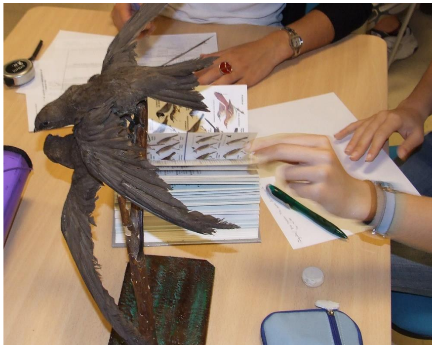
Ilustración 4: Sesión de prácticas del alumnado de Didáctica de las Ciencias realizadas con modelos naturalizados de aves conservados en el CEME (López, 2102: 90).

Una segunda línea de actuación abarca las actividades de carácter académico y formativo desarrolladas. Tales actividades pretenden colaborar en la formación inicial, sensibilización y concienciación de los estudiantes de los Grados y Másteres impartidos en la Facultad de Educación de la Universidad de Murcia del valor cultural, etnográfico, histórico y educativo que representa el patrimonio educativo impulsando la incorporación de disciplinas o de contenidos curriculares. También se ha contribuido a la formación de alumnos internos, becarios de colaboración y becarios de formación de personal docente e investigador, favoreciendo la realización de visitas organizadas a la sede del CEME, o de itinerarios efectuados a otros espacios e instituciones históricas de interés, así como poniendo a disposición del profesorado los fondos del CEME para la realización de prácticas y actividades académicas.