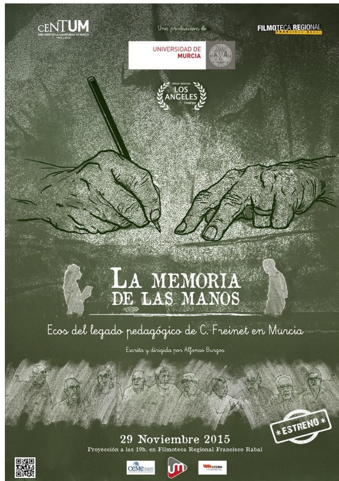
Ilustración 2: Póster conmemorativo del estreno del largometraje documental: “ La memoria de las manos. Ecos del legado pedagógico de C. Freinet en Murcia ”.

Asimismo, se ha favorecido la iniciación a la investigación de alumnado de grado y postgrado, mediante la realización de Trabajos de Fin de Grado y Máster, Tesinas de licenciatura y Tesis Doctorales. También se ha reforzado la colaboración con grupos de investigación procedentes de otras universidades e instituciones españolas —como, por ejemplo, el Centro de Investigación MANES, con sede en la UNED, o el Centro Internacional de la Cultura Escolar (CEINCE) de Berlanga de Duero (Soria)— y extranjeras —tales como la Rede de Investigadores em História e Museologia da Infância e Educação (RIHMIE) de Portugal o el Centro di Documentazione e Ricerca sulla Storia del Libro Scolastico e della Letteratura per l'Infancia (CESCO) de la Universidad de Macerata (Italia)—. Igualmente, se ha propiciado la participación de sus miembros en seminarios, jornadas, coloquios y reuniones científicas nacionales e internacionales así como, en algunos casos, se ha colaborado en su organización —como del Simposio Internacional La Memoria Es-