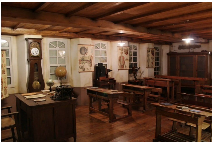
Escuelas llegadas de ultramar