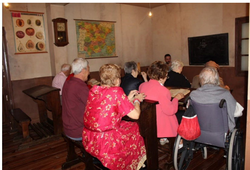
Visita de grupos de personas mayores

Además de estudiantes, el museo recibe de forma habitual otro tipo de grupos de procedencia diversa: asociaciones, centros cívicos y culturales, centros residenciales... En estos casos se ofrece también la posibilidad de realizar una visita guiada por un educador/a en la que tratamos de nuevo de adaptarnos a las características específicas de cada tipo de grupo, así como buscar el diálogo y la participación de todos sus miembros durante la actividad. En este sentido destacamos la importancia de abordar de manera habitual la revisión, y si fuese necesario la reformulación, de este tipo de actividad para lograr la mejor adecuación posible de acuerdo con las necesidades tan diversas de los grupos que nos visitan. En nuestro caso una de las acciones recientemente derivadas de este proceso de revisión y de mejora de la accesibilidad ha sido la elaboración de guías del museo adaptadas con pictogramas que faciliten la preparación previa de la visita por parte de usuarios con diversidad funcional. Así mismo, y en una línea muy similar, actualmente nos encontramos trabajando en el desarrollo de visitas accesibles para personas con discapacidad visual, en comunicación directa con la ONCE.