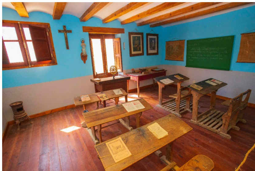
Imagen 9. Escuela antigua de La Cuba.