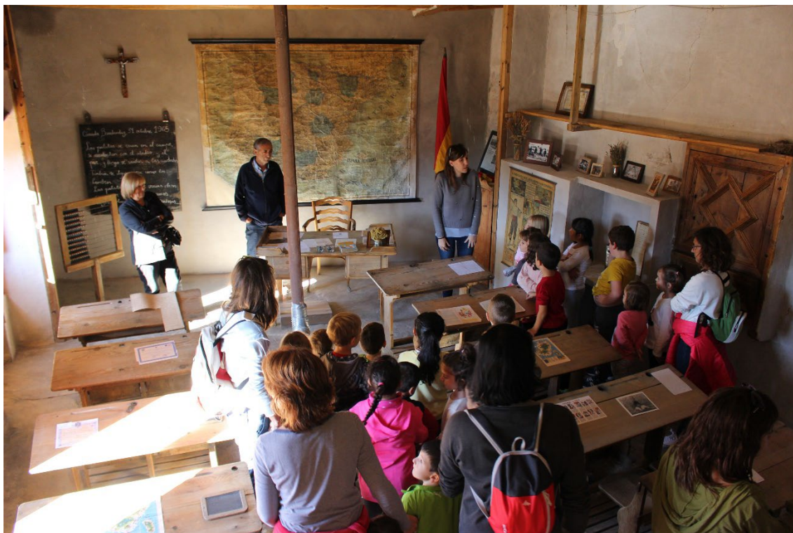
Imagen 13. Alumnado del CRA Olea en la visita guiada por parte de dos antiguos alumnos a la escuela antigua de Cañada de Benatanduz.

Seguidamente se desarrolló el taller de escritura con pluma utilizando textos con caligrafía y vocabulario de mediados del siglo XIX y después, se llevó a cabo el de indumentaria tradicional con su posterior fotografía en la mesa del maestro de la escuela antigua.