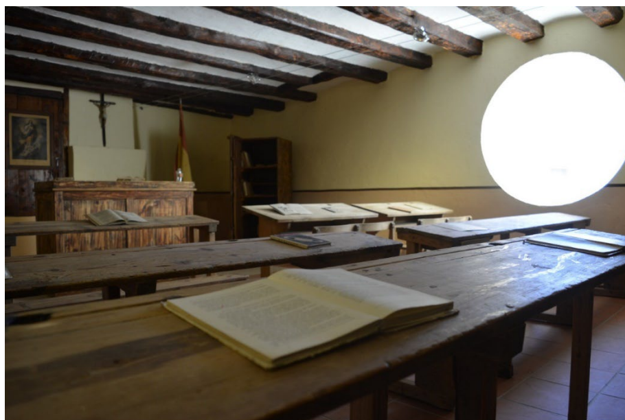
Imagen 7. Escuela antigua de la partida masovera de San Juan del Barranco.

Fue la primera escuela que se recuperó dentro del proyecto “La escuela de ayer para construir el mañana”. En 2015 se trasladó a Cantavieja y se ubicó en la antigua vivienda del campanero.