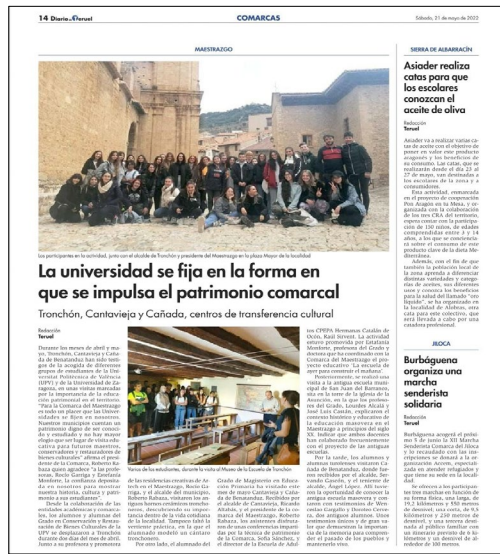
Imágenes 16 y 17. Recortes de prensa que dan a conocer las visitas realizadas a las antiguas escuelas por los estudiantes de magisterio de la Facultad de Ciencias Sociales y Humanas de Teruel (UNIZAR).

Las autoras de este texto también se han encargado de presentar el trabajo realizado en distintos foros científicos y divulgativos. El último de ellos fue el encuentro realizado en el marco de las Jornadas d’Escoles Rurals en Benassal (Castellón) y dio pie a iniciar colaboraciones con el profesorado de la Universidad Jaume I que asistió a dicha jornada.