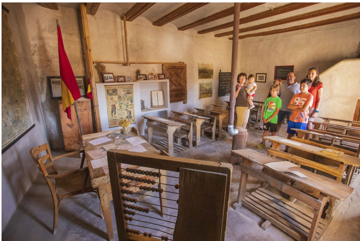
Imagen 11. Recreación de la escuela antigua de Cañada de Benatanduz.

Como materiales didácticos a destacar se conservan un mapa de España de enormes dimensiones de 1898 que ha sido restaurado, un cartel para prevenir la tuberculosis, un mural de la tabla de restar o una caja de leche en polvo de las distribuidas por el Servicio Escolar de Alimentación.