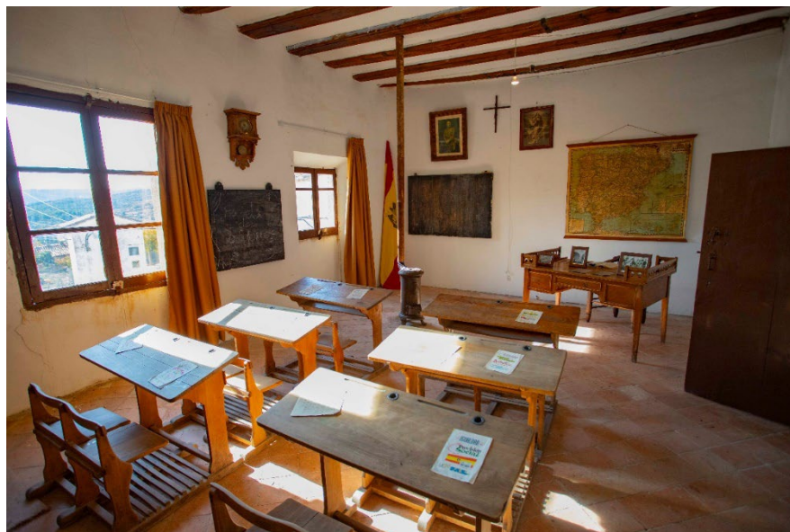
Imagen 6. Escuela antigua de Dos Torres de Mercader.