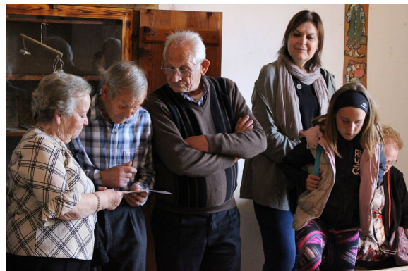
Imágenes 4 y 5. Antiguos maestros, alumnos y vecinos de Dos Torres de Mercader en la celebración del 25 aniversario.

Desde la dirección del proyecto se intenta difundir cada una de las actividades realizadas a través de la prensa (Diario de Teruel, La Comarca, Heraldo de Aragón) y de la radio (Onda Cero, Aragón Radio...) y en este último medio es en el que más se implica la población siendo ellos mismos los interlocutores mostrando el valor de su escuela.