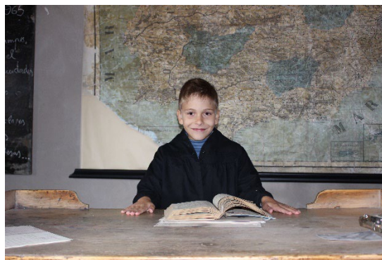
Imágenes 14 y 15. Alumnado del CRA Olea y del CRA Alto Maestrazgo disfrutando del taller de escritura y del de indumentaria.

La segunda parte de la jornada consistió en una visita comentada al pueblo para conocer la historia de los edificios más emblemáticos, sus funciones y el modo en el que se construían. La visita terminó en el punto más elevado donde se encuentran los restos del antiguo castillo y desde donde se ven distintos edificios abandonados que son de gran utilidad para hablar de las consecuencias de la despoblación y el efecto de esta en la escuela. Además, en el caso de Cañada de Benatanduz como el entorno del antiguo castillo está arruinado, da pie a explicar algunos conceptos de