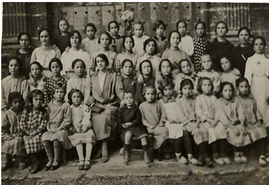
Imagen 2. Escuela unitaria de niñas de Tronchón, 1927.

Paralelamente a la realización de entrevistas se inició un trabajo de digitalización y análisis de los archivos escolares de cada una de las antiguas escuelas. De esta forma ampliábamos, complementábamos y contrastábamos la información recopilada a través de las entrevistas y situábamos en el lugar y tiempo a muchos de los objetos escolares. Los hallazgos durante el análisis documental fueron de gran valor: muchos de los archivos se han mantenido intactos y poseen documentación única en la provincia. Ejemplo de ello son el gran número de actas de la Junta Local de Instrucción Pública que desde el 1860 aportan datos sobre el nombramiento, toma de posesión y dotación anual de los maestros, sobre las visitas de la junta a las escuelas para vigilar la asistencia y el proceso de enseñanza aprendizaje, y sobre los gastos de manutención de la escuela, entre otros aspectos.