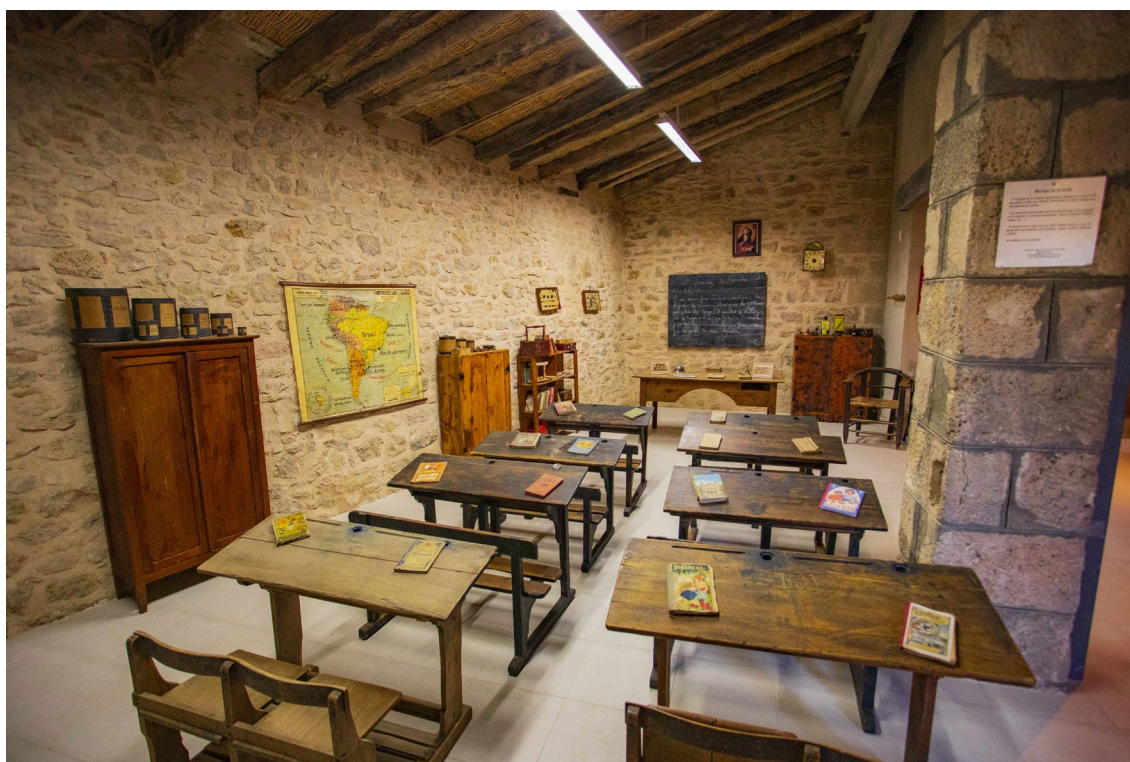
Imagen 8. Escuela antigua de Tronchón.