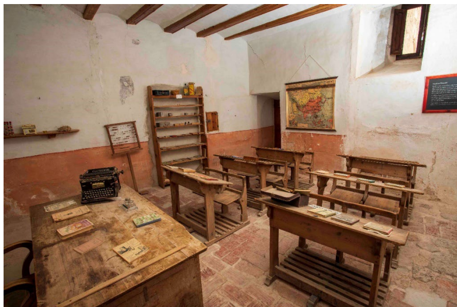
Imagen 10. Recreación de la escuela antigua de Mirambel

Actualmente se expone en la sacristía del convento de “Las Agustinas” el mobiliario y material didáctico de la escuela de niños.