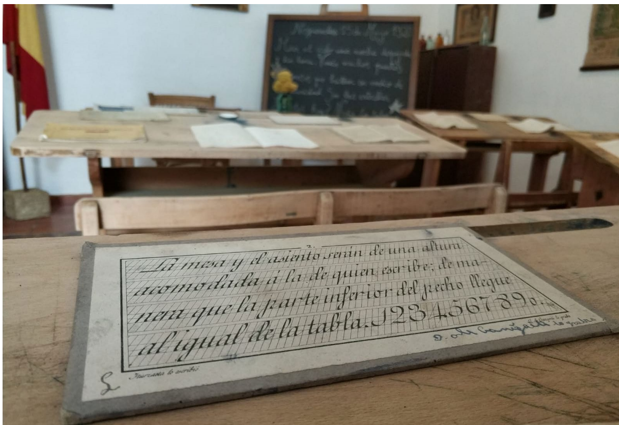
Imagen 12. Lámina de escritura colocada encima de uno de los pupitres del Museo de la Escuela de Mosqueruela.

las mesas para párvulos de pequeña altura en las realizaban sus trabajos y cooperaban hasta seis alumnos al mismo tiempo.