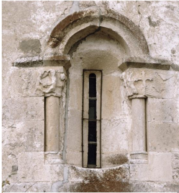
5. Irudia: Arraingo San Juanen ermitako absideko lehioa.

Beraz, tradizioa ez da geldia, eta historiaren bilakaerara lotuta dagoenez, kanpoko influentziak eta kultutzat daukagun artearen eragina jasotzen du. Esther Alegrek, arkitekturari erreferentzia eginez, estilo bat ulertzeko bere manifestazio herrikoiak ezagutzea funtsezkoa dela azaltzen du: bere esanetan kultuak soluzio batzuk sortzen ditu (espazialak, teknikoak, eskalak, etab.), eta hauek funtzionatzean, arkitektura herrikoiak arlo sinbolikoa sinplifikatu eta teknikoa erraztu ostean, eredu erraz eta errepikakorrek sortzen