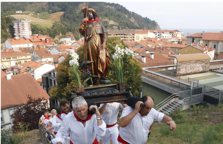
2. Irudia: Deba San Roke egunean prozesioan irudia ermitara igotzen.

Kristautasunaren lehen urteetan idolatriaren beldurra gainditu ostean, eliza hierarkikoko intelektualak konturatu ziren, erlikiekin lehenengo eta ondoren irudiak onartuz, jendearen fedea irabazteko sentikortasunetik jo behar zutela eta ez ideia abstraktuetatik 16 . Honek ekarritako polemikak alde batera utziz, eta irudiak letragabeko herriari doktrina kristaua erakusteko tresnatzat hartu ziren arren, argi dago bertute magiko eta miraritsua atxikitu zitzaizela, herriaren kultu objektu bihurtu zirelarik 17 . Ondorioz, nahiz eta ermitak ekimen xumeko tenplu kristauak izan, hauetan ere irudiak sortu dituzte, Basurkoko azaldutako erlazio sinple, zuzen eta errentagarriagoak lortuz.