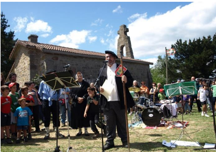
8. Irudia: Bizkargi eguna Gurutze Santuaren ermitan.

Hori horrela, kontserbazioa aipatutako mugimendutik planteatu daiteke, izan ere, tradizioa aldatu egiten da, eraldatze honek ekarri du ermiten funtzioa galtzea, eta ondorioz, ondare honekiko axolagabekeria. Bada hau kontuan hartuta, eta artearen historiaren ikerketatik planteatutako teorizazioan oinarrituta, ondare honetan auzokideen egungo balio antropologikoak indartzen dituen interbentzioak bideratu daitezke. Horrela, interbentzio hauekin areagotu egin daiteke ondare gisa ematen zaien balioa. Era berean, globalizazio testuinguruan ermiten balio identitarioa berreskuratu daiteke; are gehiago, obra monumentalak ez dauden tokietan egonik, manifestazio herrikoiak identitatean are nabarmenagoak bihurtu eta birbalioztatu daitezke 66 .