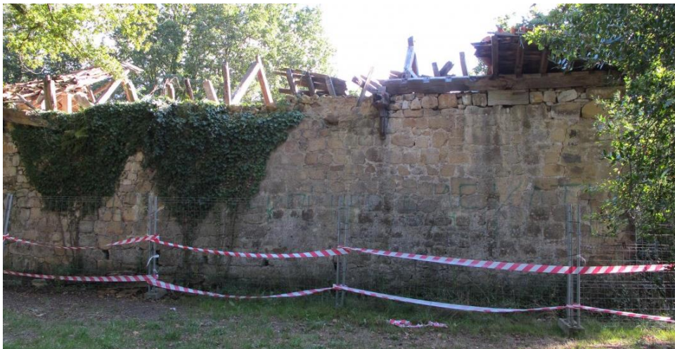
7. Irudia: San Joan Batailatzailearen ermita Zornotzako Ofrendoko gailurrean.

Lehenago ikusi dugu nola urteetan zehar auzokideak, beharrianak bultzatuta, izan diren ermitak zutik mantendu dituztenak. Baina landatar bizitza tradizionala desagertu egin da, 50 eta 60. hamarkadan hiriko industrietara emandako migrazioak edota landako produkzioan gertatutako modernizazioekin; honekin, landa guneko tradizio eta sinesmenak galdu dira 58 . Desagertuz joan dira, beraz, ermiten beharrak ekartzen zituen bizilagunen antolamendua, ermitarekin zituzten loturak, eta honekin, ermita bera.