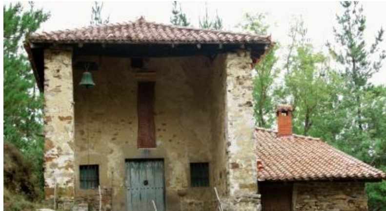
3. Irudia: Okondoko San Sebastianen ermita.

Beste kasu batzuetan, bizilagunak ziren ermitak beraien dirutik sustatzen zituztenak. Okondora itzuliko gara bertako zenbait promozioren izaera hausnartzeko.