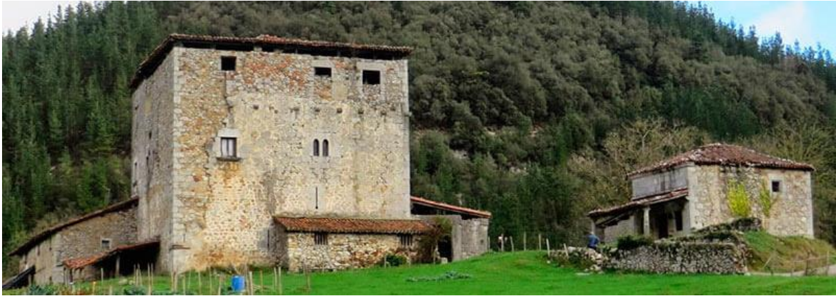
1. Irudia: Markina-Xemeingo San Joakin eta Santa Anaren ermita, Barroeta dorretxearen alboan.

parrokiatik aldendutako auzoak, nobleen etxe alboak edota mugak 10 sakralizatu dituzte.