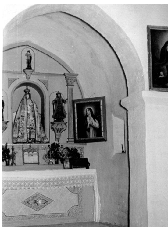
4. Irudia: Kontrastako Herrango San Martinen ermitako absidea barrutik.

Lehen hurbilketa batean, ermiten balorazio artistikoa egin nahi dugunean, ermitak arte ote direnaren duda dator burura, eta honekin disziplinan oinarrian dagoen galdera: zer da artea? Ez da definizio erraza, ez artea, eta ezta estetika, ez direlako esentzia unibertsalak; produktu kulturalak dira, gizarte eta historiaren arabera aldatu egiten direnak 34 . Hortaz, artea ez da objektuek berez duten ezaugarri bat. Fededunek ez zuten bereizketak egiten, egun arte eta erlijio banaketan egiten ditugunak 35 . Bada, artearen historiaren disziplinak XVIII. mendetik aurrera eraiki ditu kalitatezko kriterioak, eta gainera, ermitak eraiki zituztenak ez ziren