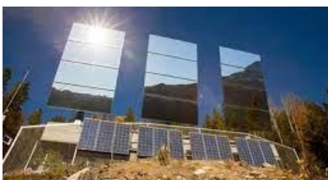
Irudia 15: Argiztapena hobetzeko ispiluak Norbegan