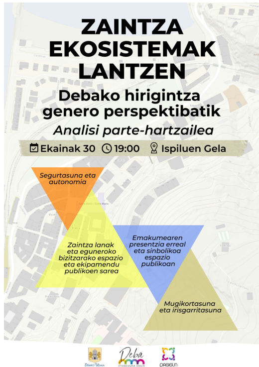
Irudia 6: Itziarko parte-hartze tailerreko kartela