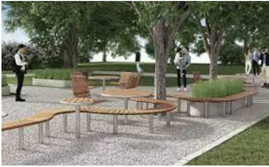
Irudia 17 eta Irudia 18: Taldean esertzea baimentzen duten hiri-altzariak