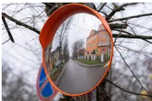
Irudia 14: Ikus-eremua hobetzeko ispilua