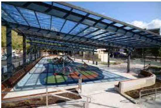
Irudia 21: Eremu publikoetan jatea baimentzen duten hiri-altzariak