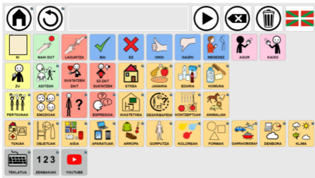
1. Irudia. Unairen komunikatzaile digitalaren irudia

Unaiantzat sortu den komunikatzaile digitalak 40 kategoria ditu, Unairen hiztegia ahalik eta aberatsena izateko asmoz (ikus 1. Irudia). Kategorien koloreei erreparatzen badiegu, SPC-ak markatzen dituen koloreak jarraitu dira: pertsonak eta izenordainak horiz, arlo soziala arrosaz, izen lagunak eta deskribatzaileak urdinez, aditzak berdez eta izenak eta sustantiboak laranjaz. Honekin batera, gris kolorea aukeratu da bereziagoak diren kategoriak azpimarratzeko, hala nola, zenbakiak, teklatura eta Youtubeko aukerak. Kolore ezberdinen erabilerak izugarri laguntzen dio Unairi behar dituen hitzak ahalik eta azkarren bilatzeko.